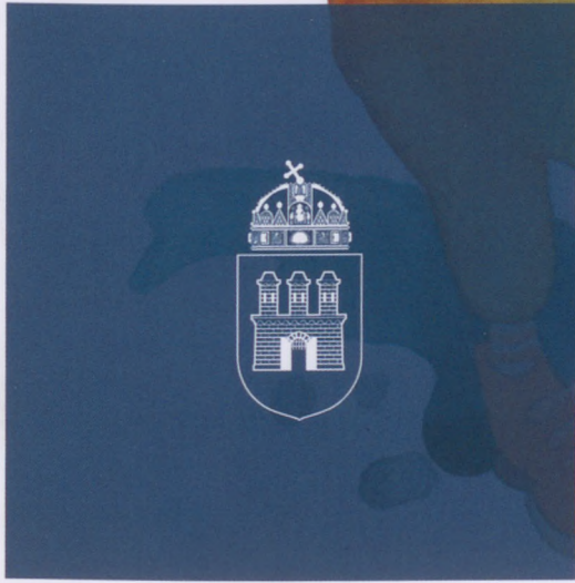
Damó István illusztrációja