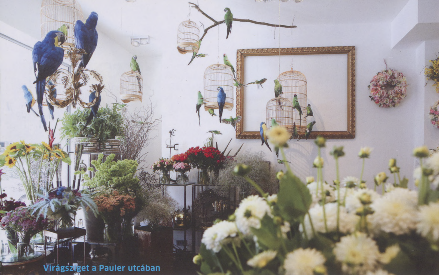
Virágüzlet a Pauler utcában