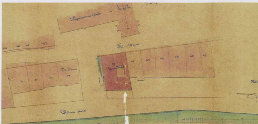
Helyszínrajz 1874.