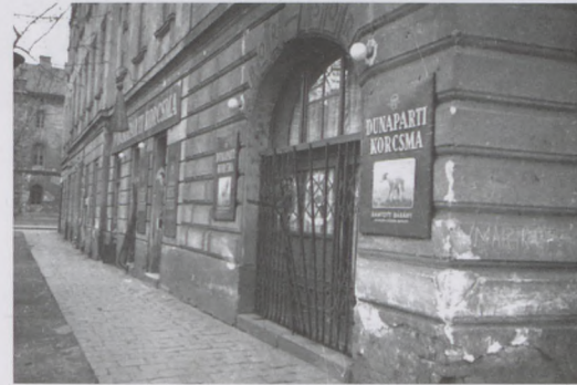
Halász utca a Bem rakpartról nézve, 1960.