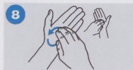
8. oly nagyon,