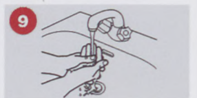
9. A juhásznak