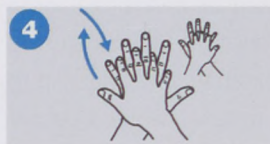
4. a juhászbojtárra.