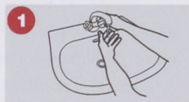
1. Tüzesen süss le