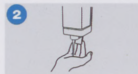
2. a nyári nap