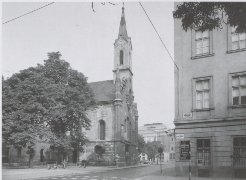
Halász utca - Fő utca sarok, háttérben a Budai kapucinus templom, 1967.

ték és elszállították. Az egykori gyógyszerész helyén a Fő utca és Halász utca sarkán előbb zöldséges volt, ma már a Horgásztanya Vendéglő. Hangulatos belső kiképzése a kármentővel, falra erősített csónakkal, kifeszített halászhálókkal hamisítatlan halászcárdá hangulatát kelti. Sőt, a halászléi is izletesek.