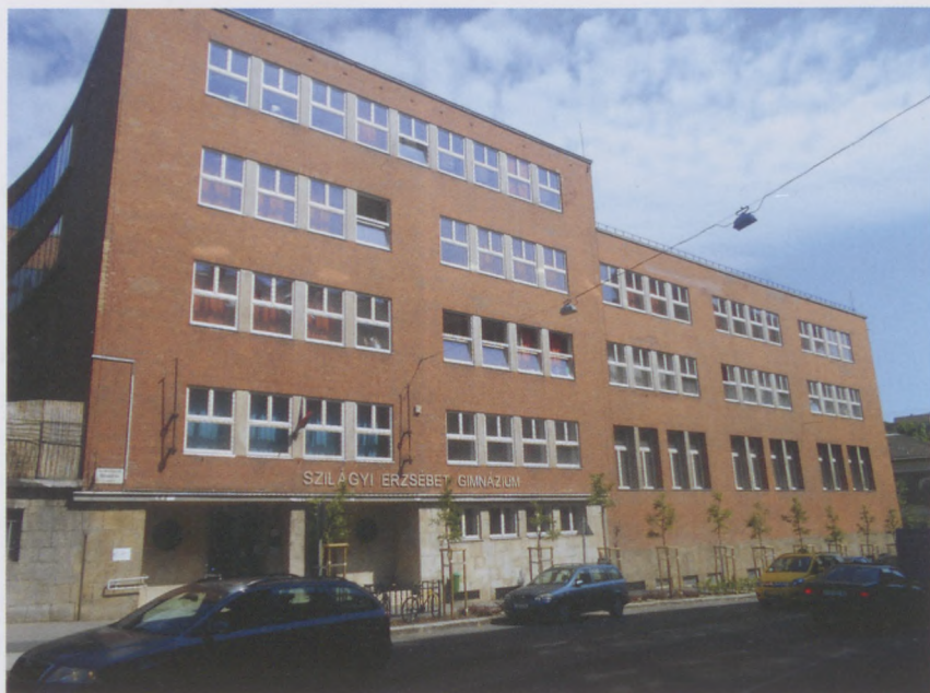
A Szilágyi Erzsébet Gimnázium épülete

A tanároktól megkérdeztük, hogy van-e otthon lehetőségük az órátartásra vagy a digitális tananyagok gyűjtésére, kidolgozására. Akinek nem volt – mert pl. otthon a gyerekei is a számítógép segítségével tanulnak – annak kikölcsönöztünk egy-egy laptopot.