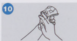
10. úgyis nagy