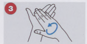
3. sugára Az ég tetejéről