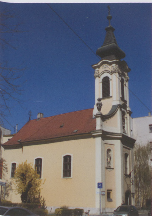
A Szent Flórián górkatolikus templom a Fő utcában