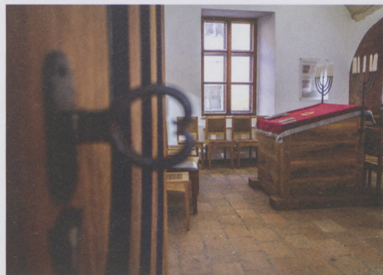
A budavári zsinagóga (a volt középkori zsidó imaház) a Tánácsics Mihály utcában

B. I.: – Én azt hiszem, hogy nem én mint lelki vezető, hanem az Isten Szentlelke tud erősíteni, vigasztalni, bátorítani és reményt adni. Magam azért imádkozom, hogy Isten tegyen alkalmassá arra, hogy a bezártságban élőket, a betegeket, a kárt szenvedetteket, a félelem foglyait az Ő igéjével