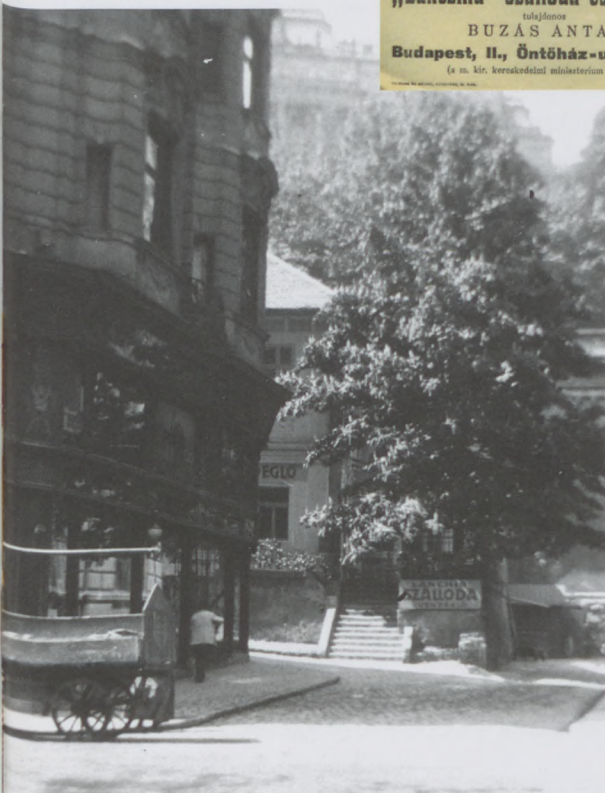
A Lánchíd utca a Stowasser házzal, háttérben az Öntőház utcai szálloda