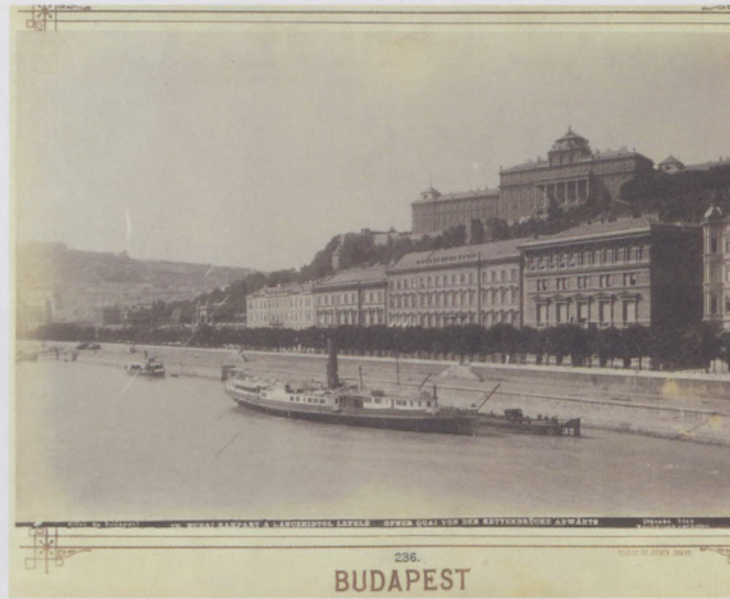
Rakpart a palotasorral, •

Két hatalmas vasajtó zárja le a támfal mellett garáznak tűnő, Horthy Miklós által 1936-tól kialakított kormányóvohelyet. Az Alagút déli oldalából is megközelíthető bunker kétszintes és 80 méter hosszú volt, amelyben szintenként 28 irodát rendeztek be. 1945 elején innen irányította a főváros „védelmét” Karl-Pfeffer