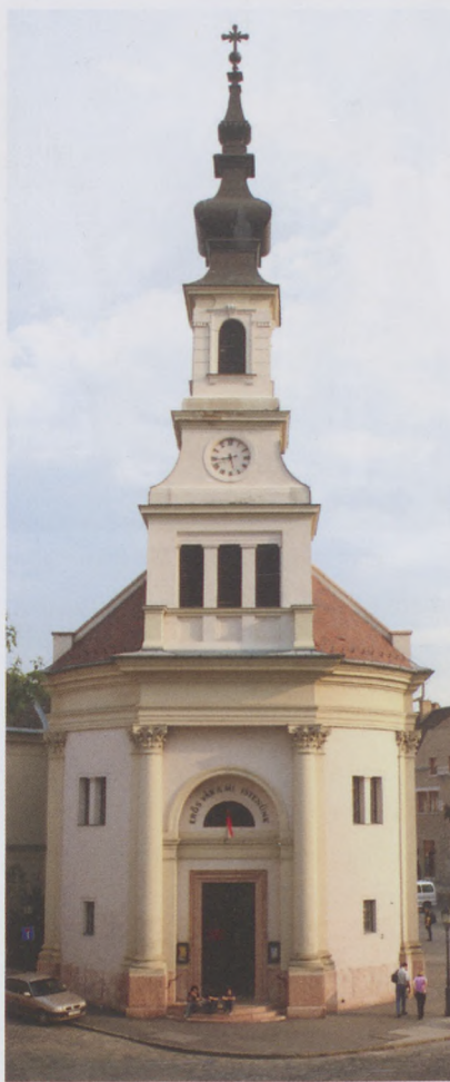
A Budavári Evangélikus Templom a Bécsi kapu téren

J. D.: – Olyan helyzet még egészen biztosan nem volt az egyházban, hogy nagyhéten, húsvétkor elmaradtak