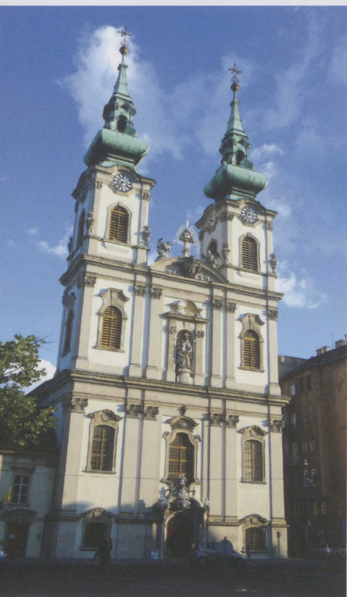
A Szent Anna katolikus plébániatemplom a Batthyány téren

B. I.: – A Budavári Evangélikus templomban mi március 15-én tartottunk utoljára istentiszteletet, és március 16-tól a Püspöki Tanácsunk rendelkezése szerint semmiféle közösségi alkalmat nem rendezünk. A gyülekezet tagjaival és közösségeivel sokféleképpen tartjuk a kapcsolatot. Sokaknak naponta bátorító üzenetet küldünk sms-ben vagy Messengeren. A kis közösségek tagjait – a bibliaórák résztvevőit, ifjúsági csoportokat, közösségeket – rendszeresen összehív-