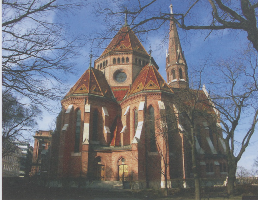
A Szilágyi Dezső téri református templom

juk Skype-on történő beszélgetésre, tanításra, együttlétre. Így szinte minden estére jut egy-két videobeszélgetés. Az énekkarok nem tudnak próbálni, de a próbák időpontjában, az internet segítségével mindkét énekkarunk összegyűlik közös imádságra és beszélgetésre. Ugyancsak a világháló segítségével folytatódik a lelki gondozás, az időseket pedig telefonon keressük meg. Kibővült a gyülekezeti levelezőlistánk, azon keresztül kiküldjük a lelki támogatást nyújtó anyagokat. A honlapunkra és a YouTube csatornánkra minden héten felkerül egy istentisztelet, egy bibliaórai tanítás és egy áhítat felvétele. Kialakítottunk egy önkéntesekből álló csoportot, amelynek fiatal tagjai néhány idősen segítenek a bevásárlásban, többen pedig a közösség tagjai számára szájmazsokot készítettek. Felkínáltuk a gyermekfelügyelet lehetőségét is a gyülekezetünk egyik termében. Munkatársaink otthon végzik a feladataikat, és csak alkalmanként jönnek fel a hivatalba, mi lelkészek azonban minden munkanap 9-től 13 óráig irodai ügyeletet tartunk. Minden este 7-kor pedig – „balkonénéklés” keretében – közös