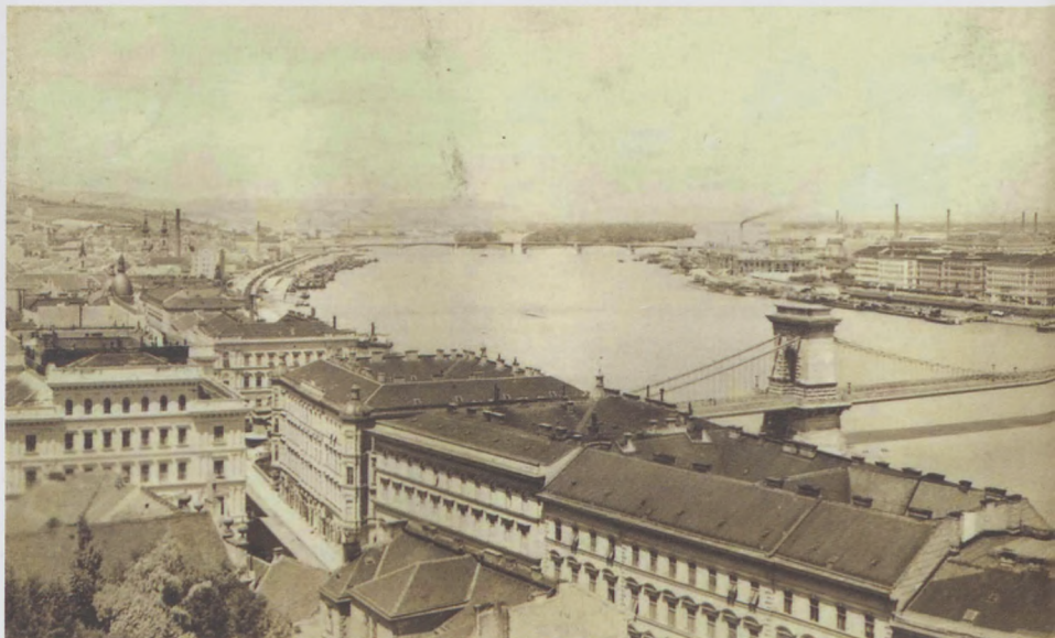
A kép bal sarkában az Öntőház utcai zsinagóga és a Kereskedelmi Minisztérium déli homlokzata, 1886.