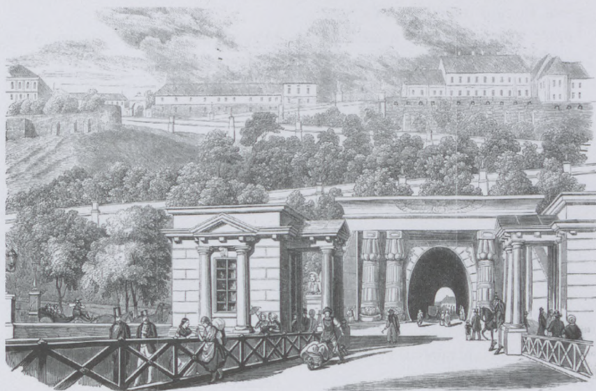
Vasárnapi Újság, 1854., az alagút másfajta kapuzattal

Építészeti munkássága szinte teljesen feldolgozatlan. Feltehetően azonban részt vett a budavári palota építkezéseiben is, 1844-ben pedig az Üllői úti laktanya munkálatainál működött közre. Javasolta, hogy köztéri alkotások elhelyezésekor tartsanak közvélemény-kutatást, népszavazást, felvetette egy Képzőművészeti Akadémia létrehozásának szükségességét: „mindaddig, míg a honban képzőművészeti akadémia fel nem áll (...) nálunk a művészetek fel nem virágozhatnak”. Már 1824-ben papírra vetette azt a megoldást, amit később felhasznált a balassagyarmati börtön tervezéséhez. (A gyarmati „fog ’s dologház” 1846-ban épült fel.) Önzetlenül tanította magyarra hivatali társait, ő volt kora