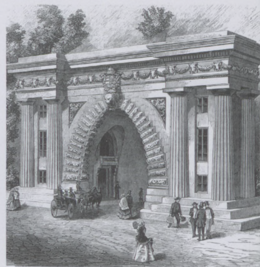
Vasárnapi Újság, 1856., az alagút megvalósult kapuzattal