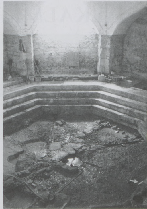
Rác fürdő: a medence alatt feltárt, kőből és fából készült török kori csatornarendszer.

A törökök Buda várára elsősorban mint erődre tekintettek, ennek megfelelően építkeztek. A házakat pusztulni hagyták, de dzsámikat és fürdőket építettek – nem csupán a Várban, de annak környezetében is. A mai Rác fürdő helyén a török korban is fürdő működött, Tímártelepi fürdő (Debaghane ilidzsaszí) néven. A mai Rudas fürdő elődjeként a Zöldoszlopos fürdő (Jesil direkli ilidzsza) állt, a Gellért fürdő helyén pedig a Nyitott tetejű fürdő (Acsik ilidzsza). A Tabán, bár lakossága kicserélődött, nem pusztult el: a törökök Krisztinavárossal egyesítve létrehozták a Hosszú Külvárost. Az akkoriban még Tímár-pataknak (Tobak szoju) nevezett,