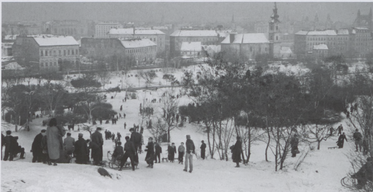
1956., Szánkózás a tabáni dombon

A kiskamaszkori éveim meghatározó élménye a testvérem megszületése volt, akinek gyorsan a „pótmamája” lettem, lévén 11 év a különbség kettőnk közt. Az ő gondozása közben ismertem meg azt a bizonyos, jellegzetes kisbabail-