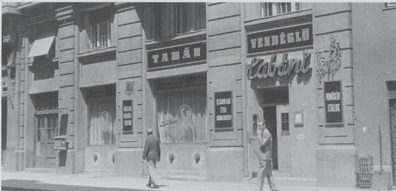
1966., Budapest, I., Attila út 27., Tabáni Kakas vendéglő • Fortepan

Az ételeknek is egész más illatuk volt, mint otthon – az óvodai, majd napközis étkeztetés szag- és ízvilágát nem tudja elfelejteni az, aki éveken át részesült a bableves, tejbegríz, töpörtyűkrémes kenyér, finomfőzelék, paradicsomos káposzta, sült hús és hasonló menük kínálatából.