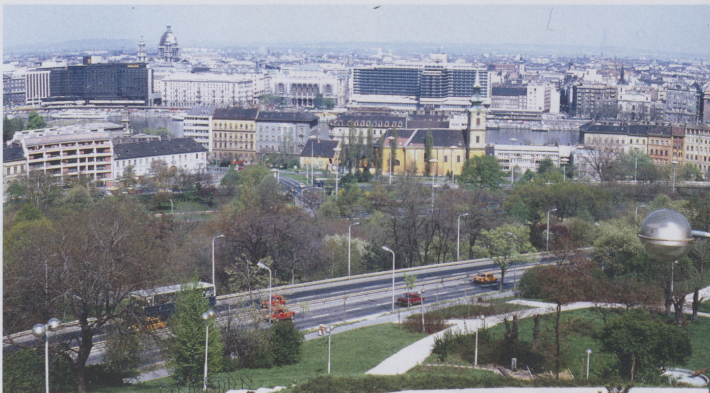
1984., kilátás a gellérthegyi víztározótól a Tabán és a Belváros felé.

1966-ban, az Eszperantó Világkongresszus alkalmával helyezték el az eszperantó emlékművet és kutat a Rácz fürdő közelében. Kőfalvi Gyula és Pfannl Egon munkáit egy közadakozásból emelt Ludwig Zamenhof szobor egészíti ki – Zamenhof volt az eszperantó mozgalom megteremtője. Az Apród utca 10. előtt Virág Benedek emlékére állítottak szobrot, mellette a Tabán Társaság emléktáblájával. Az egykori Kereszt tér helyét ma is könnyű megtalálni, csak a keresztet kell megkeresni a domboldalban. Felette egy 1956-os emlékmű áll. A híd lehajtójának közelében egy faragott szikladarabon az Ördög-árokra emlékeztető szöveget olvashatunk. Egykori munkahelyének, a Semmelweis Orvostörténeti Múzeumnak a szomszédságában állították fel Antall József miniszterelnök mellsobrát 2003-ban. A Fogas utca és a Döbrentei utca sarkán pedig