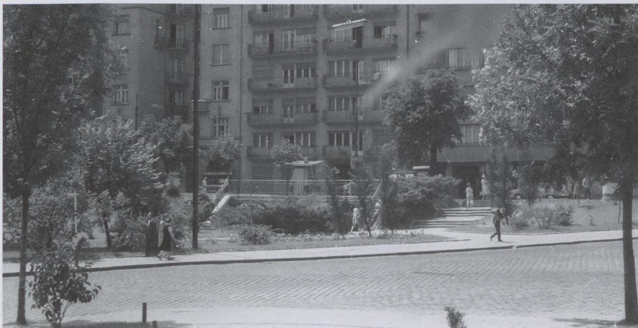
1963., Alagút utca–Pauler utca sarok, szemben a Krisztina körút házsora

Jó látni, hogy a lakóhelyünk folyamatosan fejlődik, szépül, de jó néha előkaparni morzsákat a múltból, kicsit megállni, emlékezni, felidézni a múlt ízeit, illatait, hangulatait.