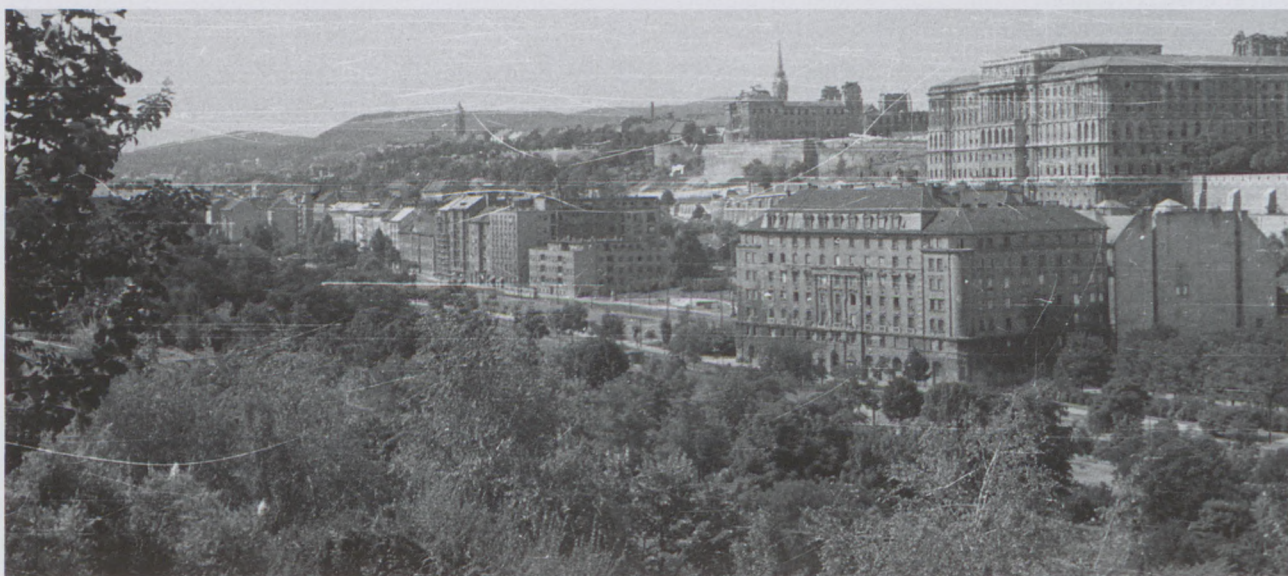
1959., kilátás a Gellért-hegyről a budai Vár felé, előtérben a Bethlen-udvar

5 éves koromtól a nagyszüleim már nem velünk éltek, így óvodába kellett járnom. Az óvoda az Attila úton működött, reggelente a Vérmező szélén siettünk a villamostól Anyukámmal. Ahányszor eszembe jutott életem során, hogy hány sötét, esőszagú reggelen trappoltunk azon az úton, mindig megborzongok, és látom magam előtt, ahogy lépkedek át a tekergőző giliszták fölött, szomorúan, szorongva az idegen környezet, az otthon melegének, nyugalmanak megszűnté, a családdal töltött idő pár órára csökkenése miatt.