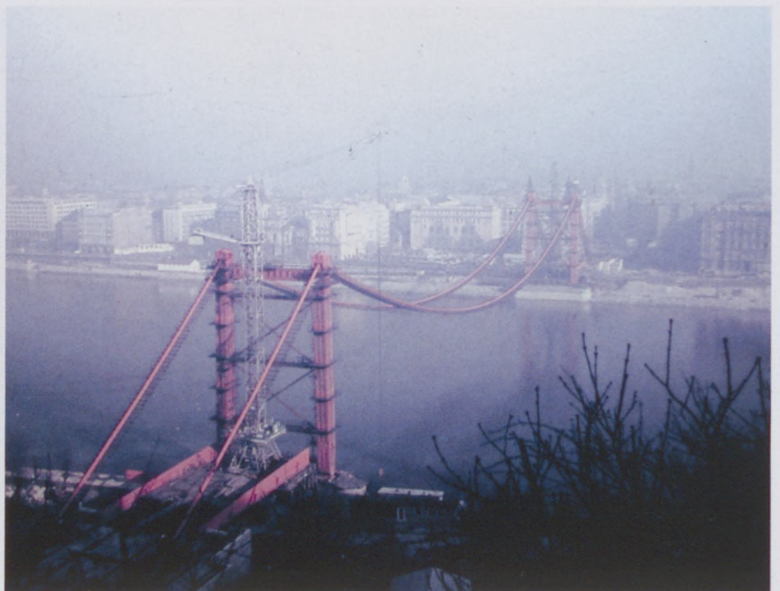
1963., az épülő Erzsébet híd a Gellért-hegyről fotózva.