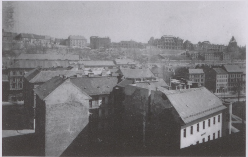
Krisztinaváros látképe a templomtoronyból, balra a Roham utca, jobbra a Horváth-kert egy részlete, háttérben a romos Királyi Palota (ma Budavári Palota), 1946

A nyilas terror árnyékában nagy öröm volt meghallaniuk, amikor a pesti ol-