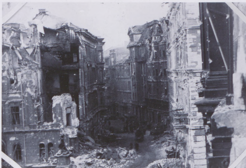
Lánchíd utca, 1945

Idővel a Fiume varázsa megkopott, másodosztályú szállodává vált. Forgalmát még biztosította, hogy előtte kötöttek ki a gőzhajók a Csepel-sziget falvai vagy a Dunakanyar felé tartva. A huszadik század elején már egyenesen azt írta