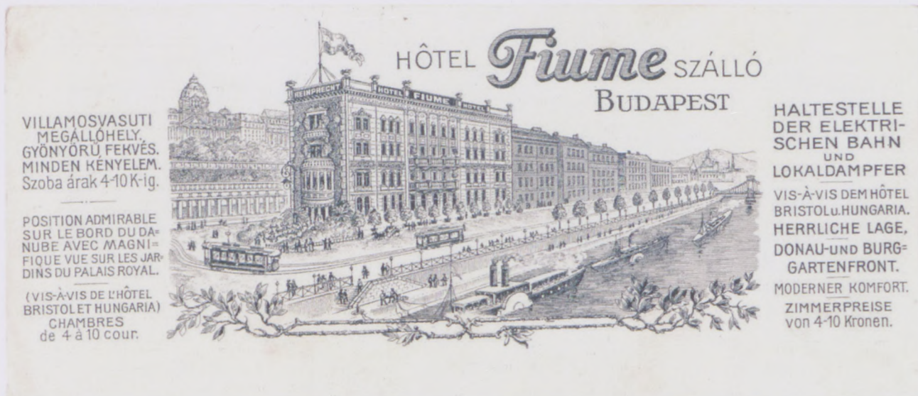
Korabeli hirdetés

A Lánchíd utcában páratlan házsorozat sorakoznak egymás után – de hova lett a páros oldal? Sétánkat a Lánchíd utca 12. alatt egykor állott szállodával zárjuk.