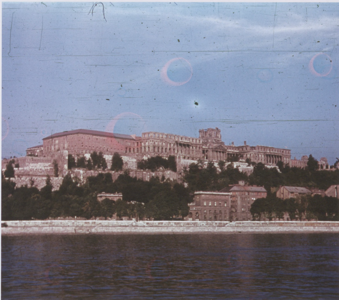
1955 körül: a házsor is eltűnt, és a Vár kupolája is.