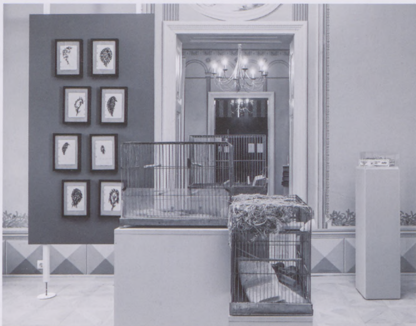
Hiányzásra kijelölt hely • Fotó: Szilágyi Lenke

2021. október 2.–2022. április 10. (emeleti teremsor) HIÁNYZÁSRA KIJELÖLT HELY Tandori jelenléte(i) – emlékkiállítás