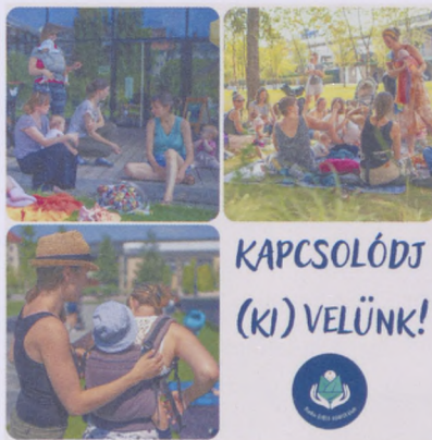
Baba-mama klub.

Ha (ki)kapcsolódnál vagy szabadon beszélgetnél támogató közegben, itt bátran kérdezhetsz. Cserélj tapasztalatot másokkal a kisgyermekes lét örömeiről, kihívásairól! Babahordozás, szoptatási tanácsadás, mosható