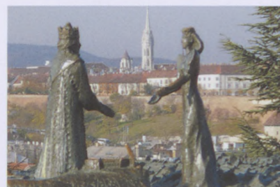
Kilátókő szobor

Az egyesület várja az érdeklődőket áprilisi klubnapjára. A nap témája: