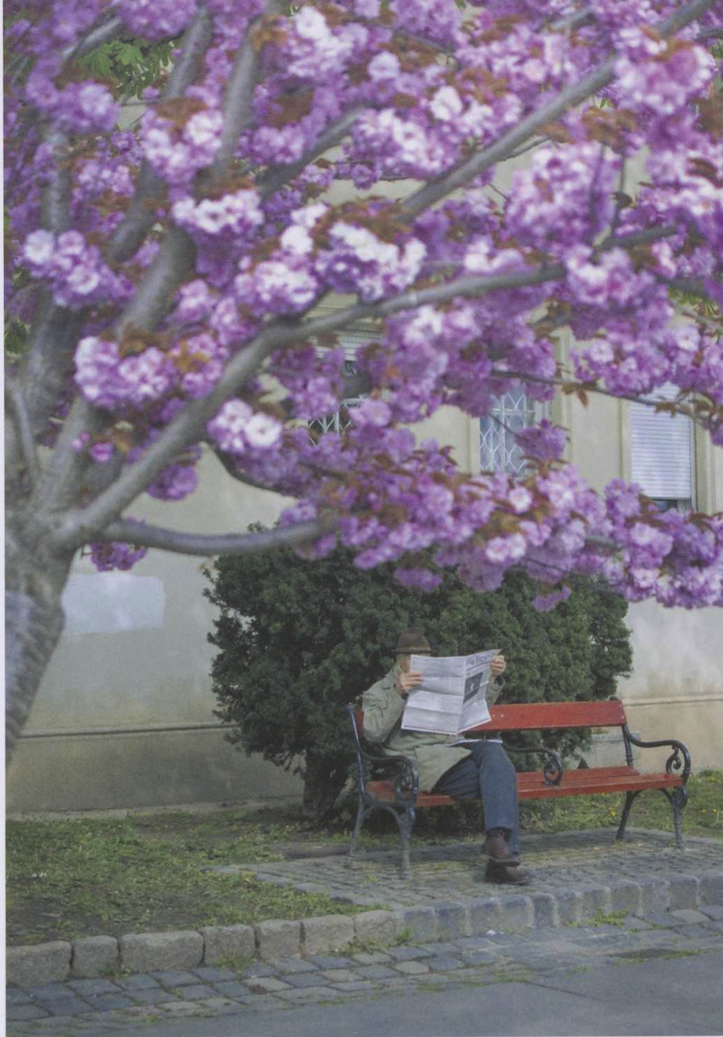
1. helyezett, B. Tier Noémi