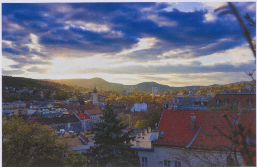
3. helyezett, Wágner Dénes