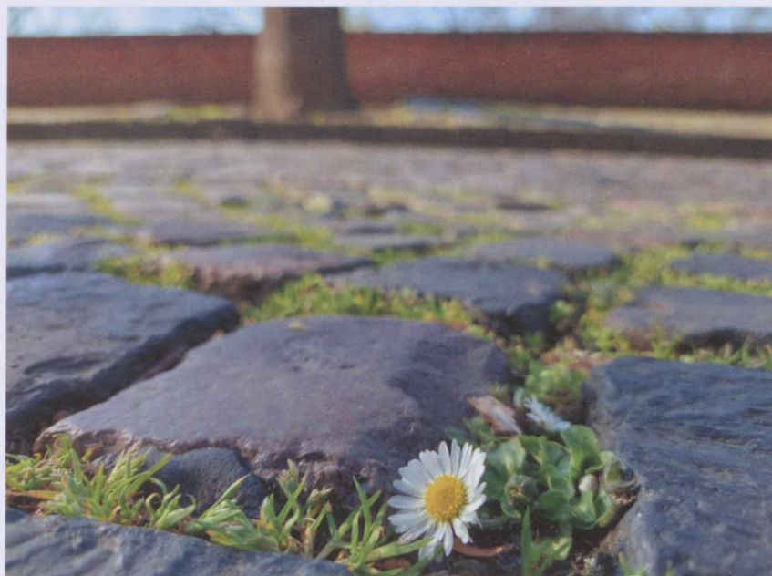
2. helyezett, Lerinc Emese

Köszönjük mindenkinek a részvételt. Figyeljék továbbra is a budavar.hu-t, mert a jövőben is készülünk hasonló pályázattal!