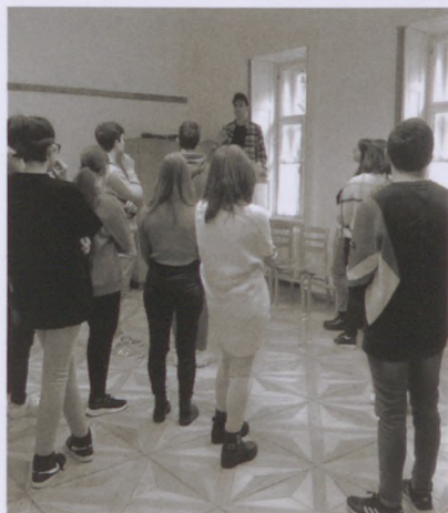
Csere c. előadás • Fotó: Török Tímea

A férőhelyek száma korlátozott, így a részvételi szándékot kérjük a paralel-csoport@gmail.com címen jelezni.