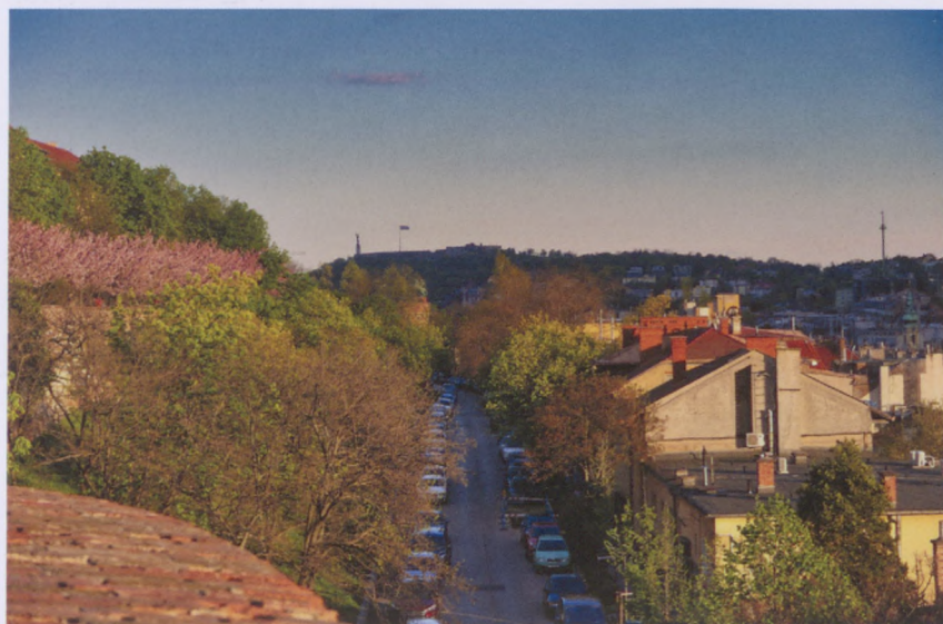
3. helyezett, Wágner Dénes