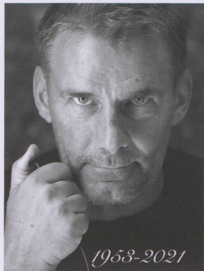
Fotó: Rákoskerti László

A kerületben élt Rákoskerti László fényképész, számos reklám és divatfotó alkotója augusztus 22-én lenne 69 éves. A tiszteletére rendezett kiállításon az érdeklődők az alkotó gazdag életművéből láthatnak egy szubjektív válogatást. „ Nem fotóművész vagyok, hanem alkalmazott fotográfus! ” – mondta, képei mégis művészi igényességűek voltak, bár kiállítás formájában eddig nem láthatta őket a közönség.