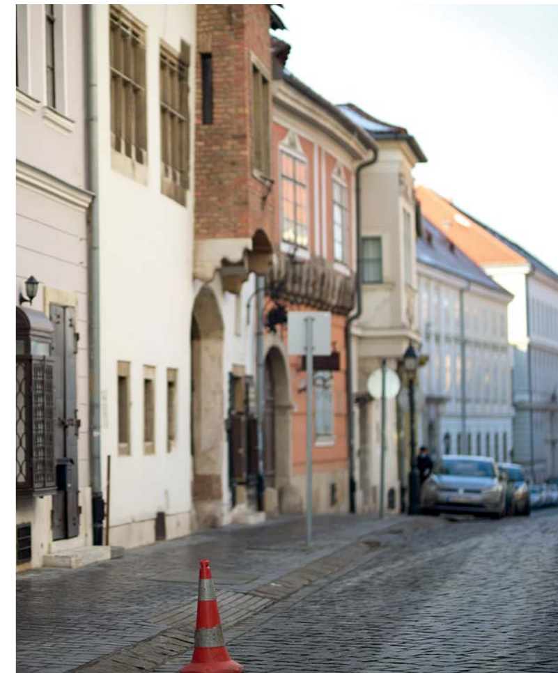
Négy év alatt nem nagyon történt érdemi előrehaladás