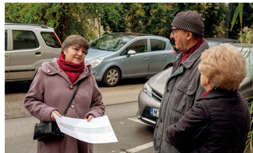
A sorozat tudatosan nem feltétlen szakpolitikai kérdések mentén halad