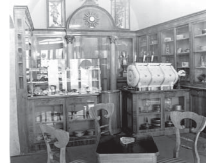
A cukrászda berendezése 1975-ben