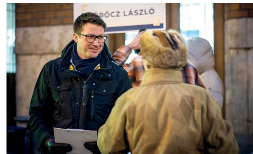
Több mint kétezer-ötszázan töltötték ki a kérdőíveket

A Fidesz nem bírta a véletlenre, hogy mindenki véleményét nyilváníthasson: a kérdőíveket eljuttatták a kerületi postaládákba, az érdeklődők pedig a folyamatos kitélepüléseken, a kerületi Fidesz- és KDNP-irodában és online is kitölthették