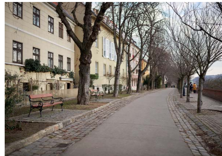
Több mint ezer családot érint a megvásárlás lehetősége

A hozzánk forduló I. kerületiek szerint ez a magatartás enged arra következtetni, hogy V. Naszályi Márta pártpolitikai és ideológiai elgondolások mentén szeretné felhasználni a „sajátjának tekintett” ingatlanállományt. Mint elmondták, a polgármester és köre egy 2020 novemberében tartott lakossági fórumon olyan ingatlankonceptiót vázolt fel, amely szerint: