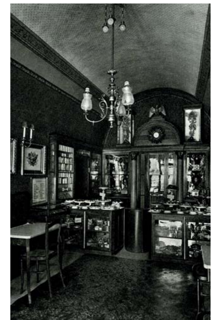
A Ruszwurm belseje 1928-ban