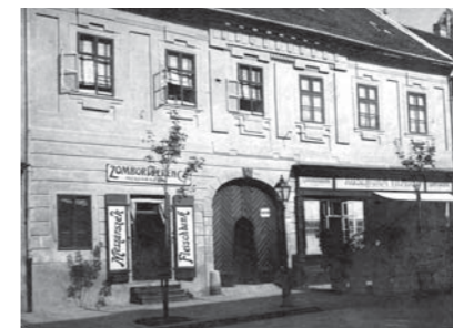
A Ruszwurm bejárata az 1930-as években

A Ruszwurm már több mint hetven éve üzemelt, amikor a Vár mai képét alapvetően meghatározó Halászbástya megépült. Így a cukrászda legalább annyira hozzátartozik a Várhoz, mint a Szentháromság tér vagy a Mátyás-templom. A „beülni a Ruszwurmbe” rengeteg generáció számára jelentett alapélményt. Reméljük, hogy ez így is marad! Fotóválogatásunk felidézi a cukrászműhely történetét.