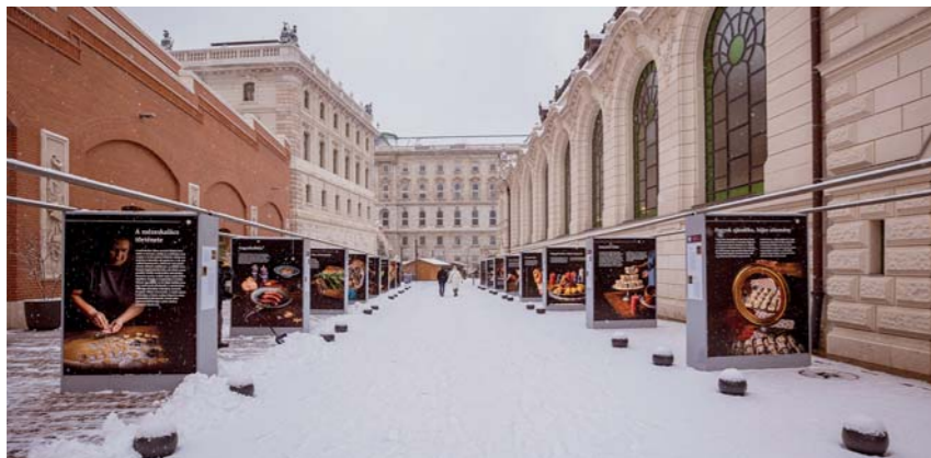
A szabadtéri tárlat egészen január végéig látható

Szabadtéri fotókiállítás karácsonyi ínycségekről Borbás Marcsi tálalásában