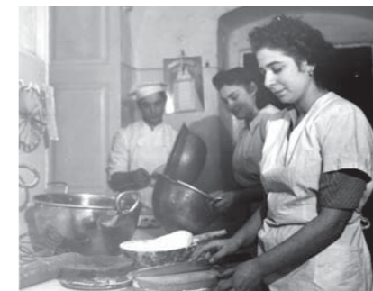
A Ruszwurm konyhája 1930-ban