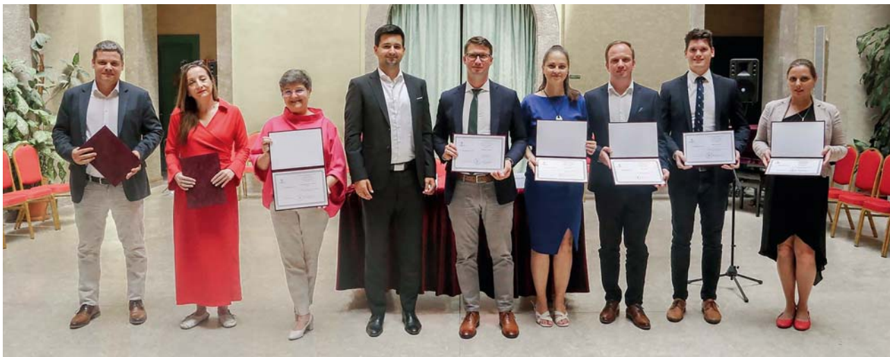
Az idei önkormányzati választáson mandátumot nyert I. kerületi képviselők október elsejével állnak munkába