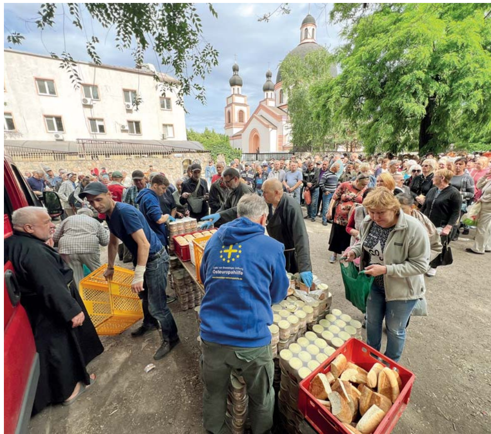
Tartós élelmiszerekből álló csomagokat osztottak Zaporizzsájában

száltak, mert nincs rá munkáskéz. Volt, hogy az aggregátort kellett beüzemelni, hogy az áramszünetek idején is tudják működtetni az elektromos targoncát, legyen világítás és működjön minden, amihez áram kell.