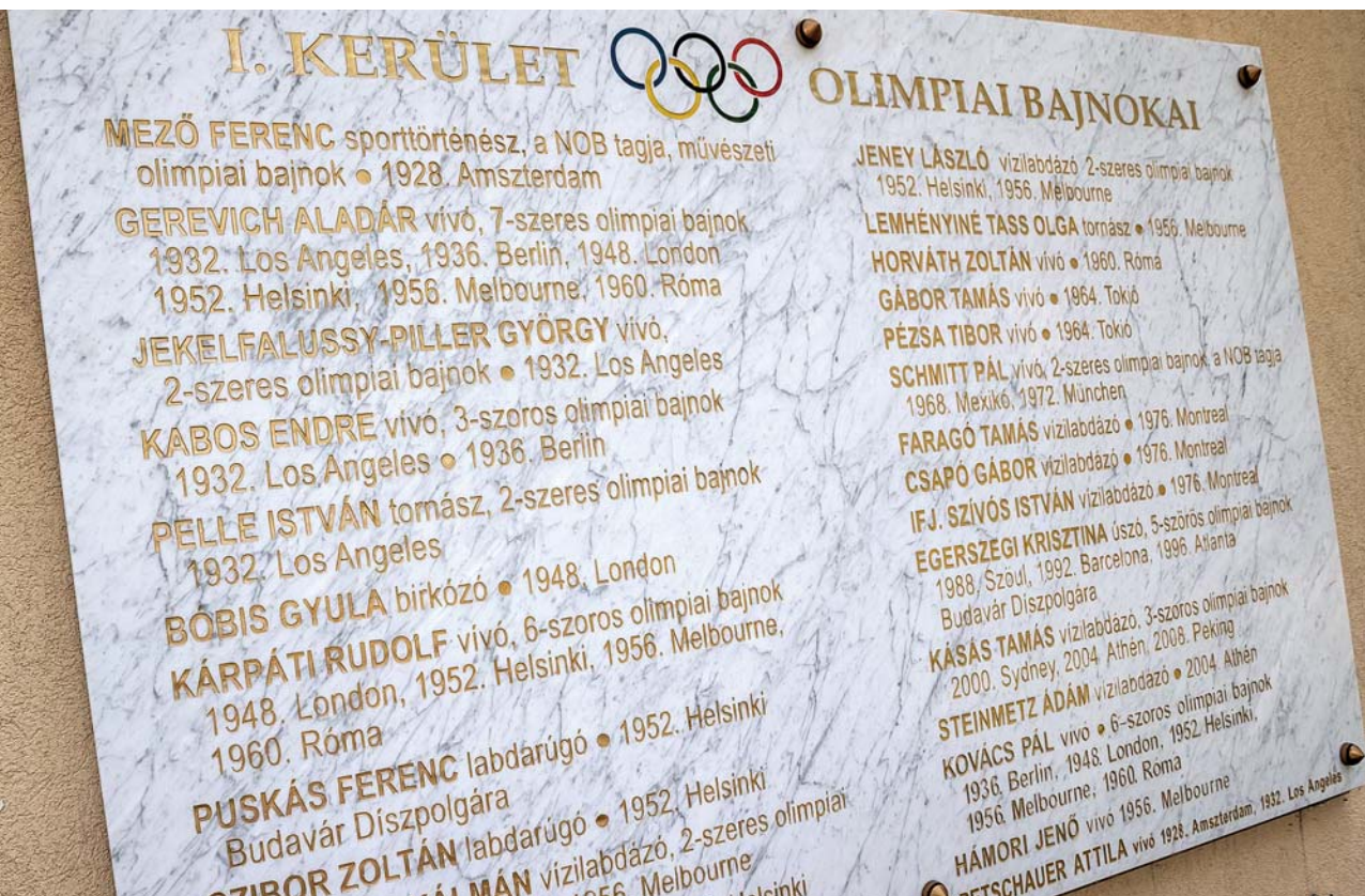
Az I. kerülethez kötődő olimpiai bajnokok emléktáblája a Czákó utcai Sport- és Szabadidőközpontban

Két hét múlva kezdődik a XXXIII. nyári olimpia · Hány érmet várhatunk 2024-ben Párizsban?