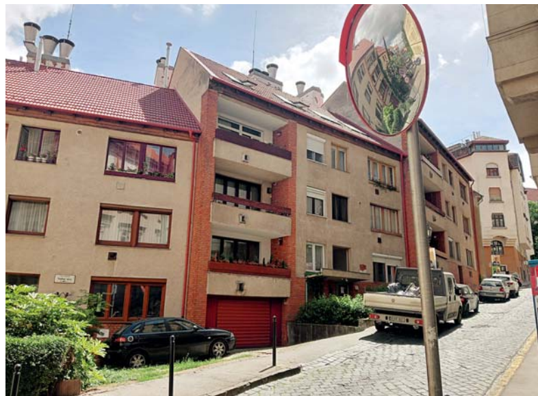
Buchwald Franciska Szalag utcai otthona nem létezik már, modern épületek vették

vüli császári haderők főparancsnokaként, az udvar rá osztotta a szabadságküzdelem vérbe fojtását. Százakat küldött osztrák börtönökbe, útját kivégzések szegélyezték.