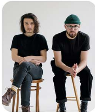
Platon Karataev duó