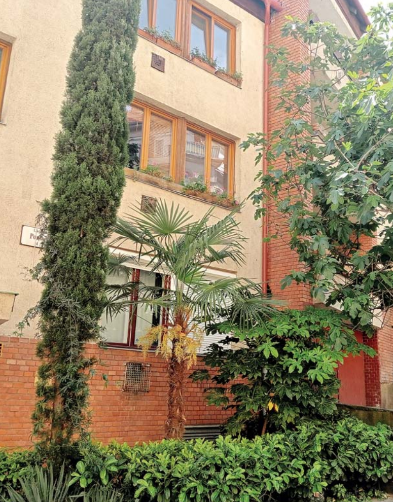
át a terepet, de a napsütötte Ponty utcában remekül megél a ciprusfa