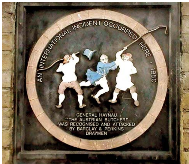
Haynau londoni afférjának emléket állító tábla

Kegyetlensége, erőszakossága már az olasz fronton megmutatkozott, a bresciai csata után parancsára még ezer embert öldöstek le a város utcáin, és valami érthetetlen aberráltságból számos asszonyt vesszőztetett meg. El is nevezték bresciai hiénának. Ezek után érkezett Magyarországra, immár az Itáliai kí-