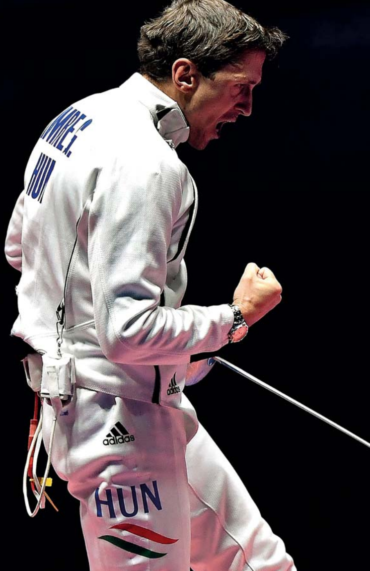
A 2016-os riói párbajtőr egyéni döntőjében