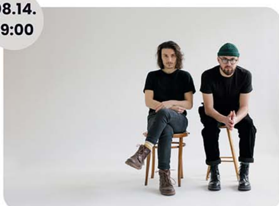
Platon Karataev duó