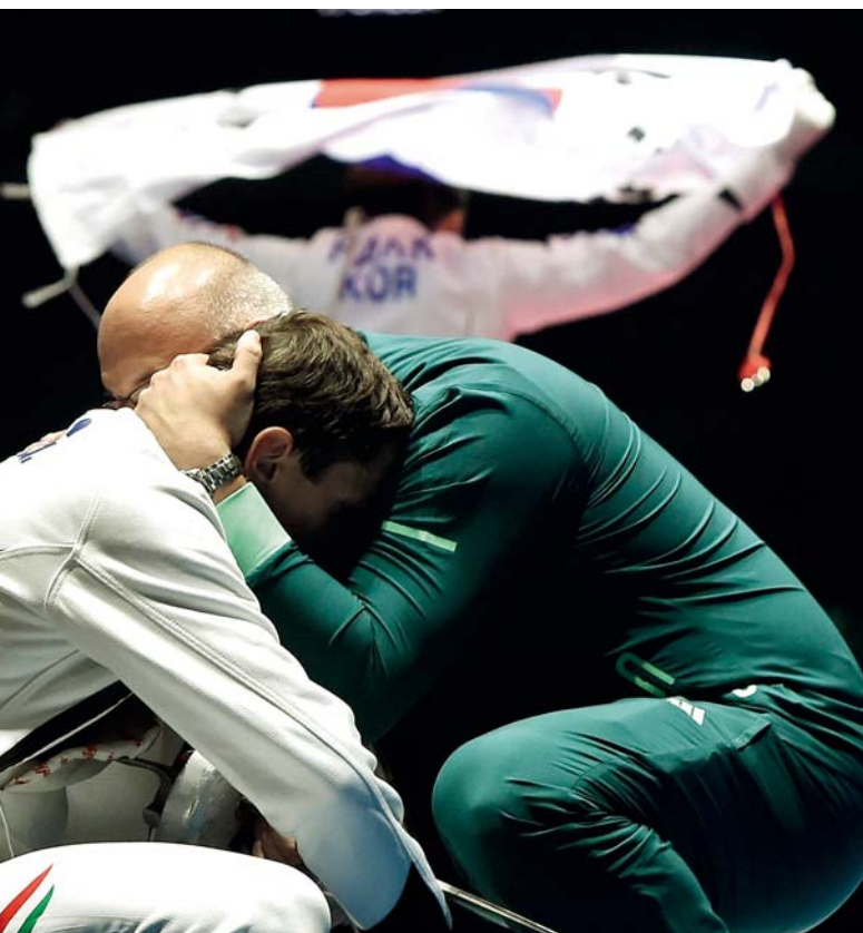
Edzői ölelés az elvesztett olimpiai döntő után