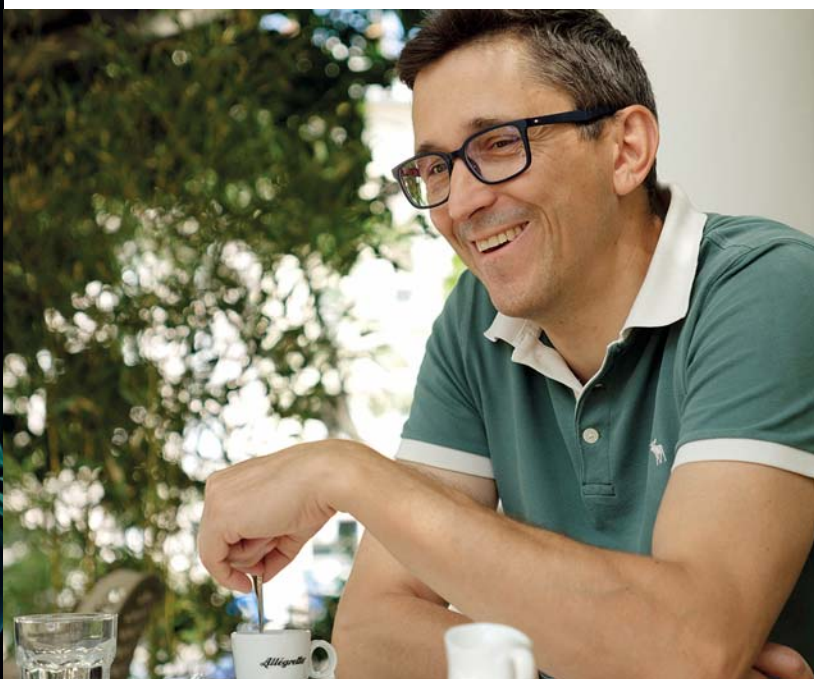
Nehéz megjósolni, hány érmet szerzünk Párizsban