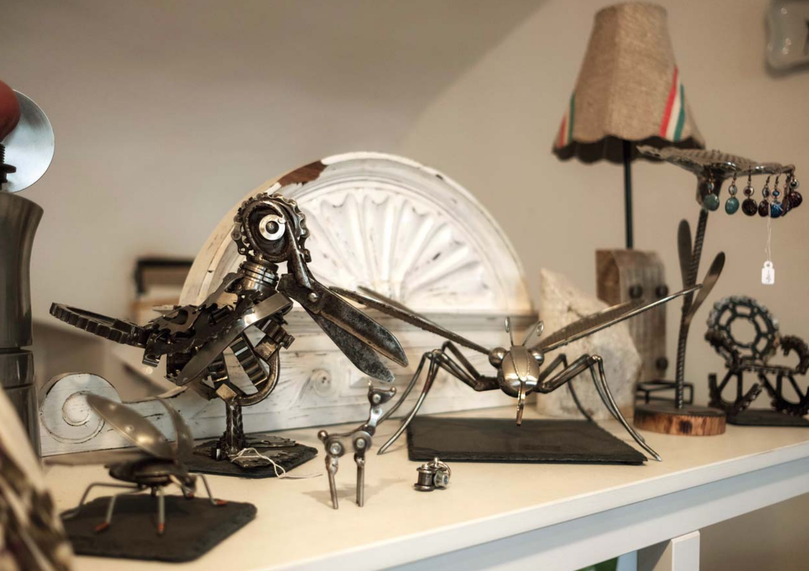
Egyre többeket érdekel a hulladékmentes újrahasznosítás témája. Fém tárgyak használati eszközökből