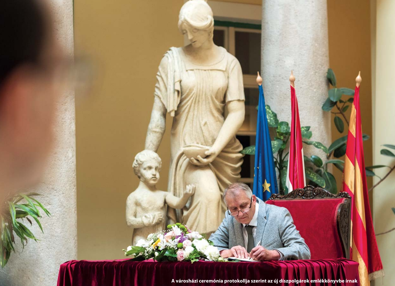
A városközi ceremónia protokollja szerint az új díszpolgárok emlékkönyvbe írnak