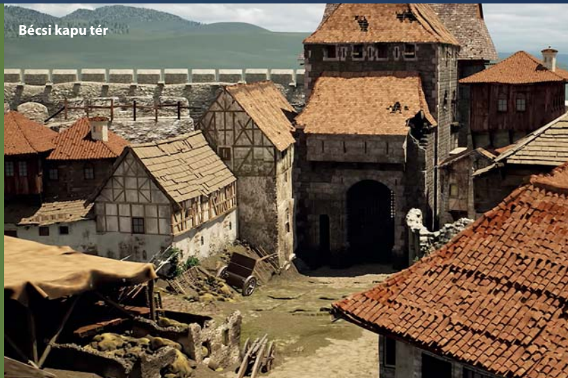
Bécsi kapu tér