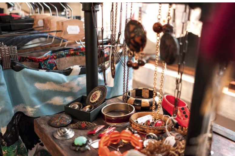
Ékszerek minden mennyiségben a piciny boltban

– Igen, sokszor jönnek be gyerekek is a szülőikkel, rácsodálkoznak a régi telefonra, hegedűre. Azt látom, hogy a környékbeli lakosok kimondottan szeretik ezt az antik vonalat.