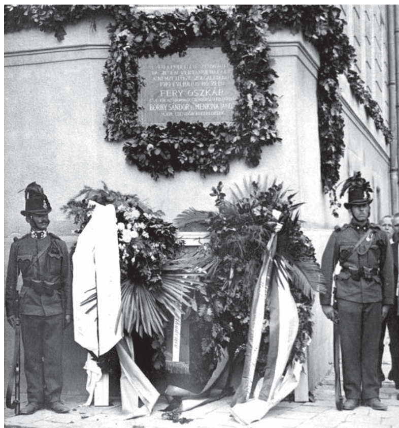
Az eredeti, 1921. július 21-én felavatott emléktábla a Fery Oszkár utcában

Első ízben július 7-én, a sikertelen június 24-ei ellenforradalom utáni megtorlások és túszedések keretében tartóztatták le. Ekkor nyolc napot raboskodott a kommunista detektívek főhadiszállásául szolgáló Országházban. A fogságban nyíltan hangoztatta királpárti nézeteit, és élesen kikelt a kínzások és a foglyokkal való embertelen bánásmód ellen. Csak az olasz antantmisszió közbenjárására helyezték szabadlábra. Július 15-én