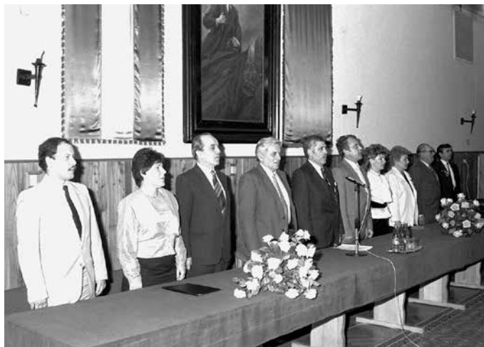
A MEDOSZ elnökségi ülése

12 normál ürméter ágfára vagy készlet hiányában ugyanannyi vékony dorongfára (botfára) volt jogosult, ha a munkavállaló 40 m 3 faanyagot bármilyen választékká feldolgozott, vagy pedig 40 napon