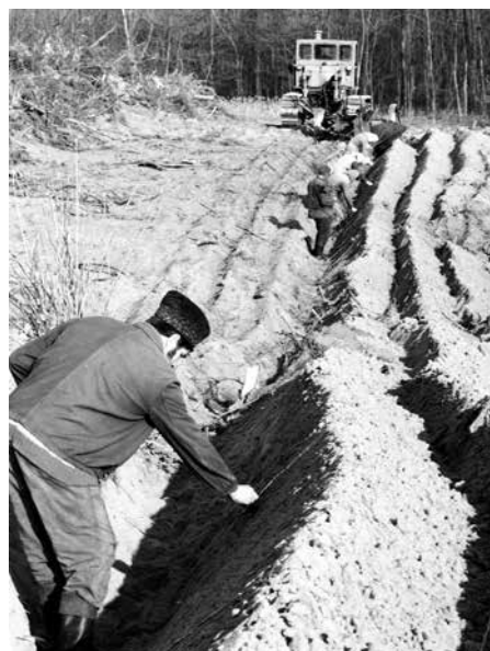
Erdőfelújítás a Kiskunságban

„Az MTA Erdészeti Bizottsága képviselőiben és erdőmérnök társaink nevében tisztelettel felkérjük, hogy vállalja el a reményeink szerint még február hónapban