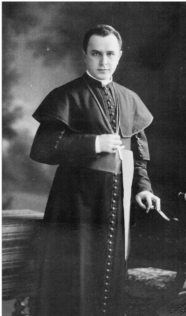
Glattfelder Gyula püspök

molóval. A püspökéletrajzokat tartalmazó kézirat a „Chronica Aulae Episcopalis Timisoaraensis” cím alatt ismert. 3