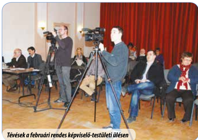
Tévések a februári rendes képviselő-testületi ülésen

Közmeghallgatás A képviselő-testület április 4-én közmeghallgatást tart, 17 órai kezdettel. A közmeghallgatás helye a József Attila Művelődési Ház nagyterme. Minden fóti lakost szeretettel várunk!