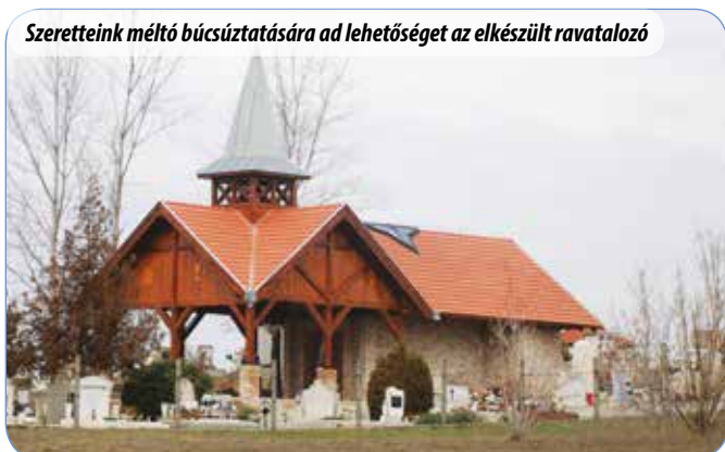
Szeretteink méltó búcsúztatására ad lehetőséget az elkészült ravatalozó