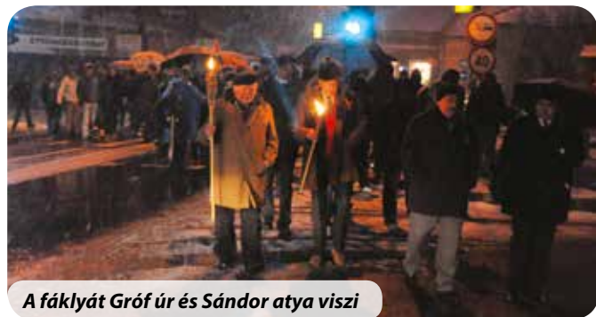
A fáklyát Gróf úr és Sándor atya viszi

Köszönjük ezt a szokásosnál hosszabbra nyúlt, de sokáig emlékezetes, felemelő ünnepséget a szervezőknek.