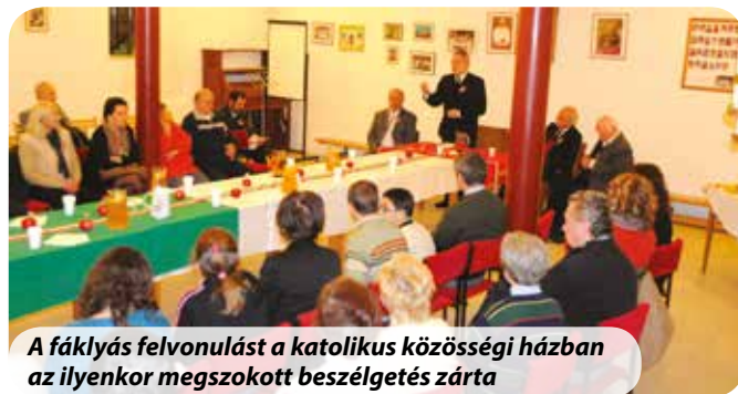
A fáklyás felvonulást a katolikus közösségi házban az ilyenkor megszokott beszélgetés zárta