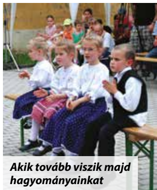
Akik tovább viszik majd hagyományainkat