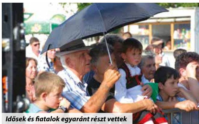
Idősek és fiatalok egyaránt részt vettek