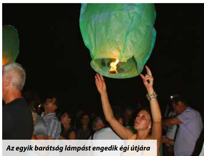
Az egyik barátság lámpást engedik égi útjára