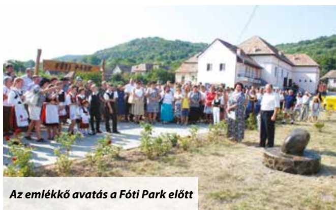
Az emlékkő avatás a Fóti Park előtt