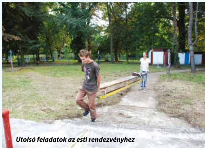
Utolsó feladatok az esti rendezvényhez

A meghívó a víznélküli medence ünnepélyes megnyitójára szól, s valóban, augusztus 30-án megtisztult, rendbe tett környezet várta a vendégeket, zenével, vidám hangulattal és afgán ízekkel.