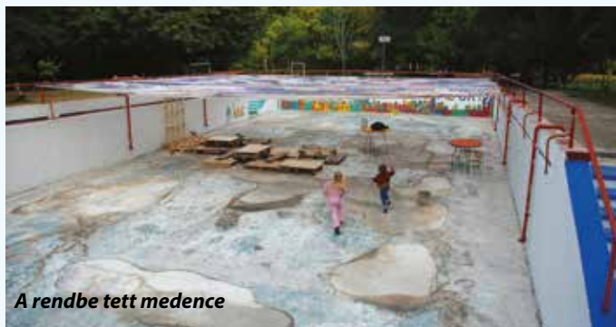
A rendbe tett medence