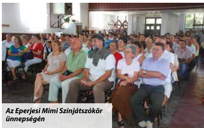
Az Eperjesi Mimi Színjátszókör ünnepségén