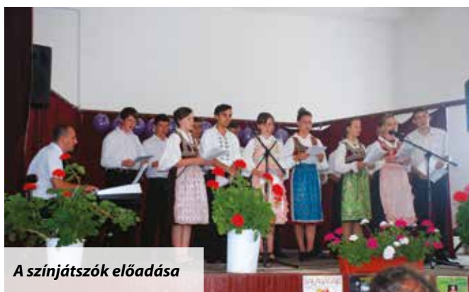
A színjátszók előadása