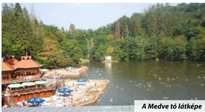
A Medve tó látképe

Az összeszokott társaság korábban már jónéhány hasonló fegyvertényt hajtott végre, körbekerekezték Erdélyt, s kenukkal végigeztek sok folyót, például a Mosoni-Dunát, a Tiszát, az Ipolyt.