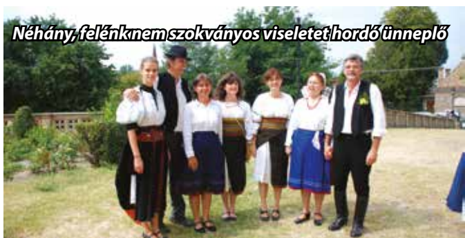
Néhány, felénk nem szokványos viseletet hordó ünnepelő

Fóti Hírnök • ISSN 2062-6754 • Kiadja Fót Város Önkormányzatának megbízásából a Windhager Kft. Decens Kiadója.