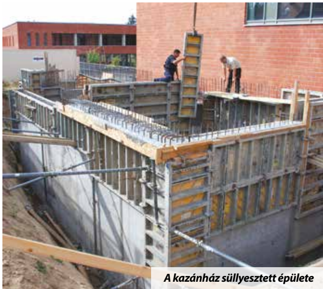
A kazánház süllyesztett épülete