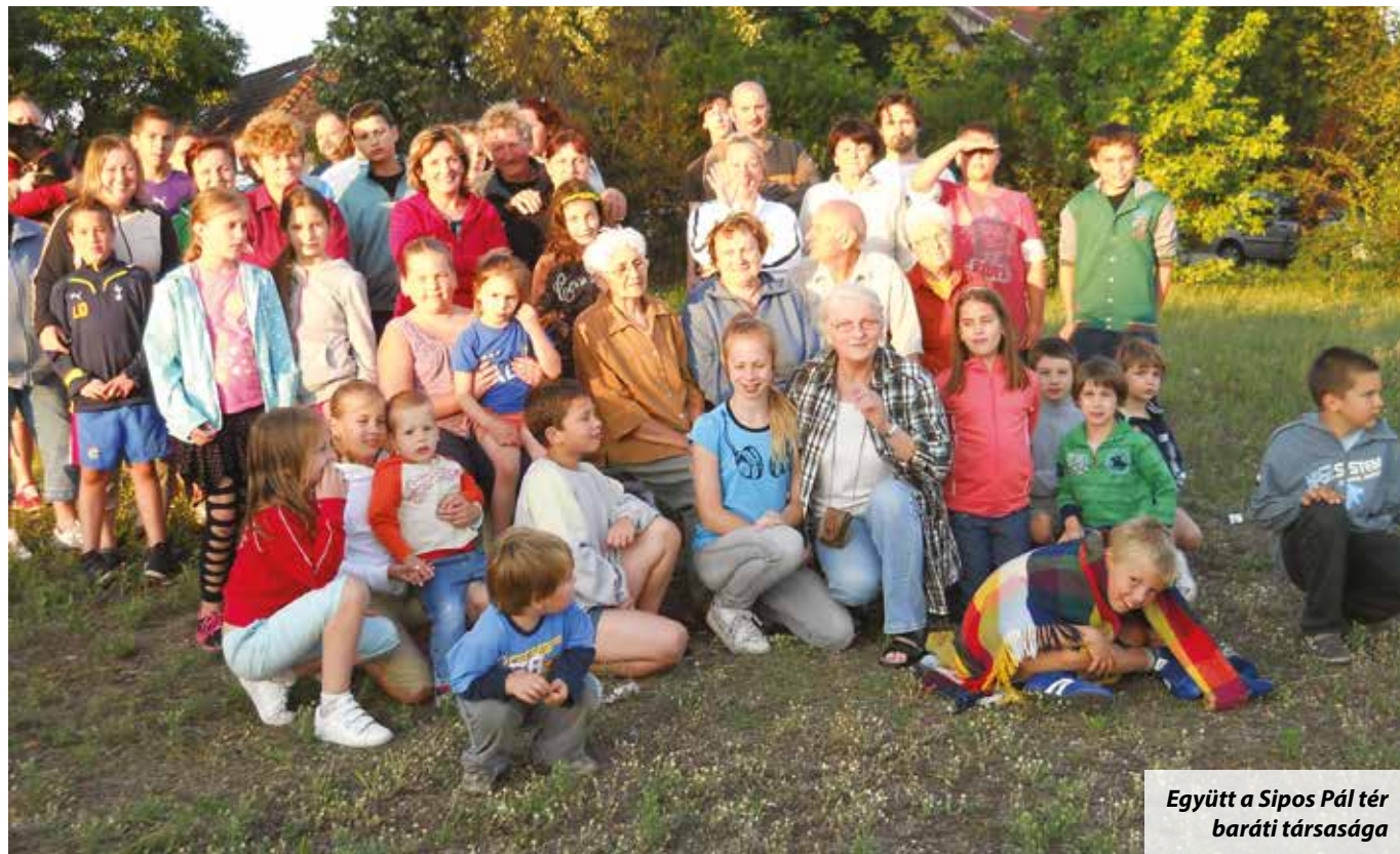
Együtt a Sipos Pál tér baráti társasága

A Sipos Pál tér egy hatalmas terület a városban, és mint ilyen, kitűnő lehetőségeket rejt a szabadidő hasznos eltöltésére, sportolásra, közösségi találkozásokra, beszélgetésekre, levegőzésre, a kisgyermekeseknek babasétáltatásra, gyerekeknek játszótéri elfoglaltságra. Mindezek ellenére ez a tér sokáig „Csipkerózsika álmát” aludta, s hogy a hasonlatot folytassam, kezdett egy kicsit elbozotosodni is, bár ezt a folyamatot az idei szárazság nagymértékben visszavetette. Minden esetre az ott lévő padok, villanyoszlopok, egyebek, igen elhanyagolt állapotban voltak, a fű kiégett, s meglehetősen lehangoló látványt nyújtott a terület egésze.