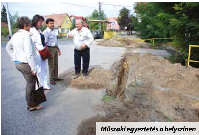
Műszaki egyeztetés a helyszínen

Képviselő-testületi döntés értelmében kijelölt, megterveztetett gyalogátkelőhely segíti majd a biztonságos átjutást a Ferenczy utca iskola felőli oldalára és vissza. Amint az lenni szokott, ami egyszerűnek látszik, arról kiderül, hogy mégsem az. Itt például a föld alatt húzódó villamos közmű vezetékkel kell áthelyezni. A gyalogátkelőhely megvilágítása - az előírásoknak és a tervnek megfelelően - már elkészült.