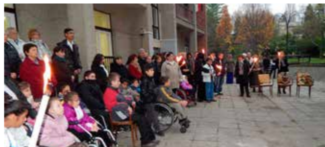
Ünneplők és megemlékezők egy csoportja

A Károlyi István Gyermekközpont, korábbi nevén a Fóti Gyermekváros idén ünnepelte megalapításának 56. évfordulóját. Érdekes, hogy településünk ezen területe - legalább is az elnevezés szerint - négy évtizeddel hamarabb lett város, mint maga Fót. A születésnapra meghívták az egykori gondozottakat és a régen itt alkalmazott nevelőket. Az alkalomra összeállított kiállítást bizony sokan megcsodálták, felidézve egykori emlékeiket. Az ismerősöknek, a régi barátoknak volt lehetőségük beszélgetni, nosztalgizálni.