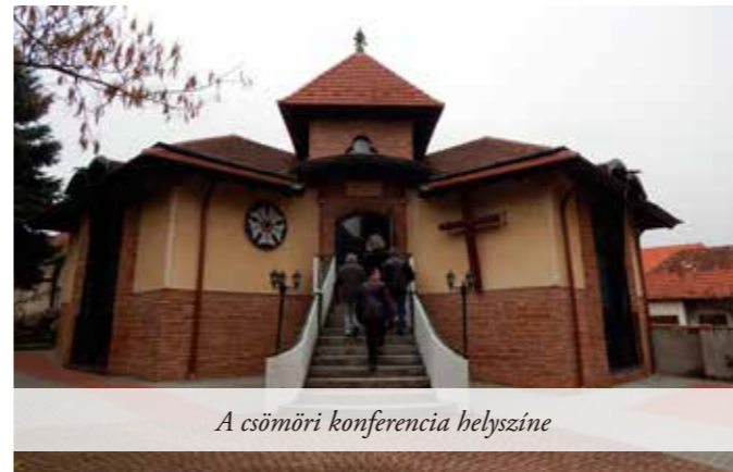
A csömöri konferencia helyszíne