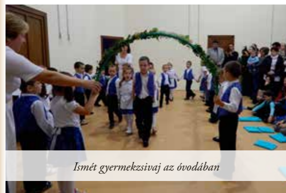
Ismét gyermekzsivaj az óvodában