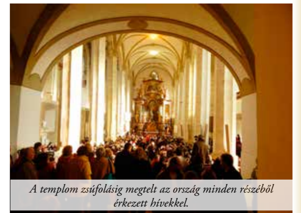
A templom zsúfolásig megtelt az ország minden részéből érkezett hívekkel.

Dr. Rétvári Bence olyan kérdéseket taglalt, amely a ma emberét ma is, komolyan foglalkoztatja. A fiatal politikus korát meghazudtoló bölcsességgel nyújtott választ a hit és a politika összefüggéseiről.