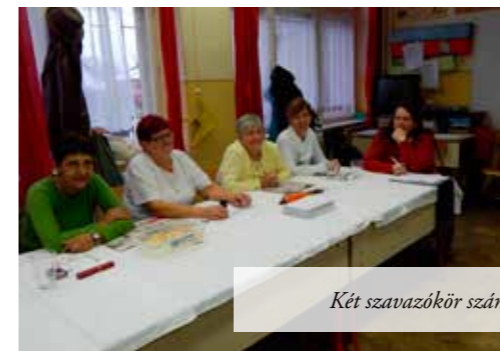
Két szavazókör számlálóbiztosai és ellenőrei