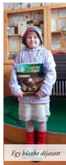
Egy büszke díjazott