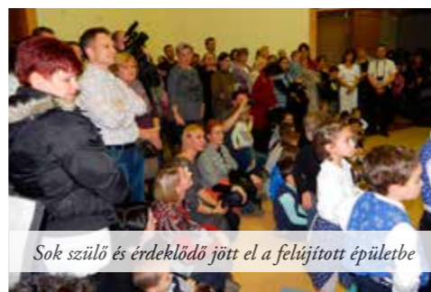
Sok szülő és érdeklődő jött el a felújított épületbe

Az Apponyi Franciska Óvoda Ibolyás utcai épülete két csoportteremmel bővült, melynek „házi” avató ünnepségét november 22-én tartották. Pozderka Gábor alpolgármester köszöntő beszédében elmondta, hogy pályázati támogatással a három generációs háttér, a nagyszülők jelenléte, bölcsessége, a régi családi modell. Ezt a családi közeget, ezt a pluszt a legszebb óvoda sem tudja pótolni. A kibővült, megújult óvodaépület méltó feltételeket biztosít a gyermekek szellemi és fizikai fejlődéséhez. Fót méltán büszke lehet erre az épületre.