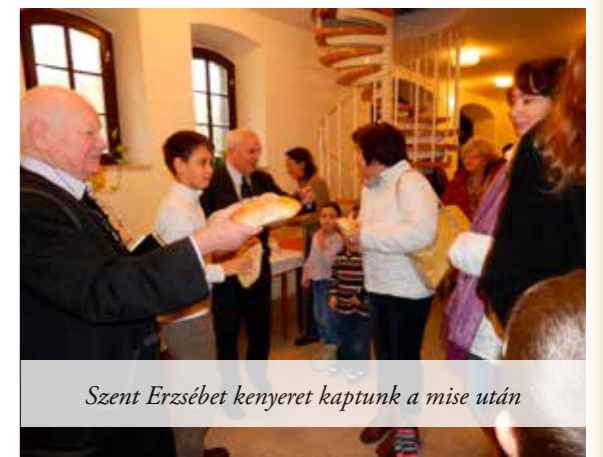
Szent Erzsébet kenyeret kaptunk a mise után