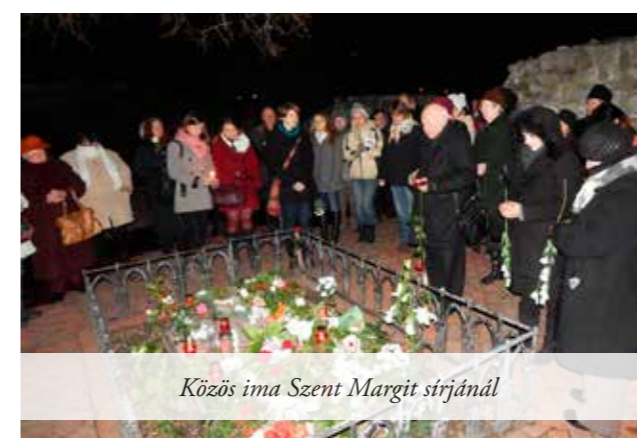
Közös ima Szent Margit sírjánál