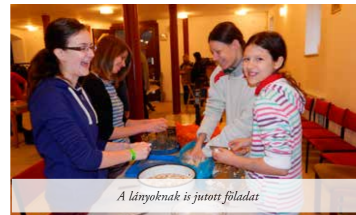
A lányoknak is jutott földolat