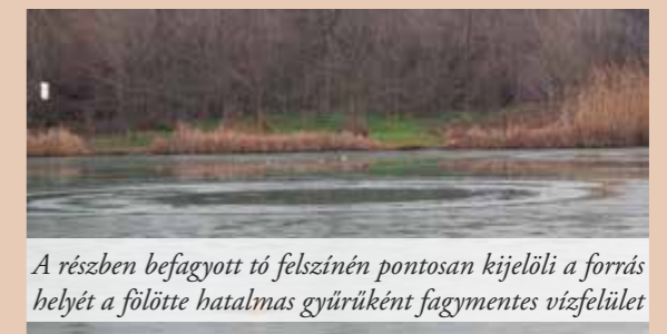
A részben befagyott tó felszínén pontosan kijelöli a forrás helyét a fölötté hatalmas gyűrűként fagymentes vízfelület

A Horgász Egyesület vendég-horgászok jelentkezését is szeretettel várja.