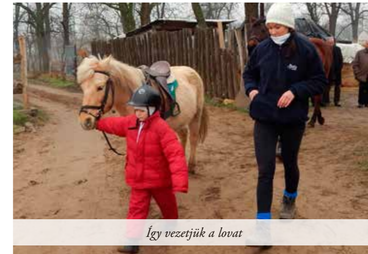
Így vezetjük a lovat