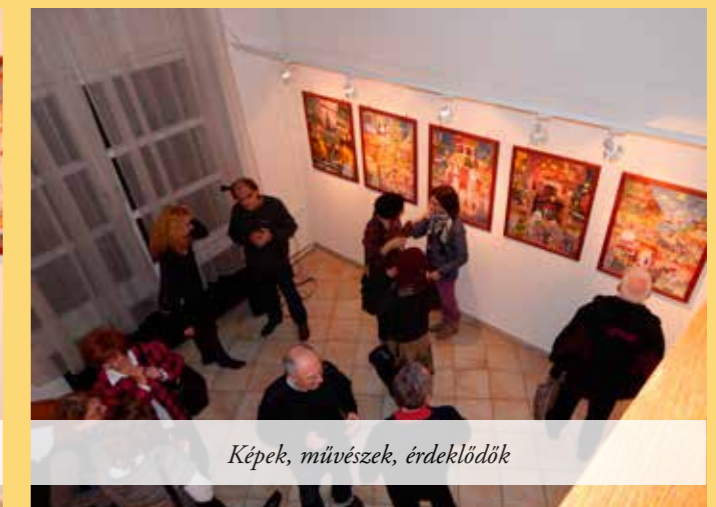
Képek, művészek, érdeklődők