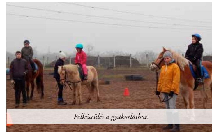
Felkészülés a gyakorlathoz