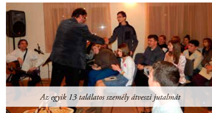
Az egyik 13 találatos személy átveszi jutalmát