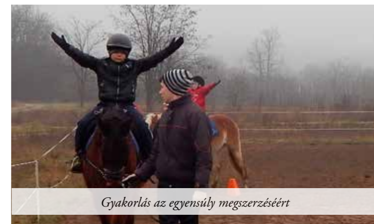
Gyakorlás az egyensúly megszerzéséért