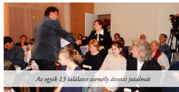
Az egyik 13 találatos személy átveszi jutalmát