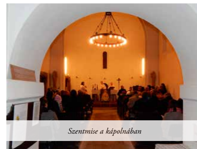
Szentmise a kápolnában