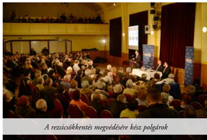
A rezsicsökkentés megvédésére kész polgárok

„A kormány intézkedései erőteljes támadásra sarkallták Brüsszelt, így a 2011-es Békemenetre is szükség volt ahhoz, hogy a kormány elleni támadást ki tudjuk védeni” – mondta a Fidesz frakcióvezetője. Hozzátette: „amikor 2012. végén azt találtuk mondani, hogy