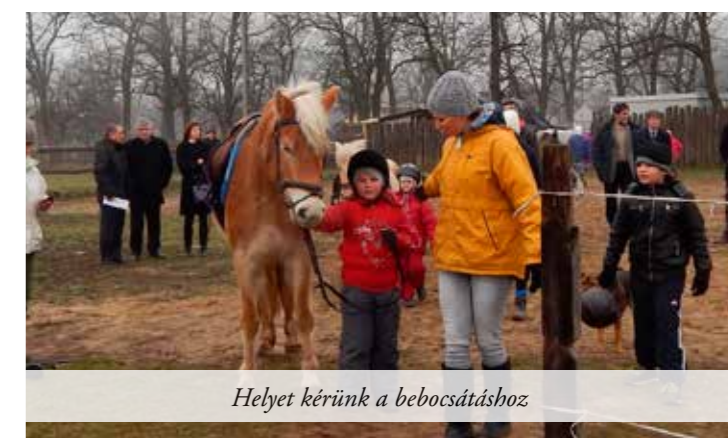
Helyet kérünk a bebocsátáshoz