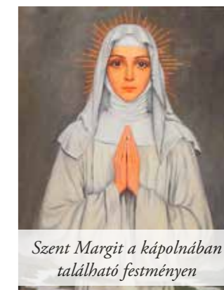
Szent Margit a kápolnában található festményen

Margit ennek szellemében élte le rövid életét, 28 évet. Az önfegyelmezés és a keresztény szeretet példaképe lett. Az imádság erejével és bölcs tanácsaival valóban hozzájárult hazánk felemelkedéséhez, megerősödéséhez. Az időközben róla elnevezett, de akkor még Nyulak szigetén, a domonkos kolostorban élő királylány tiszta, puritán élete, kedves és okos egyénisége már életében méltó tiszteletet váltott ki nemcsak rendtársai, de a kor neves személyiségei között is.