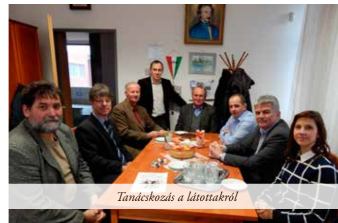
Tanácskozás a látottakról

Amint államtitkár úr elmondta, azon dolgoznak, hogy ősztől az állam anyagilag is támogassa az iskolai lovasoktatást, levéve ezzel a szülőkről és az iskoláktól a terhet. Az intézményfenntartóval kell az oktatást vállaló lovardáknak szerződnie, s a megfelelő oktatót alkalmazni.