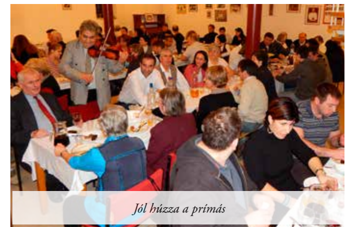
Jól húzza a primás