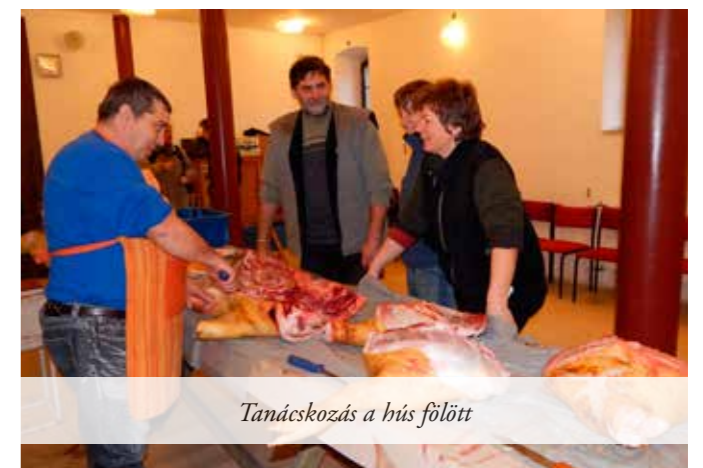
Tanácskozás a hús fölött