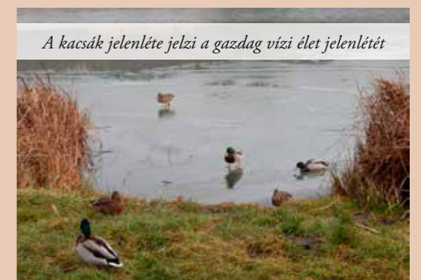
A kacsák jelenléte jelzi a gazdag vízi élet jelenlétét