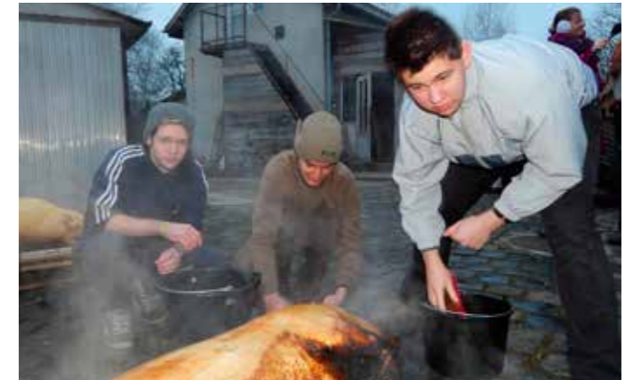
A fiatalok is korán keltek

Persze nem csak evésről és ivásról szólt az este, volt cigánybanda is, amelyik remek muzikával szórakoztatta az egybegyűlteket, akik az üresen maradt piciny helyen tánca is perdültek. Akinek elfáradt a lába, az sem szomorkodott, mert a hangszálak még igen jól bírták, s régen látott, élvezetes nótázásba csapott át a társaság. Éjfél tájban a zenészek hazaindultak, de a jó torkú, nótázni vágyó férfiak hangja még utána is sokáig hallatszott a Márton patak partján.