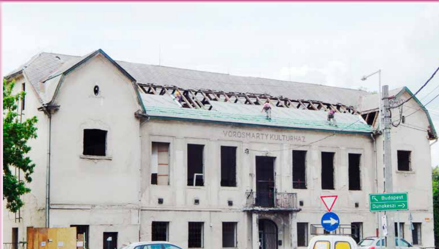
Másodszorra kezdtek neki a Vörösmarty Mibály Művelődési Ház felújításához. Az önkormányzat 186 millió Ft-ot szánt a kivitelezésre. Ősszel már a rendbe tett, korszerűsített, szép épületben ünnepelhetjük őszi forradalmunk emléknapiját!.