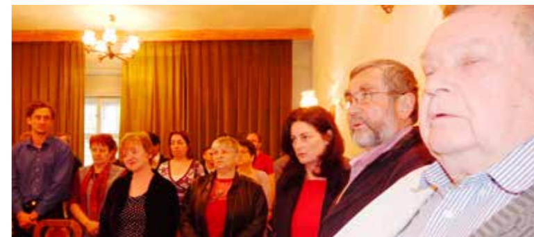
Esküt tesznek az új külső bizottsági tagok

A továbbiakban az ülés szokott rendben a korábbiakhoz képest lendületesebben zajlott.