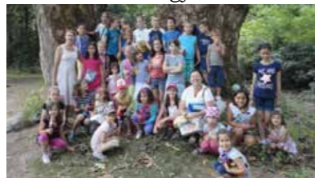
A tavalyi II. tábor „csapata”

időpontok: 2014. június 30- július 4-ig és július 7- 11-ig naponta: 8.00- 16.00 óráig helyszín: Katolikus Közösségi Ház (fóti római katolikus templom mögött)