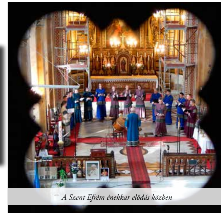
A Szent Efrém énekkar előadás közben