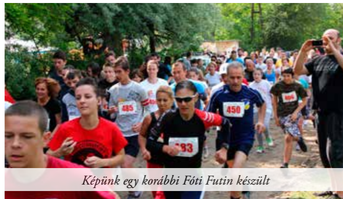
Képünk egy korábbi Fóti Futin készült

Idei újdonságunk a szokásos távokon (2 km, 5 km, 12 km) kívül a Somlyó-félmartonon (21 km), mely a szintkülönbségeknek köszönhetően igazi erőpróba még a tapasztalt terepfutóknak is.