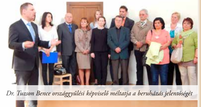
Dr. Tuzson Bence országgyűlési képviselő méltatja a beruházás jelentőségét