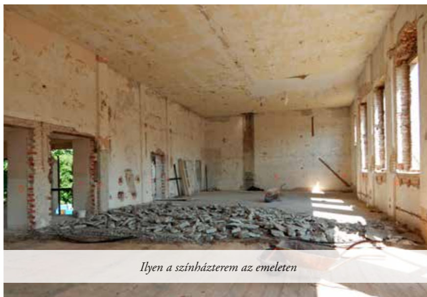
Ilyen a színházterem az emeleten

Megköveteljük az alvállalkozóktól is - szerződéses feltevésként - ezt a kötelező munkavédelmi felszerelést. Ennek hiánya személyre szabott bírságot jelentene.