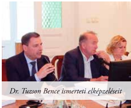
Dr. Tuzson Bence ismerteti elképzeléseit

Az ülésen megjelent Dr. Tuzson Bence országgyűlési képviselő, aki a napirendre tűzött pontok tárgyalása előtt bemutatkozott és felvázolta elképzeléseit az önkormányzattal kapcsolatos elképzeléseiről, Fót fejlesztése érdekében.