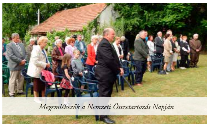
Megemlékezők a Nemzeti Összetartozás Napján