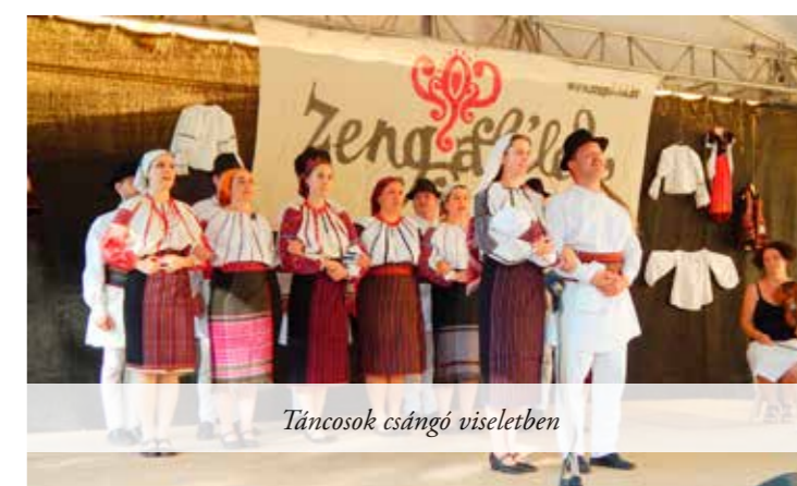
Táncosok csángó viseletben