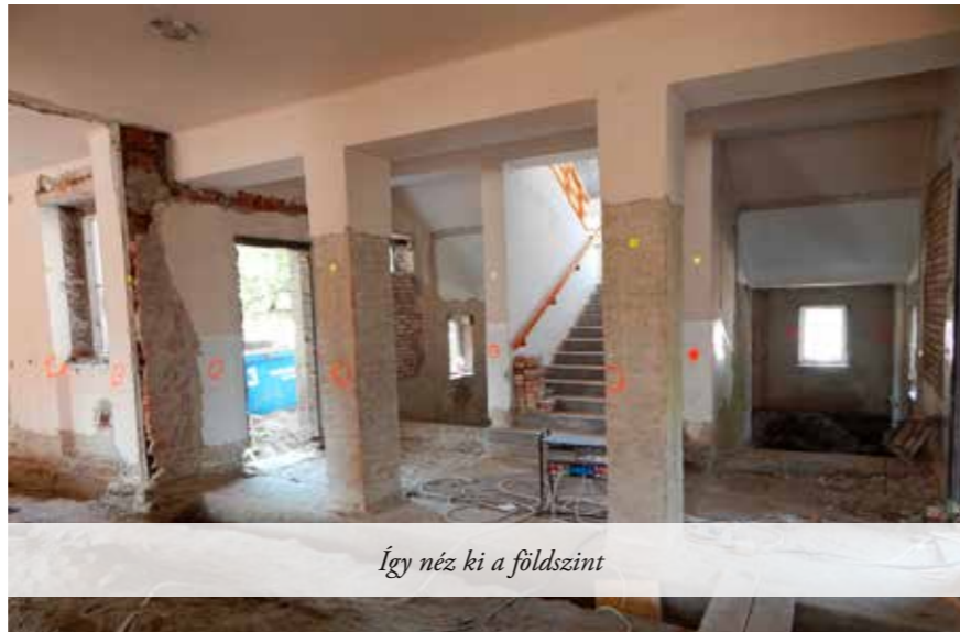
Így néz ki a földszint