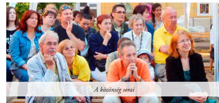
A közönség sorai