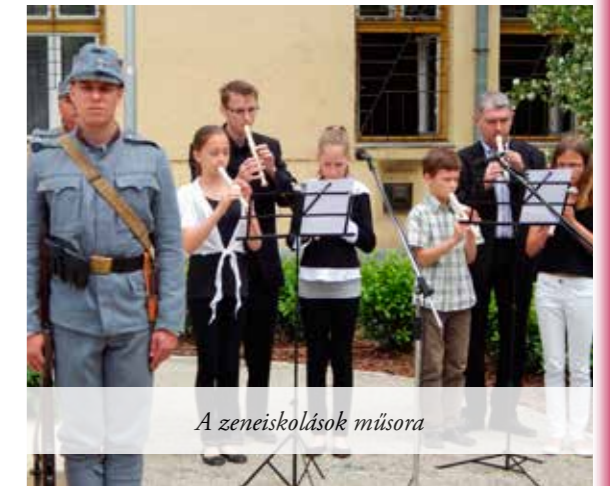
A zeneiskolások műsora