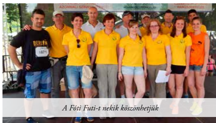
A Fóti Futócsapatot nekik köszönhetjük