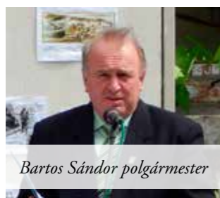
Bartos Sándor polgármester