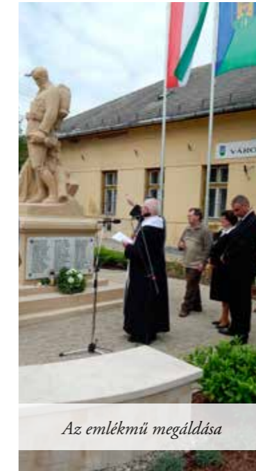
Az emlékmű megáldása