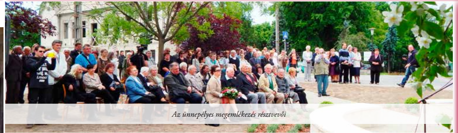
Az ünnepélyes megemlékezés résztvevői