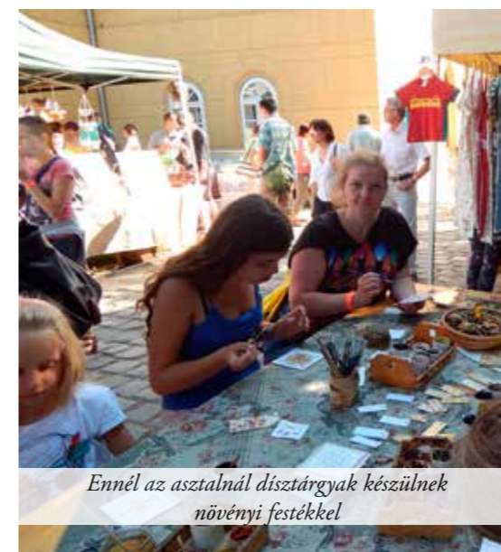
Ennél az asztalnál dísz tárgyak készülnek növényi festékekkel