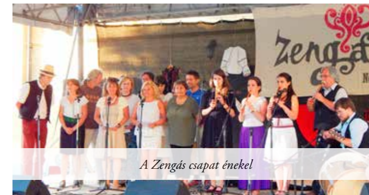
A Zengás csapat énekel