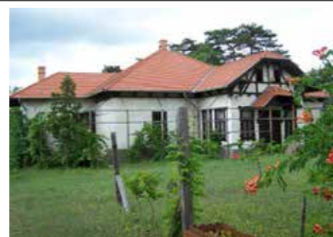
AZ EMLÉKHÁZ NYÁRI NYITVATARTÁSI IDEJE:

FKKK Vörösmarty Művelődési Ház 2151 Fót Vörösmarty tér 3. 06 70 331 58 06 fotimvhaz@gmail.com, www.vmh.hu