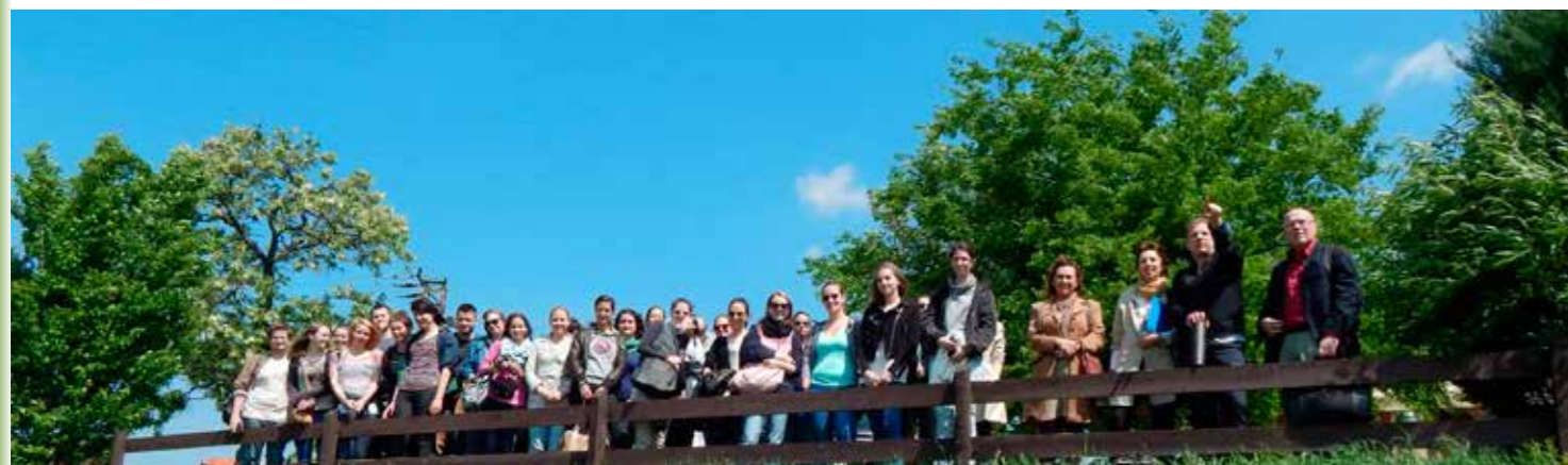
Építészhallgatók tanulmányi kiránduláson, Fóton. A város látképevel ismerkednek a Fáy Présház előtt.