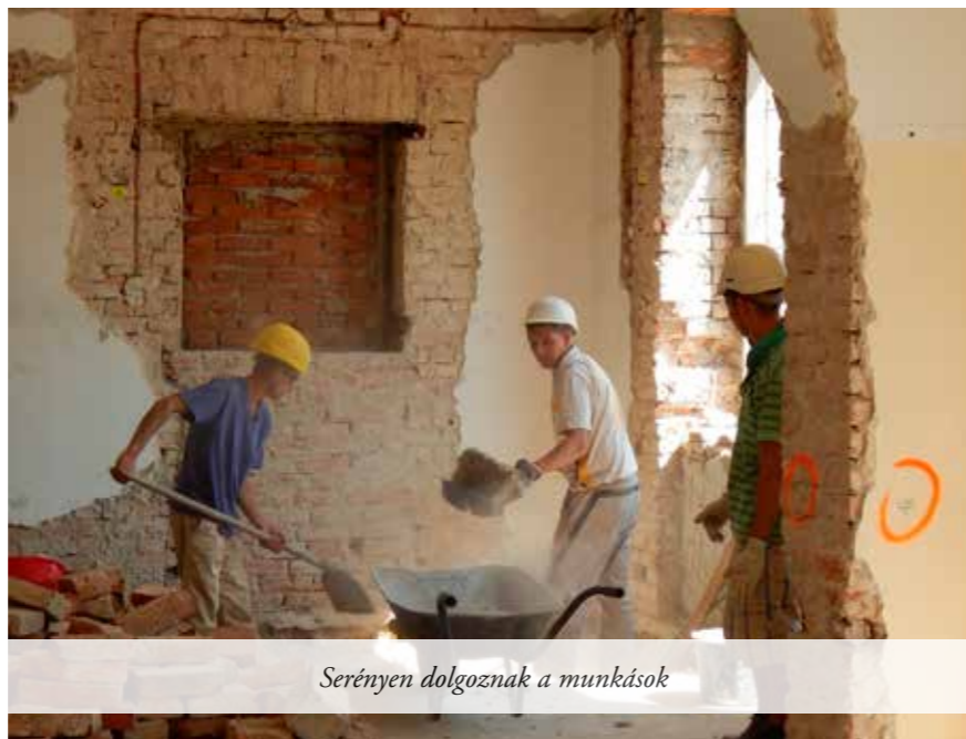
Serényen dolgoznak a munkások