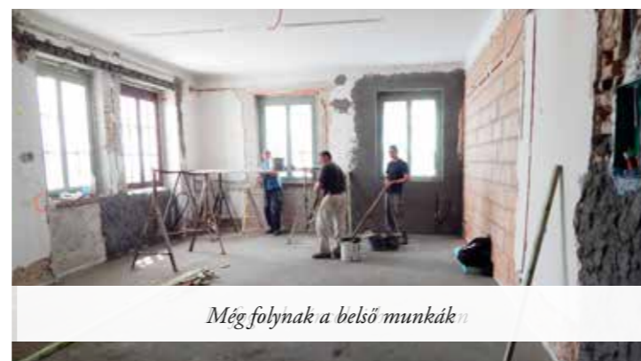
Még folynak a belső munkák