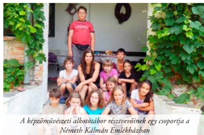
A képzőművészeti alkotótábor résztvevőinek egy csoportja a Németh Kálmán Emlékházban