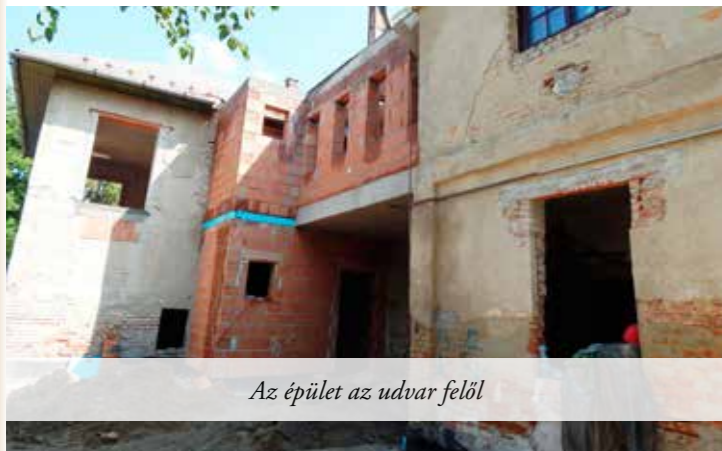
Az épület az udvar felől

Lapzártánk időpontjában kezdtek hozzá a Baross Gábor utca aszfaltozásához, pontosabban, első lépésként az úttükör készítéséhez, így ismét eltűnik egy földes út Fótról, hogy átadja a helyét egy minden igényt kielégítő, 4,5 méter széles aszfaltos útnak, amely nem csak csapadékvíz elvezetéssel rendelkezik majd - nagy megkönnyebbülésre több mélyebben fekvő ingatlan tulajdonosának -, de még szép járda is készül hozzá. A Baross utcával közel egyidőben kezdődik a Géza fejedelem útja új aszfaltszőnyege is, melyet ugyan az a vállalkozó készít. Ezt a két utcát, minden kellékével 90 nap alatt kell készre jelentenie a kivitelezőnek. Látványos változás történik az Óvodakertben is, hol Károlyi István gróf, Fót híres építője életnagyságú szobrának leendő helyét alapozzák.