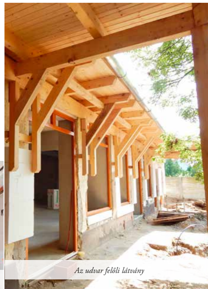
Az udvar felőli látvány