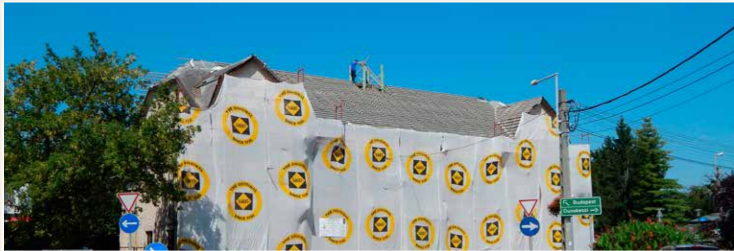
A Művelődési Ház takaró alatt