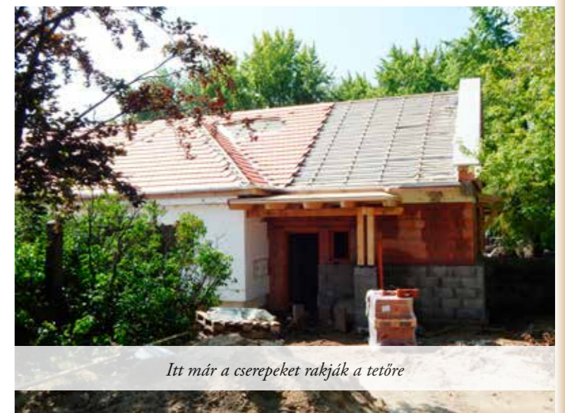
Itt már a cserepeket rakják a tetőre