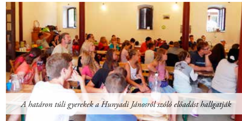
A határon túli gyerekek a Hunyadi Jánosról szóló előadást hallgatják

A mogoródi sátoortáborban természetesen ezek a gyermekek és kísérőik ingyenesen vettek részt, semmiféle költséggel nem terhelték őket, hála a célkitűzésekkel egyetértő segítőknek, támogatóknak, akiknek túlnyomó többsége egyszerű magánember. Az előadásokon kívül vitték a szervezők a gyermekeket Budapestre, az Országházba, s több kirándulást is tettek, többek közt Fótra is átsétáltak a Fóti Nagycsaládok Egyesülete meghívására, s itt a fóti látóvalok mellett a Katolikus Közösségi Házban vendégül látták őket ebédre és egy érdekes történelmi előadás is elhangzott itt Hunyadi Jánosról és a Nándorfehérvári Diadalról.