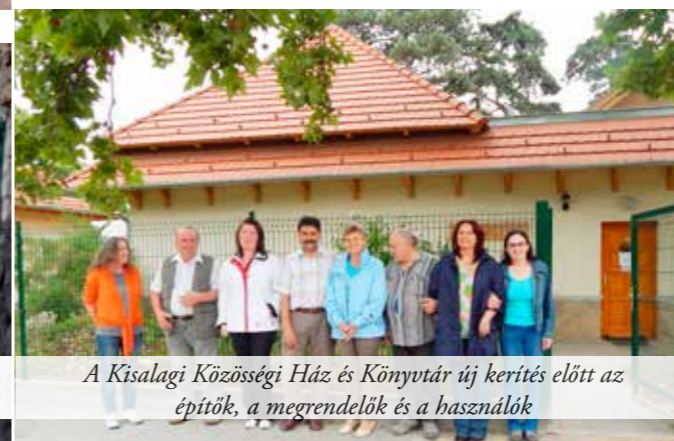
A Kisalagi Községi Ház és Könyvtár új kerítés előtt az építők, a megrendelők és a használók