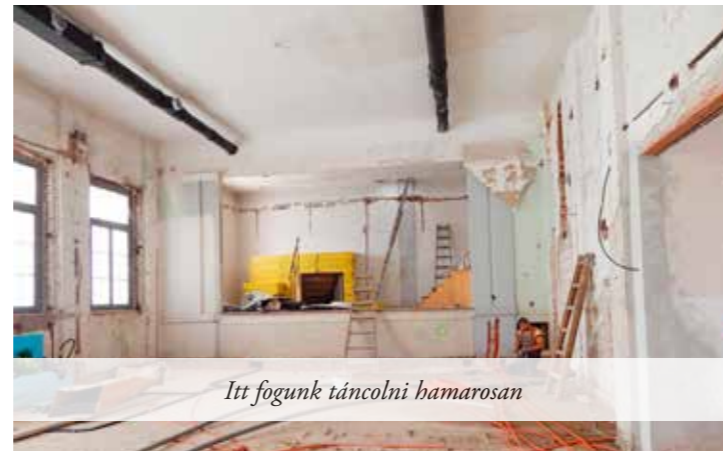
Itt fogunk táncolni hamarosan