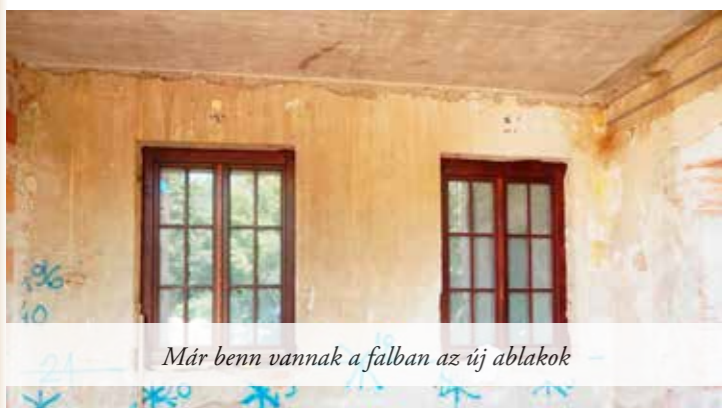
Már benn vannak a falban az új ablakok