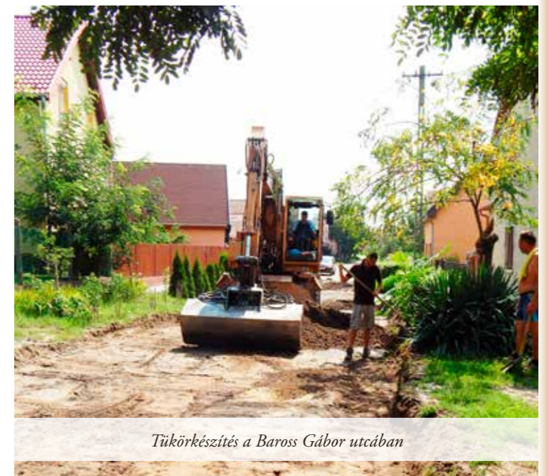
Tükörkészítés a Baross Gábor utcában