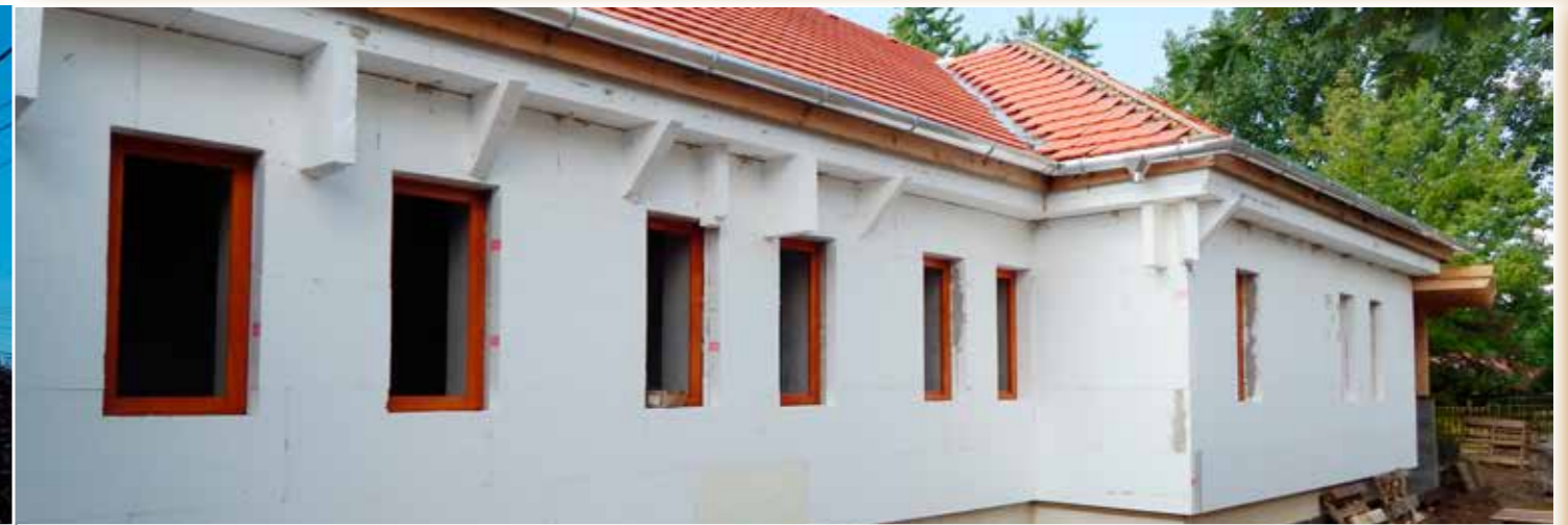
A bölcsőde ezen szárnya már mutatós