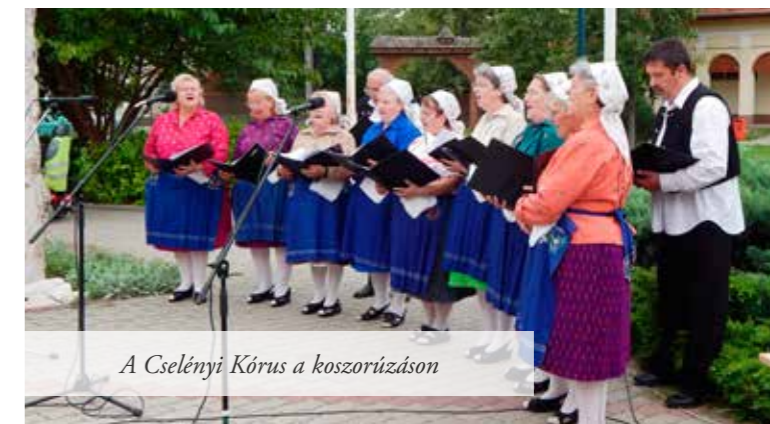
A Cselényi Kórus a koszorúzáson