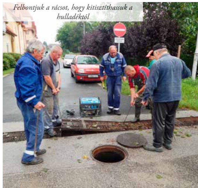
Felbontjuk a rácsot, hogy kitisztíthassuk a hulladéktól