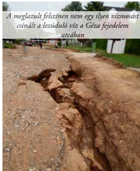
A meglazult felszínen nem egy ilyen vízmosást csinált a lezúduló víz a Géza fejedelem utcában