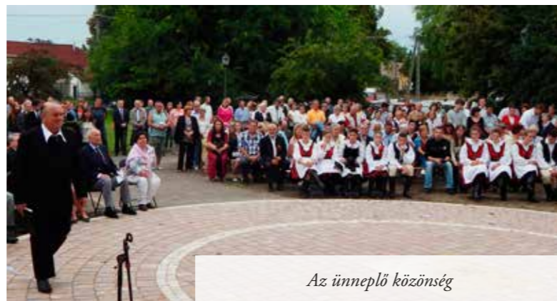
Az ünneplő közönség

Besötétedés után a tömeg ezen a remek nyári estén zenés tűzijátékban gyönyörködhetett, amelyet még Mogyoródról is láttak, majd éjjel 11 óráig mulathattak a kirtartók a The Shades zenéjére. Képeinket lásd még a 19. oldalon is!