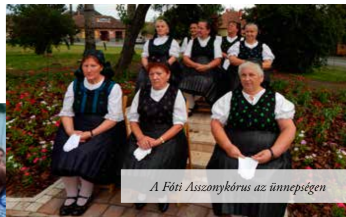
A Fóti Asszonykórus az ünnepségen