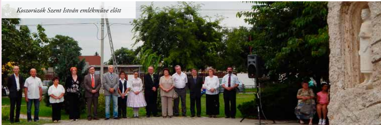
Koszorúzók Szent István emlékműve előtt

Lassan főtér lesz a Vörösmarty térből, mely Szent István Napjára valóban városközponttá is vált. Három egymás melletti helyszínen zajlott augusztus 20-án az ünnepség: a piac téren, az Óvodakertben és a katolikus templomban, szerves egységben. Minden véleményt alkotó kifejtette, hogy ilyen gazdag és színvonalas ünnepség régen nem volt Fóton.