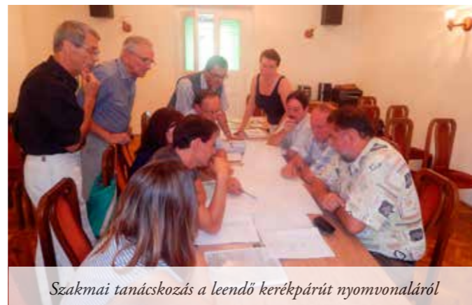
Szakmai tanácskozás a leendő kerékpárút nyomvonaláról

A városközpontban különösen szűk helyek adódnak, ezért itt több lehetséges útvonalat is elemeztek a jelenlévők, s célként fogalmazódott meg az is, hogy ne csak a városon a lehető legrövidebb úton átvezető kerékpárút készüljön, hanem az útvonal adjon lehetőséget a város nevezetesebb részeinek, üzleteinek kerékpárral történő felkeresésére is, sőt ezek miatt kerékpár tároló helyek is szükségesek, ahol letehetik a járműüket a várossal ismerkedni kívánók.