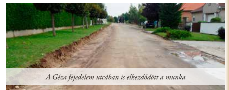
A Géza fejedelem utcában is elkezdődött a munka