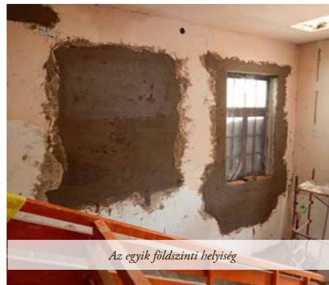
Az egyik földszinti helyiség