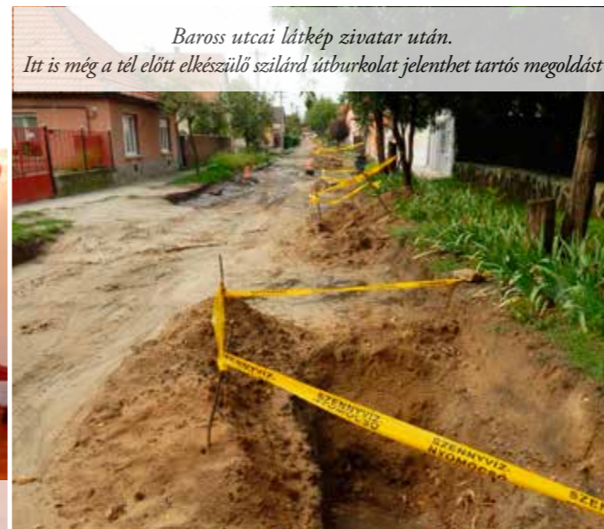
Baross utcai látkép zivatar után. Itt is még a tél előtt elkészülő szilárd útburkolat jelenthet tartós megoldást