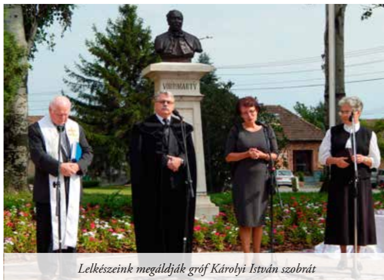
Lelkészeink megáldják gróf Károlyi István szobrát