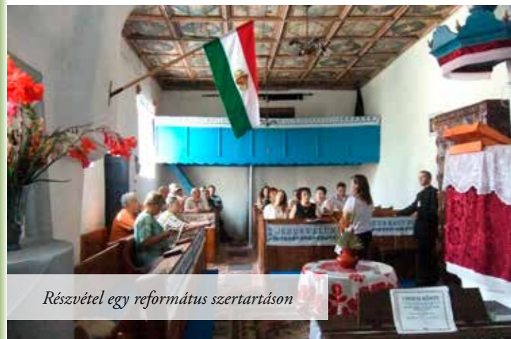
Részvétel egy református szertartáson