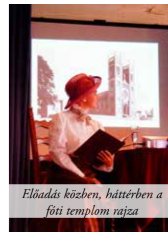
Előadás közben, háttérben a fóti templom rajza