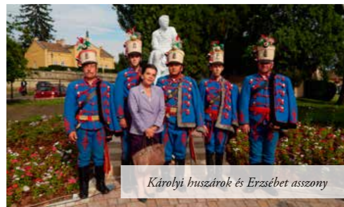
Károlyi huszárok és Erzsébet asszony