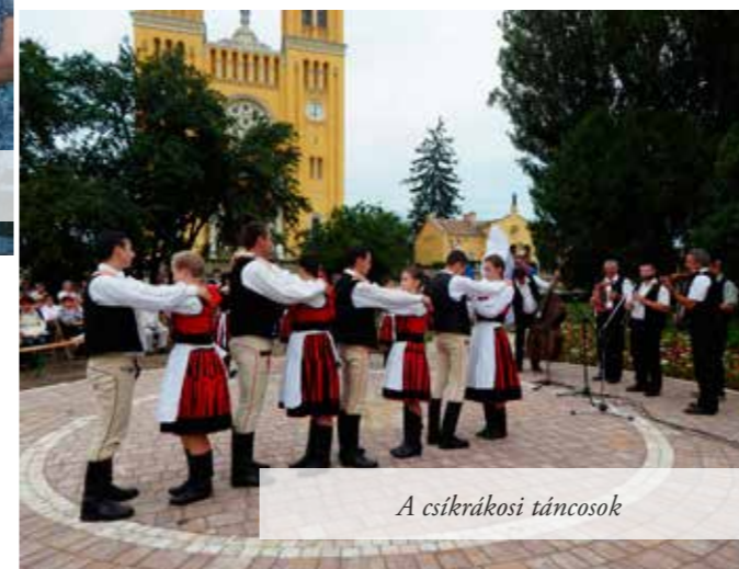
A csikrákosi táncosok