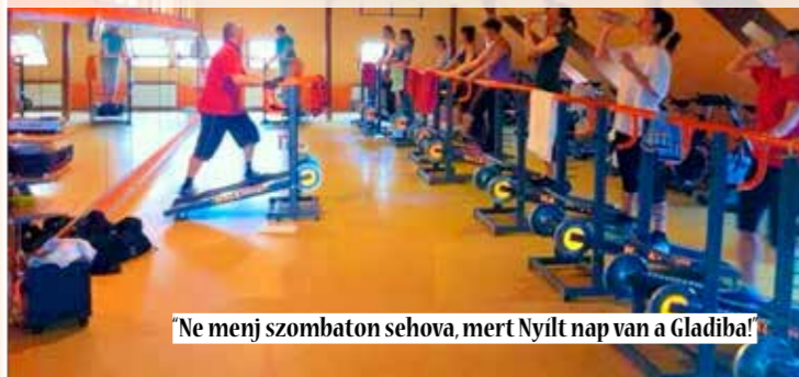
Ne menj szombaton sehova, mert Nyílt nap van a Gladiba!

Részletes órarendet a weboldalon megtalálod szeptember 8-tól!