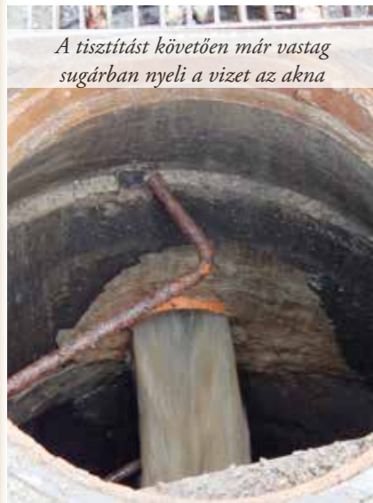
A tisztítást követően már vastag sugárban nyeli a vizet az akna

Az is hozzájárul a bajokhoz, hogy a lakosok sokszor lebetonozzák, lekövezik az udvaruk nagy részét. Így az esővíz nem tud beszívni a talajba, kifut az utcára, s a sok utcára kiengedett víz elviszi a földes utca felszínét. Pedig országos szakhatósági szabály, hogy nem szabad az utcára kiengedni a vizet, azt telken belül kell elszikkasztani. Többek közt ennek érdekében vannak a beépítési szabályok, hogy a telek hány százaléka építhető be, s ezen túl hány százalékot kell zöldfelületként minden udvaron meghagyni. Ez nem csak esztétikai követelmény, hanem ennek jelentős szerepe lenne a vízelvezetésben.