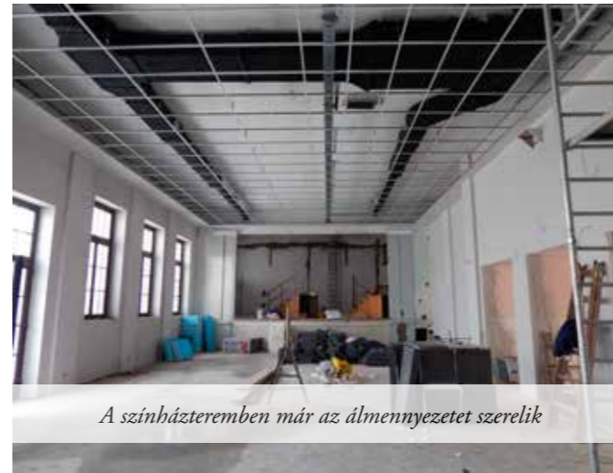
A színházteremben már az álmennyezetet szerelik

A Vörösmarty Mihály Művelődési Ház felújítása rendben folyik, bár ebben a hónapban olyan látványos változásokat nem tudunk mutatni, mint korábban, amikor falak emelkedtek. Most már a közmű vezetékek, nyílászárók, vakolások jelentik a munkák nagyobb részét, de van még bőven földadat a hátralevő időre is.