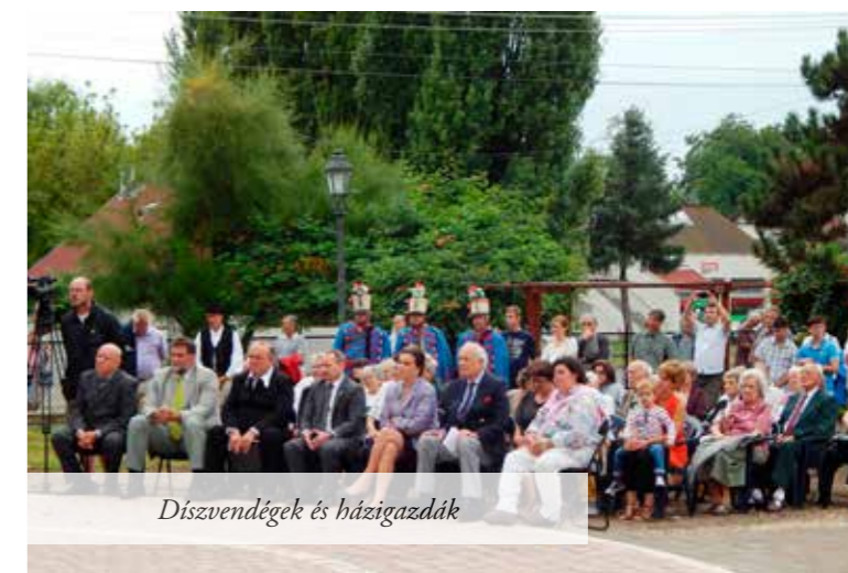
Diszvendégek és házigazdák