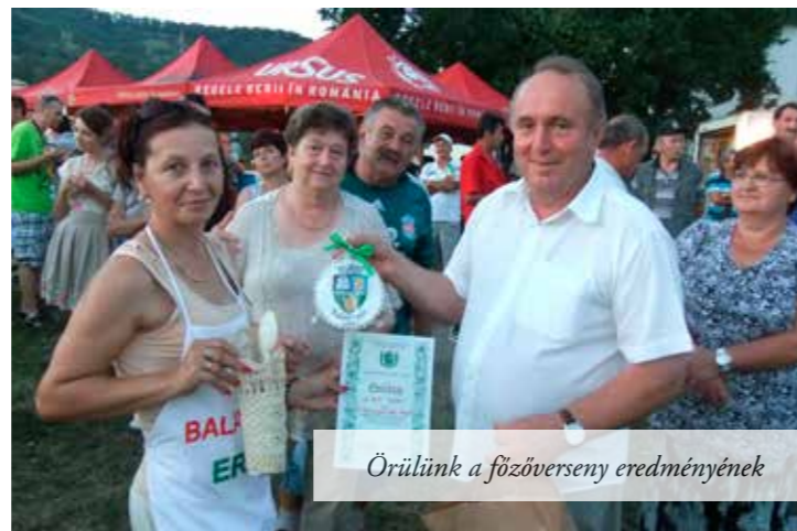
Örülünk a főzőverseny eredményének