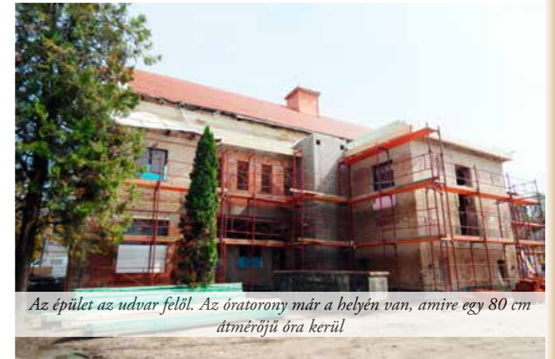
Az épület az udvar felől. Az óratorony már a helyén van, amire egy 80 cm átmérőjű óra kerül