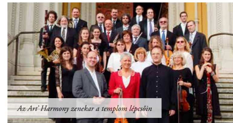
Az Art' Harmony zenekar a templom lépcsőin