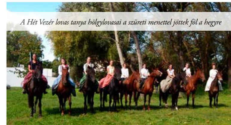
A Hét Vezér lovas tanya hölgylovasai a szüreti menettel jöttek föl a hegyre