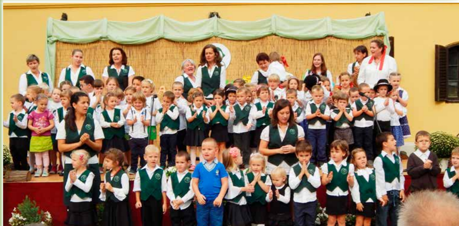
20 éves a Katolikus Egyházközség Gondviselés Óvodája