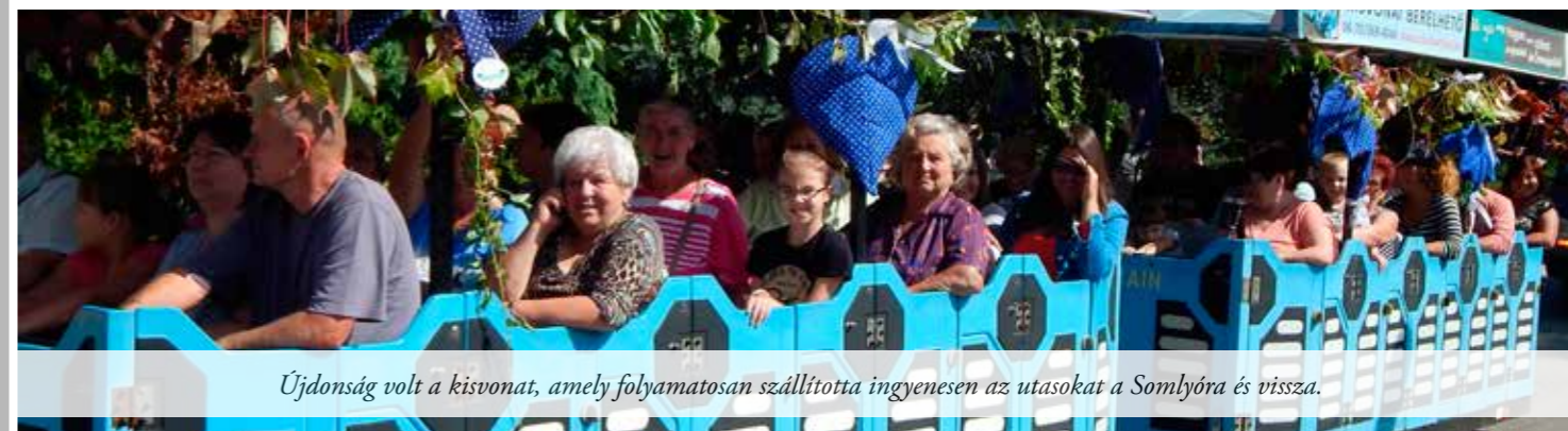
Újdonság volt a kisvonat, amely folyamatosan szállította ingyenesen az utasokat a Somlyóra és vissza.