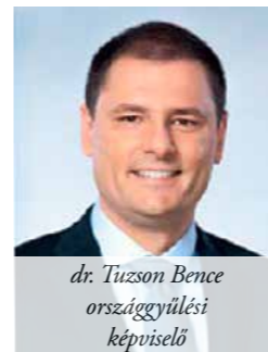
Dr. Tuzson Bence országgyűlési képviselő