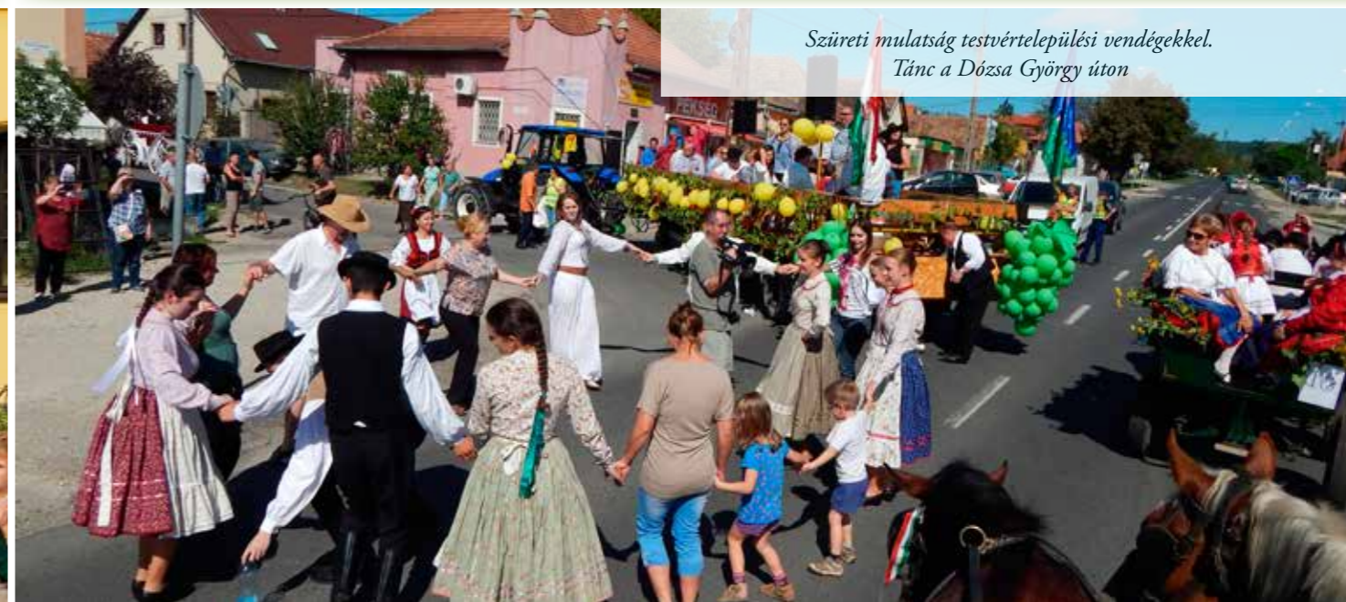
Szüreti mulatság testvértelepülési vendégekkel. Tánc a Dózsa György úton