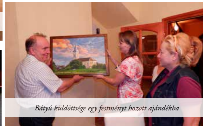
Bátyú küldöttsége egy festményt hozott ajándékba