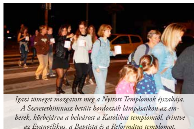
Igazi tömeget mozgatót meg a Nyitott Templomok éjszakája. A Szeretethimnusz betűit hordozták lámpásaikon az emberek, körbejárva a belvárost a Katolikus templomtól, érintve az Evangélikus, a Baptista és a Református templomot.