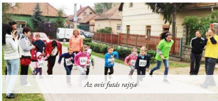
Az ovis futás rajtja