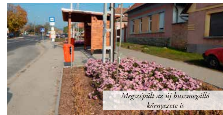
Megszépült az új buszmegálló környezete is

Több mint 30 éve kizárólag templomórák, homlokzati órák és harangjátékok készítésével, szerelésével foglalkozom. Én csináltam a nagy harangjátékot Sevilla-ban, a Makovecz-házban, összesen több mint 500 toronyórát csináltam szép hazánkban és Európában, sokfelé.