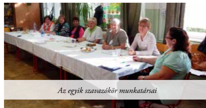
Az egyik szavazókör munkatársai