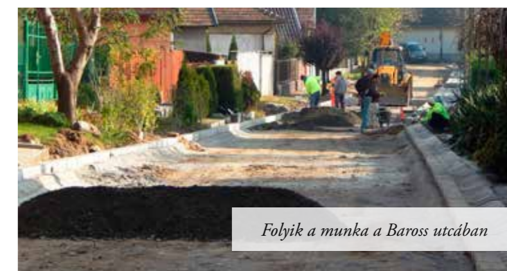
Folyik a munka a Baross utcában