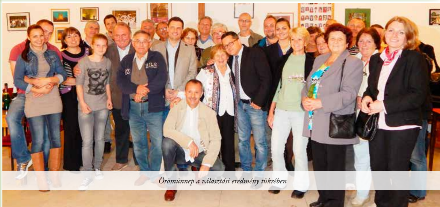
Örömműnnp a választási eredmény tükreben