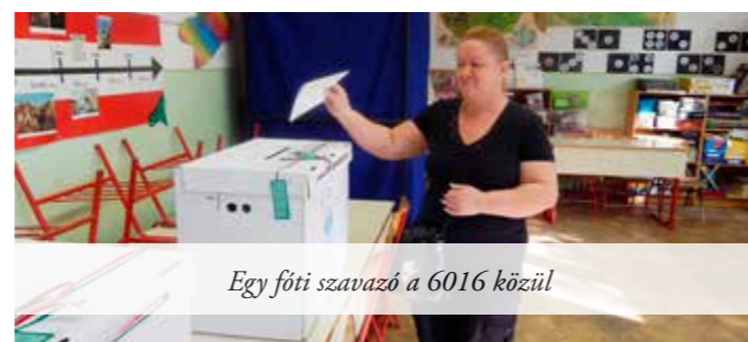
Egy fóti szavazó a 6016 közül