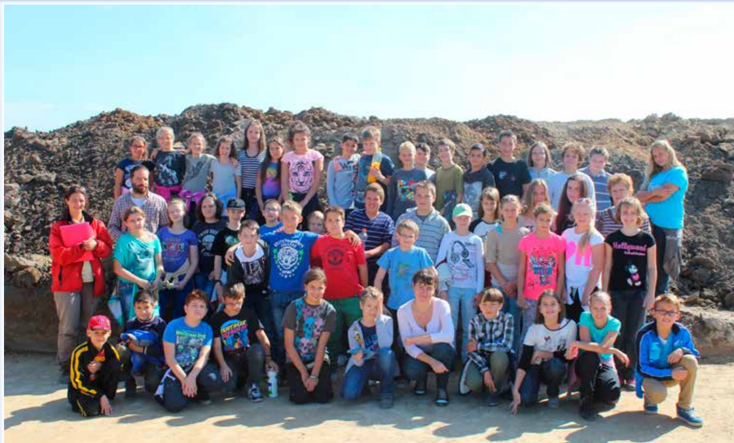
Az ötödik osztályosok most ismerkednek egy új tantárggyal: a történelemmel.