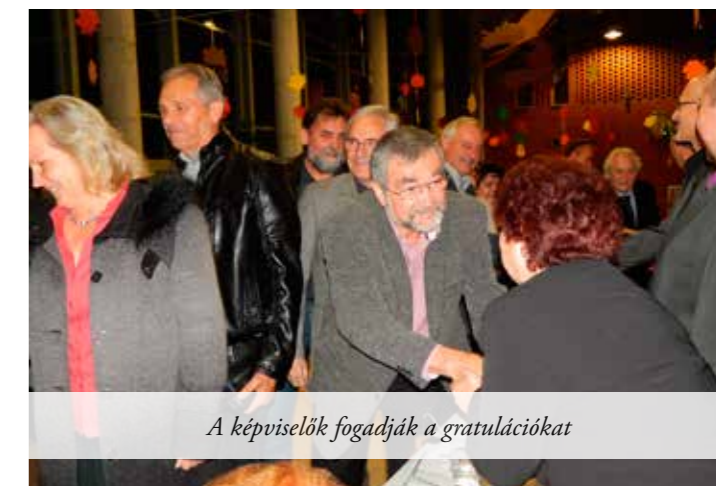
A képviselők fogadják a gratulációkat