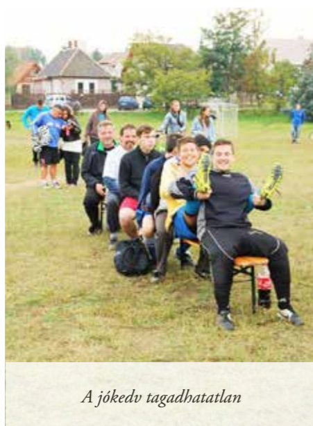
A jókedv tagadhatatlan