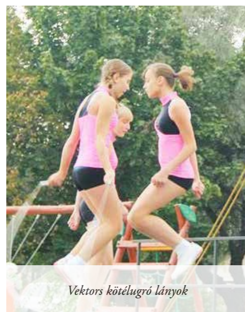
Vektors kötélugró lányok