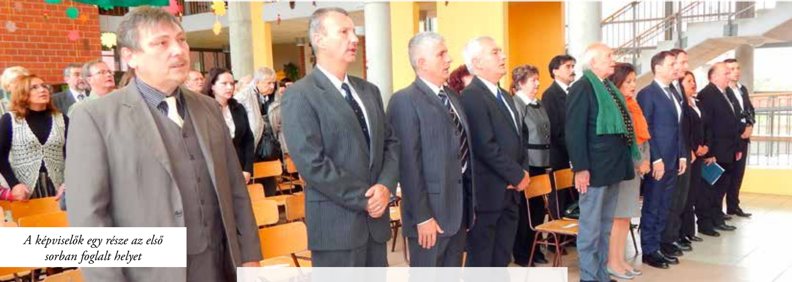
A képviselők egy része az első sorban foglalt helyet