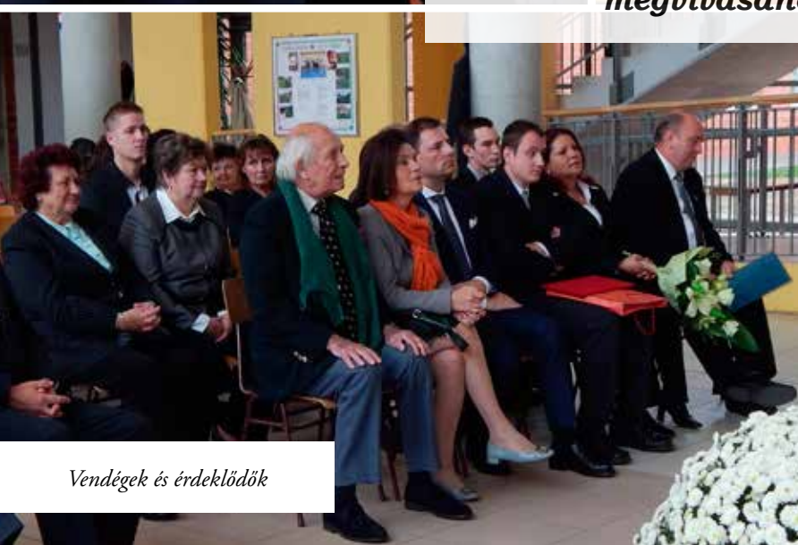
Vendégek és érdeklődők