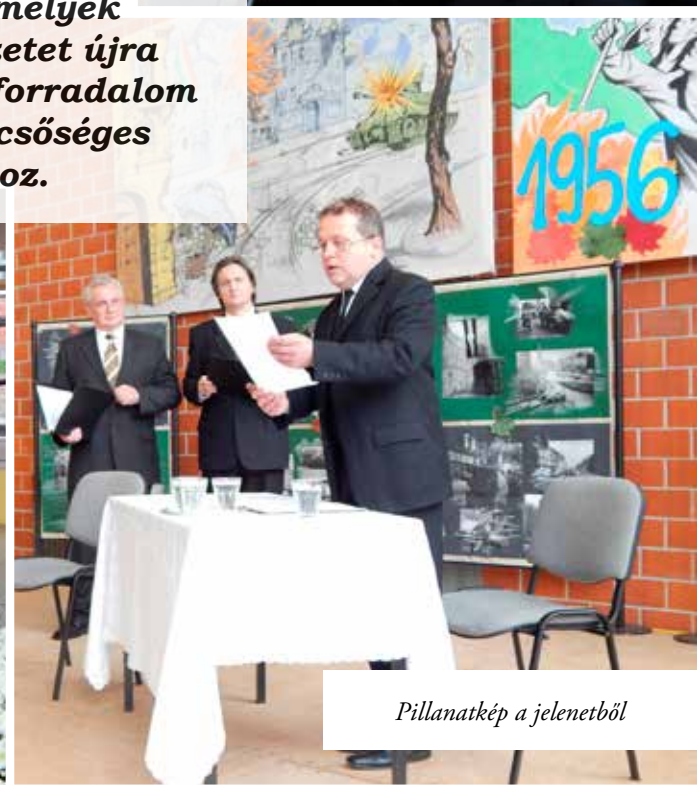
Pillanatkép a jelenetből