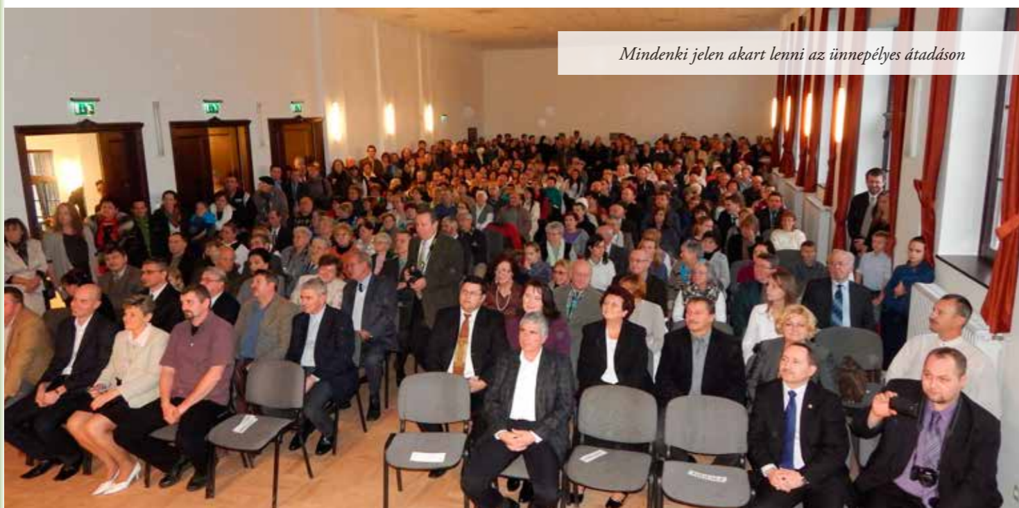
Mindenki jelen akart lenni az ünnepélyes átadáson