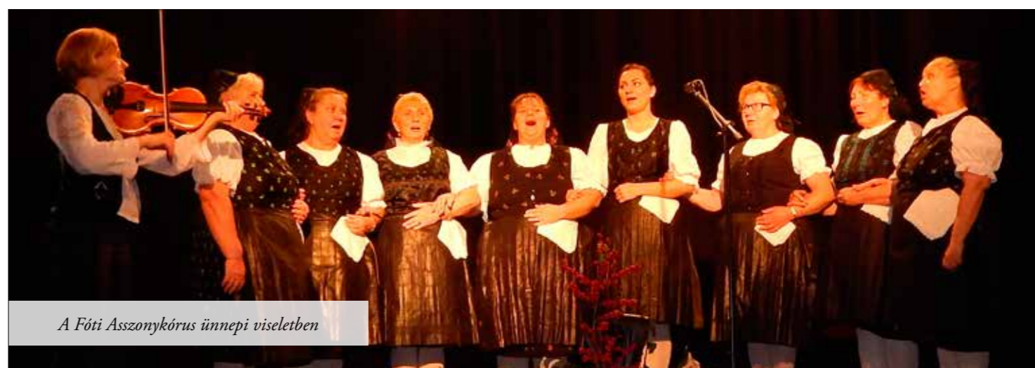
A Fóti Asszonykórus ünnepi viseletben