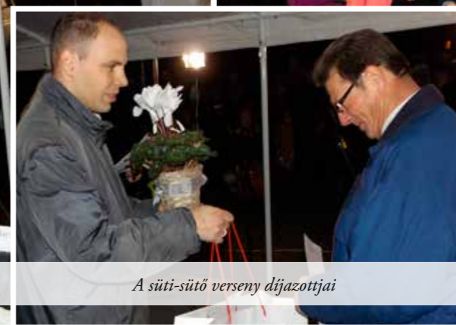
A süti-sütő verseny díjazottjai