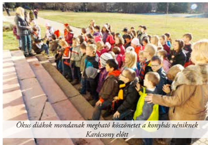
Ökus diákok mondanak megható köszönetet a konyhás néniknek Karácsony előtt