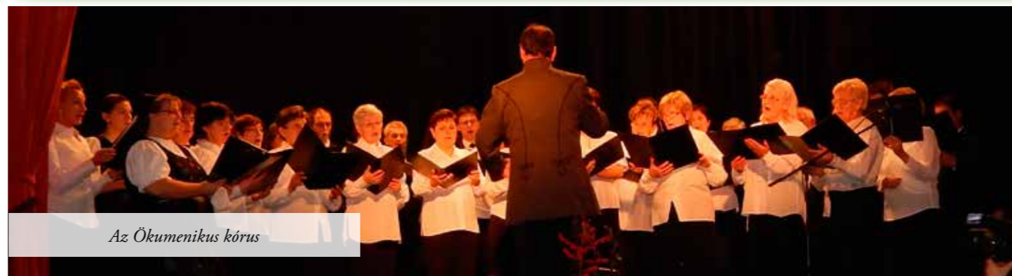
Az Ökumenikus kórus