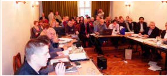
Munkában a képviselő-testület

Erre a napra mindössze egyetlen napirendi pont került „A közbiztonság növelését szolgáló önkormányzati fejlesztések támogatása” c. ügy. A képviselők 10 igen szavazattal döntöttek térfigyelő kamerarendszerek kiépítéséről. Felhatalmazták a polgármestert, hogy az pályázat előkészítő szakaszában, a rendőrség parancsnokkal egyeztetett 10 helyszínre vonatkozó elektromos hálózat biztosításához szükséges tervezői és kivitelezői szerződéseket írja alá, melyhez bruttó 1,0 millió Ft-ot fedezetet biztosítanak. A 10 helyszínre történő kamerarendszer kiépítéséhez további bruttó 4,446 millió Ft fedezetről gondoskodnak.