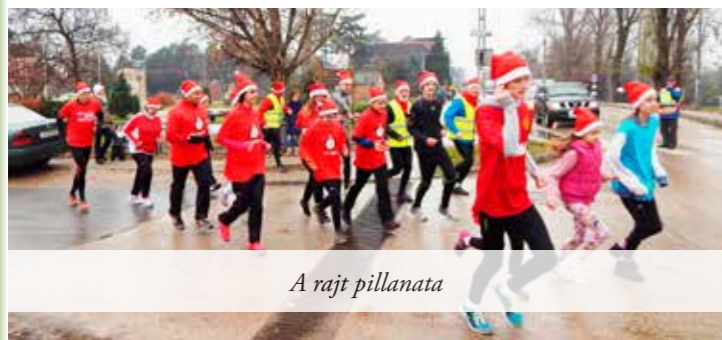
A rajt pillanata