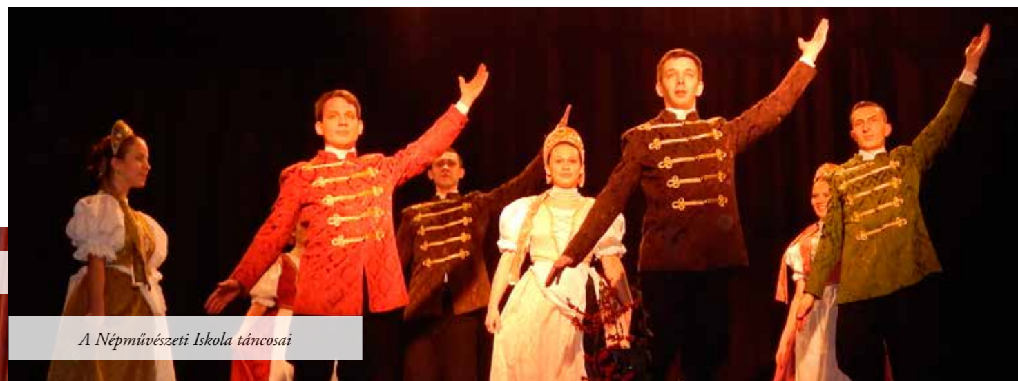
A Népművészeti Iskola táncosai