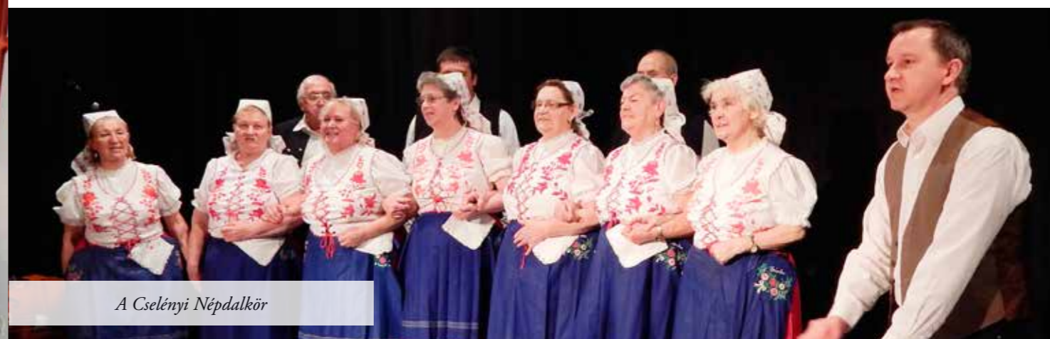
A Cselényi Népdalkör