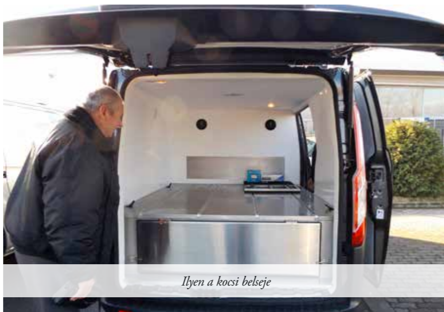
Ilyen a kocsik belseje