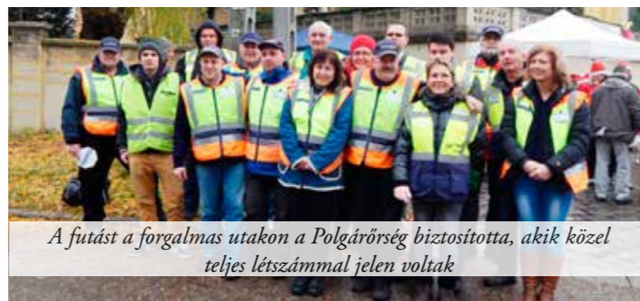
A futást a forgalmas utakon a Polgárőrség biztosította, akik közel teljes létszámmal jelen voltak