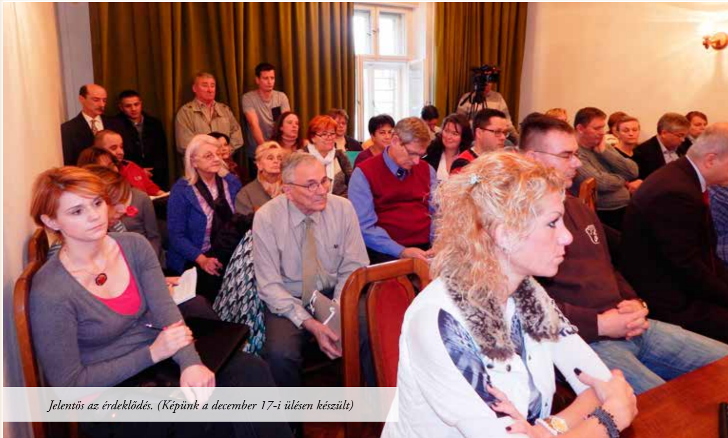
Jelentős az érdeklődés. (Képünk a december 17-i ülésen készült)