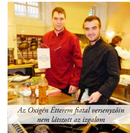
Az Oxigén Étterem fiatal versenyzőin nem látszott az izgalom