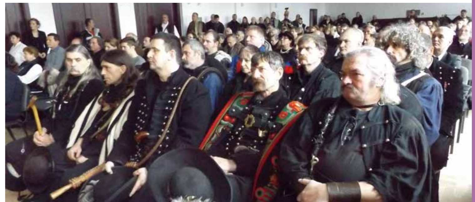
Szertartás a Művelődési Házban, az első sorokban a messziről érkezett vendégek