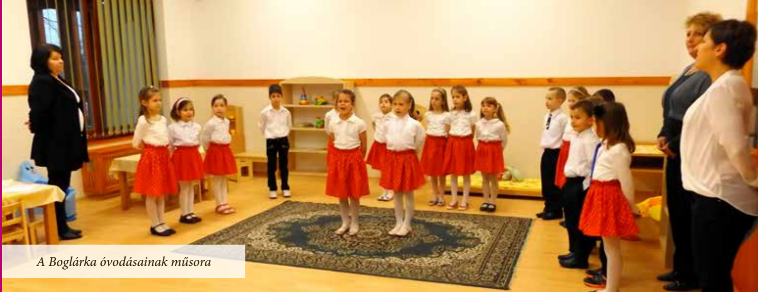
A Boglárka óvodásainak műsora