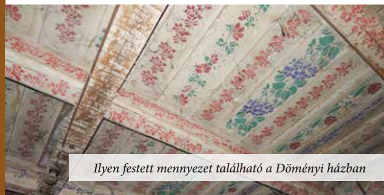
Ilyen festett mennyezet található a Döményi házban

A Városi Könyvtárban megtartotta első összejövetelét a Fóti Értéktár Bizottság által életre keltett Értéktár Klub. Mint a januári Fóti Hírnökben írtuk, a havi klubösszejövetel mindig más - az értéktár és helytörténeti múzeum létrehozásával kapcsolatos - témát fog tárgyalni, körbejárni. A február 5-i klubnap témája: Régi fotók Fót életéről.