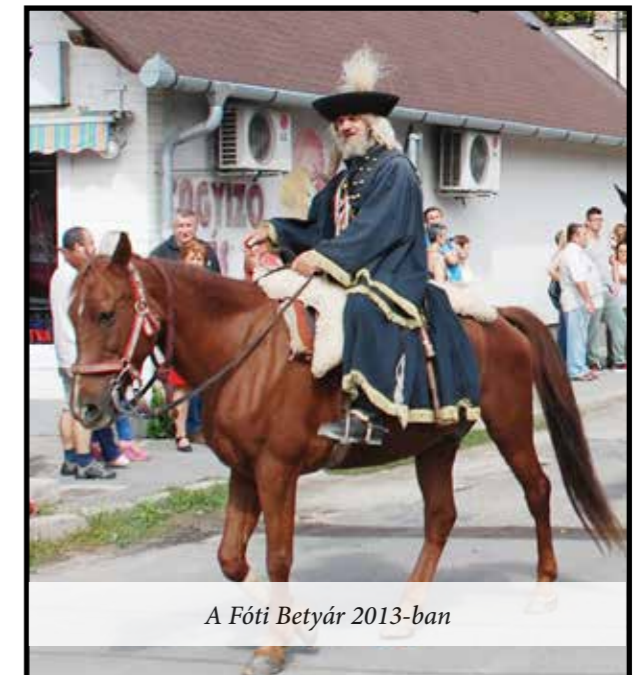
A Fóti Betyár 2013-ban