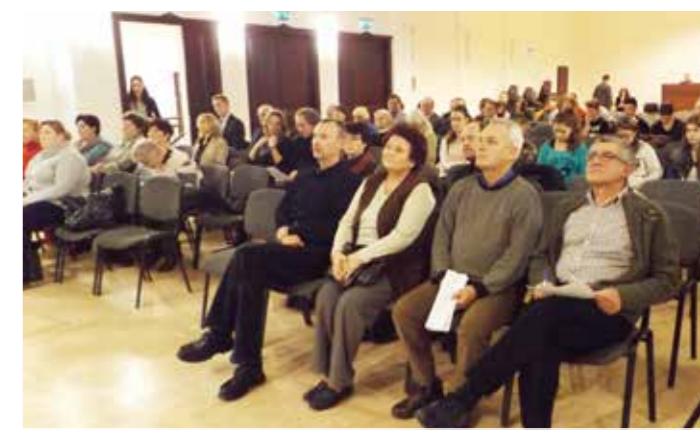
A nagyterem megtelt a kultúránkat ünnepelni jött főtájjakkal