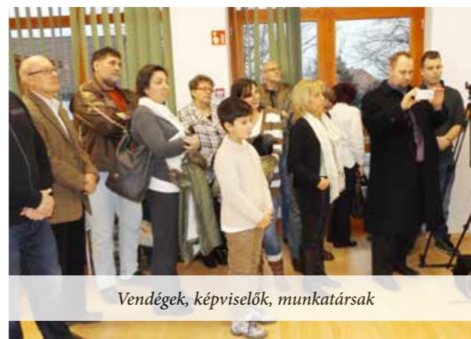
Vendégek, képviselők, munkatársak