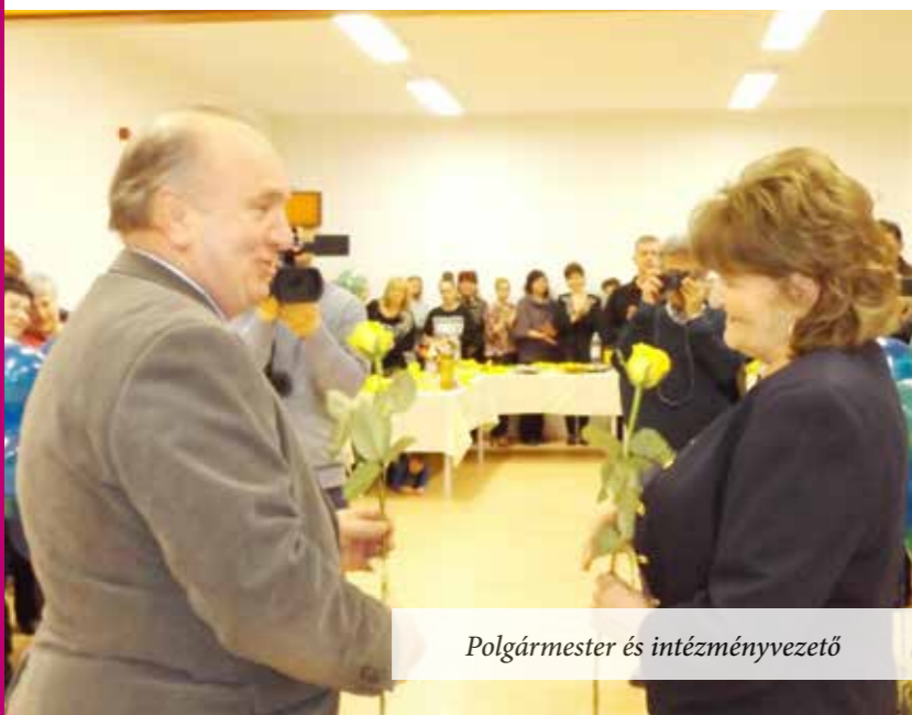
Polgármester és intézményvezető