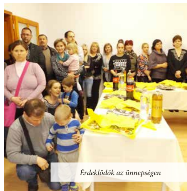
Érdeklődők az ünnepségen