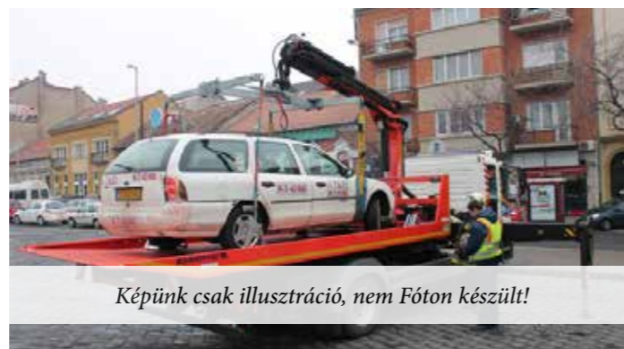
Képünk csak illusztráció, nem Fóton készült!

(7) A felügyelet a kerékbilincs fel- és leszereléséhez, a jár-