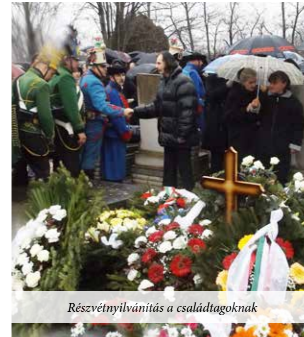
Részvétnyilvántás a családtagoknak