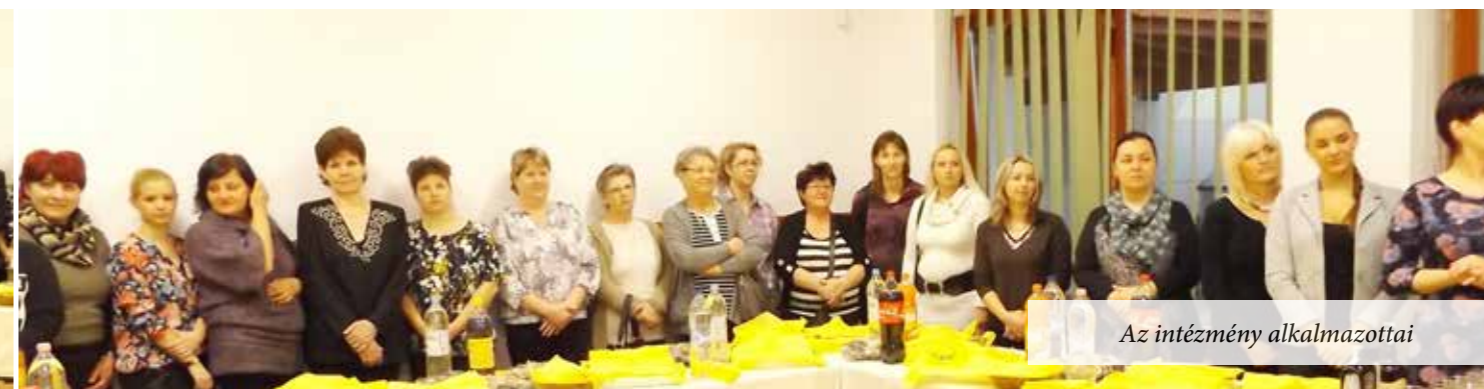
Az intézmény alkalmazottai