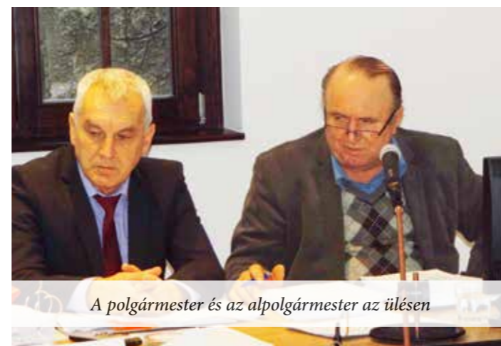
A polgármester és az alpolgármester az ülésen

Végezetül a képviselők nem vonták el ezt a juttatást, még csak nem is kurtították azt meg, mindössze zárolták a felét. Így a megjelentek viszonylag elégedetten indulhattak haza, abban a hitben, hogy a tömeg és az országos TV láttán a képviselők jobb belátásra tértek. Nem tudhatták, hogy a