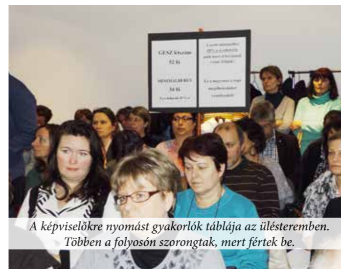
A képviselőkre nyomást gyakorlók táblája az ülésteremben. Többen a folyosón szorongtak, mert férték be.

Emellett olyan felújításokat tervezünk, amelyek az energiatartósságot növelik. Minden ilyen beruházás a gáz és villanyszámlákban fokozatosan megtérül, s a későbbiekben megtakarításokhoz vezet. Energiatakarékos, megújuló energia felhasználását tervező felújításokra is várunk pályázati kiírást. Jó példa a Fáy András általános Iskolában tavaly beindított faaprítékkal üzemelő új kazán, ami már működik. Nem áll le a csapadékvíz elvezetési program sem, Fót teljes területére készült el a terv. Tavaly elkészült a Géza fejedelem útja és a Baross utca rendezése. A 2015. évre a Kund Pál, Tóth Árpád utca és a Beniczky-köz rendezése történik meg,