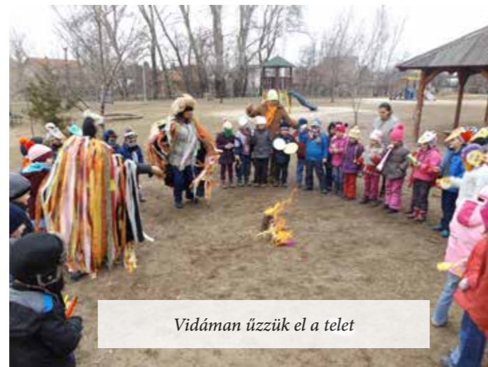
Vidáman üzzük el a telet