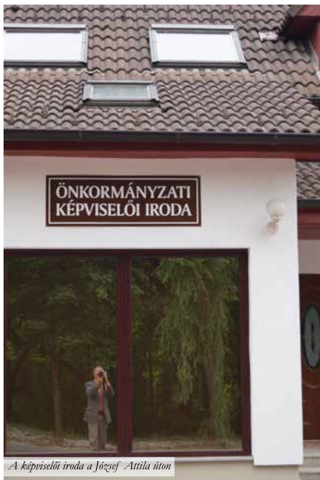
A képviselői iroda a József Attila úton

A nyári időszak utáni első képviselői fogadóóra időpontja szeptember 7. (hétfő).