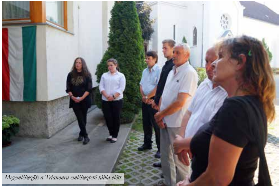
Megemlékezők a Trianonra emlékeztető tábla előtt