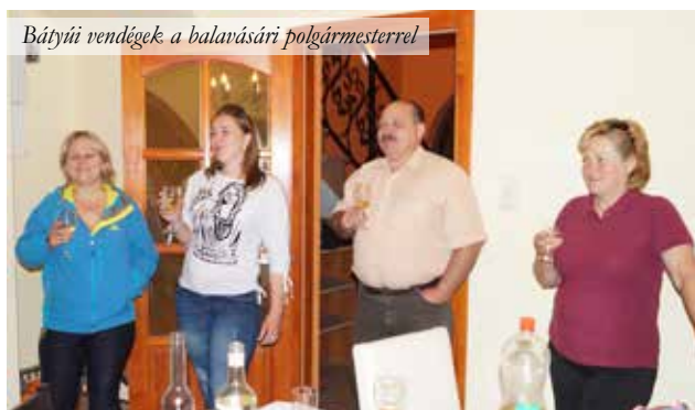
Bátyúi vendégek a balavásári polgármesterrel

Fót két testvértelepüléssel tart szoros kapcsolatot, az erdélyi Balavásárral és a kárpátaljai Bátyúval. Mindkét település képviseltette magát az ünnepségen és a főzőversenyre is beneveztek.