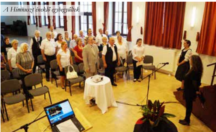
A Hymnusz éneklő egybegyűlék