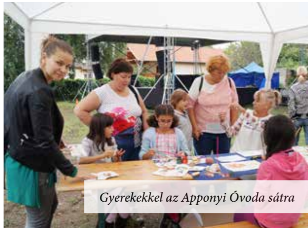
Gyerekekkel az Apponyi Óvoda sátra