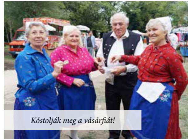
Kóstolják meg a vásárfiát!