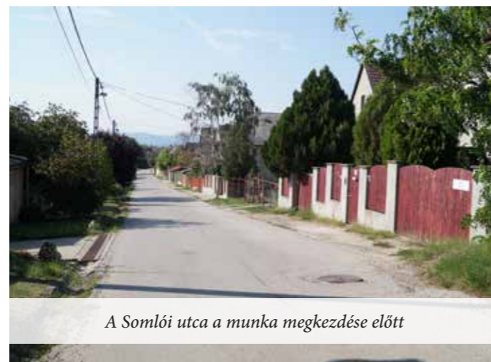
A Somlói utca a munka megkezdése előtt

Kezdődik a Somlói utca Balassa utca- Béke utca közötti szakaszán a vízelvezető árok kiépítése. A feladattal megbízott cég, a HE-DO Kft. szeretné csökkenteni a lakosságnak a munka során akaratlanul is okozott kellemetlenségeit. Ennek érdekében kértek ideiglenes telephelyet az önkormányzattól.