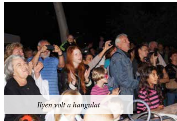
Ilyen volt a hangulat

A 2011. évi Önkormányzati Törvény képviselői munkára vonatkozó részének egyik pontja szerint „...a képviselő köteles kapcsolatot tartani a választóival, akiknek évente legalább egy alkalommal tájékoztatót nyújt képviselői tevékenységéről...”