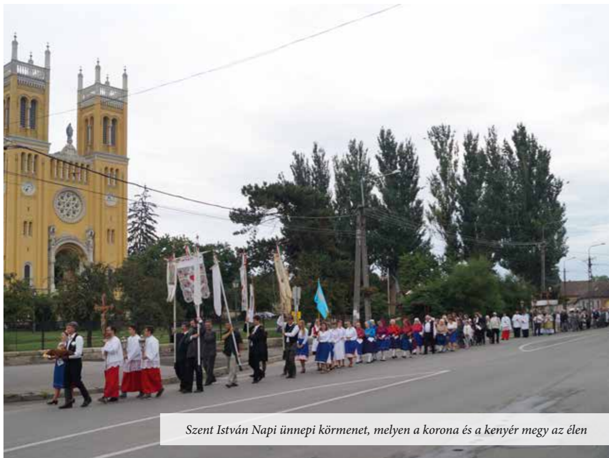
Szent István Napi ünnepi körmenet, melyen a korona és a kenyér megy az élen