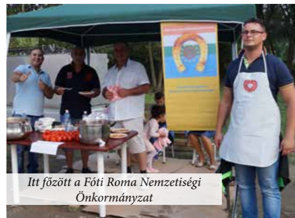
Itt főzött a Fóti Roma Nemzetiségi Önkormányzat