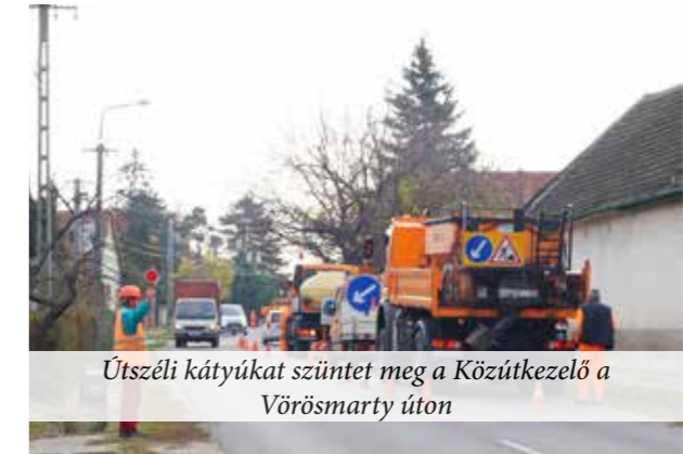
Útszéli kátyúkat szüntet meg a Közútkezelő a Vörösmarty úton