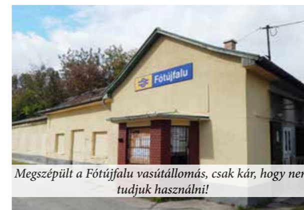
Megszépült a Fótújfalu vasútállomás, csak kár, hogy nem tudjuk használni!