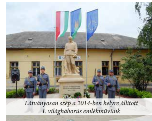
Látványosan szép a 2014-ben helyre állított I. világháborús emlékművünk