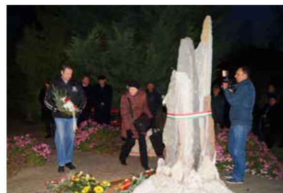
Egy koszorúzó család