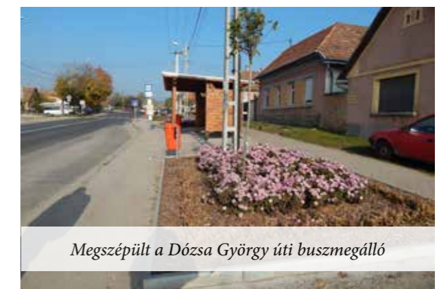
Megszépült a Dózsa György úti buszmegálló