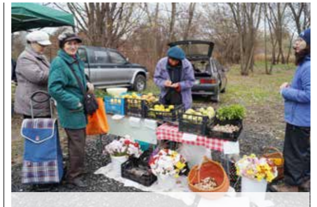
Novemberben is volt piac