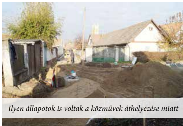
Ilyen állapotok is voltak a közművek áthelyezése miatt