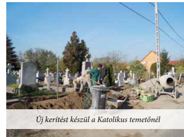
Új kerítést készül a Katolikus temetőnél