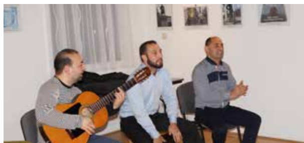
Zenekar az oktatáson

Az egyik célkitűzés, hogy a roma közösség legyen aktív és segítőkész Fót teljes területén a város gondjainak orvoslásában, vegyenek részt a közéletben és járuljanak hozzá Fót fejlődéséhez. A másik alapfelvelet a romák helyzetének javítása, kultúrájuk megtartása, átadása a fiataloknak, melyben belül elsődleges a zene, a tánc és a roma nyelv megtartása. Hassanak oda, hogy a romák is egészségesebb életmódot éljenek, környezetüket szükség szerint tegyék rendbe. Működjenek együtt céljaik elérése érdekében a Kincső Roma Felzárkóztatás Egyesülettel, ezen túl minden Fótón érdekelt szervezettel, az önkormányzattal, a rendőrséggel, a helyi civil szervezetekkel. Vegyék föl a kapcsolatot más települések Roma Önkormányzatával is a tapasztalatok átvétele, esetleges együttműködési lehetőségek kialakítása céljából.