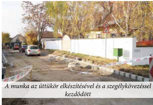
A munka az úttükör elkészítésével és a szegélykövezéssel kezdődött

Az utóbbi időszak legjelentősebb beruházása a Czuczor Gergely - Virág Benedek utca aszfaltozása, ami közműáthelyezésekkel, csapadékvíz elvezetéssel, kocsibejáró- és járda készítéssel járt együtt.