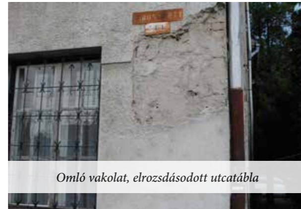
Omló vakolat, elrozsdásodott utcatábla