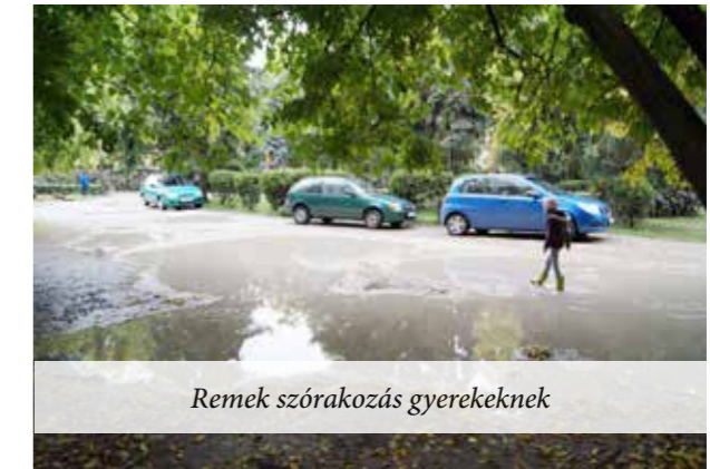
Remek szórakozás gyerekeknek