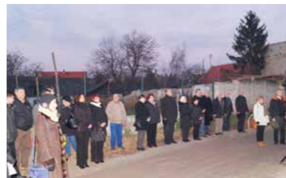
A megemlékezés résztvevőinek egy csoportja