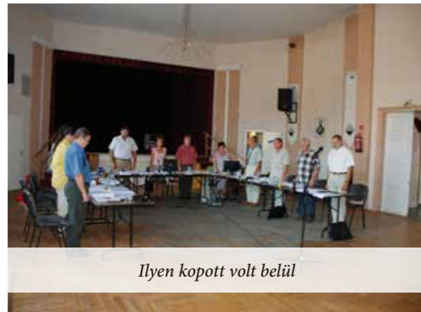
Ilyen kopott volt belül