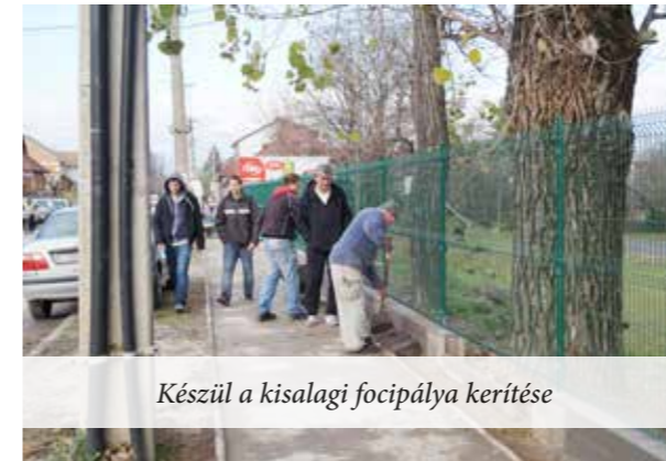
Készül a kisalagi focipálya kerítése