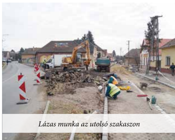
Lázás munka az utolsó szakaszon