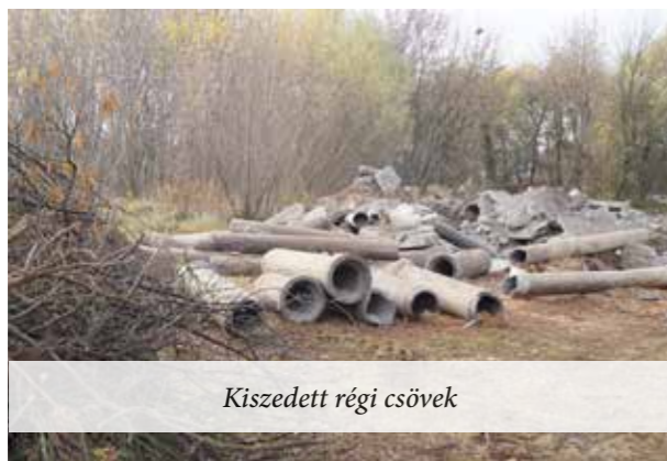
Kiszedett régi csövek