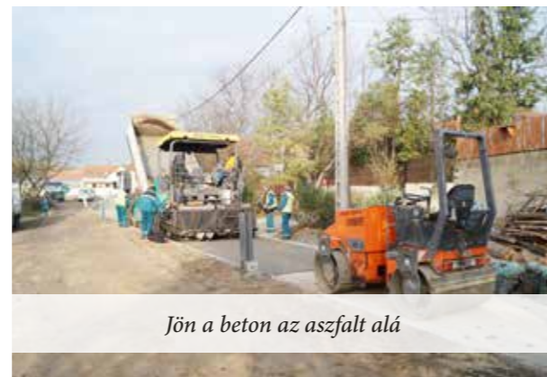
Jön a beton az aszfalt alá