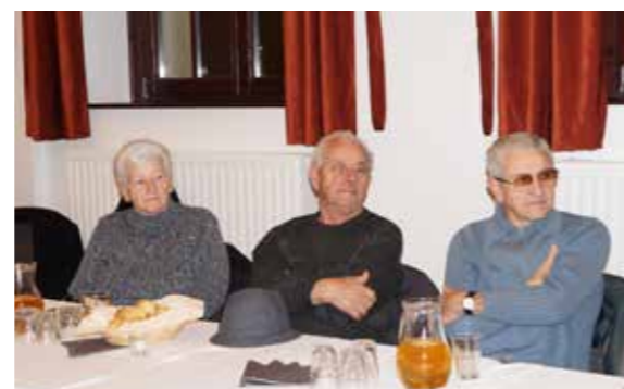
Hárman a háborús évek kárvallottjai közül