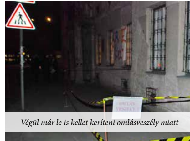
Végül már le is kellett keríteni omlásveszély miatt