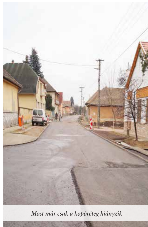
Most már csak a kopóréteg hiányzik