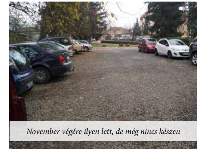
November végére ilyen lett, de még nincs készen