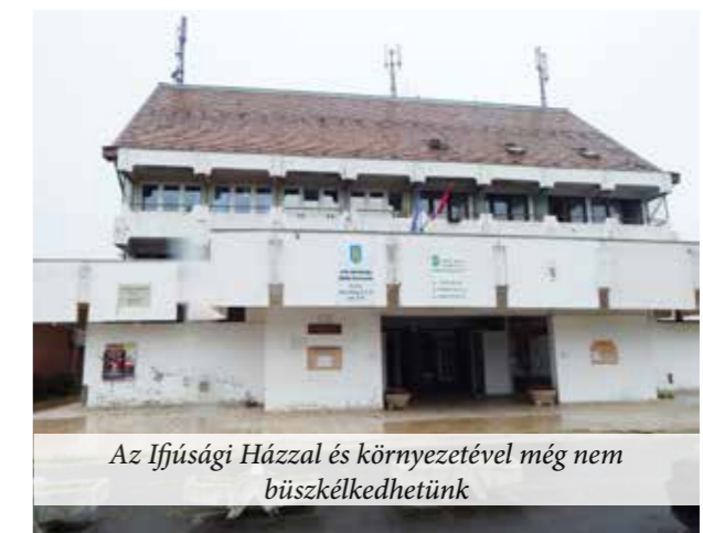
Az Ifjúsági Házzal és környezetével még nem büszkélkedhetünk