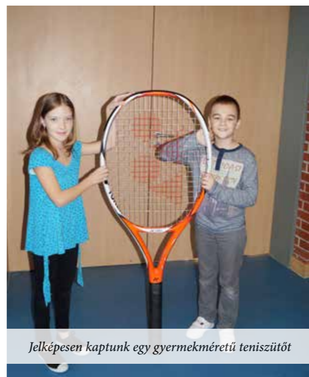
Jelképesen kaptunk egy gyermekméretű teniszütőt