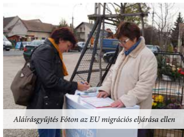
Aláírásgyűjtés Fóton az EU migrációs eljárása ellen

Az orbáni politika az új európai norma. Orbáni hangokat lehet hallani a francia szélsőjobb-szerű Nemzeti Fronttól, a spanyol baloldali Podemostól, Lengyelország új konzervatív vezetésétől, a szocialista olasz miniszterelnöktől, Matteo Renzi-től, a brit toryktól, sőt még Trumptól is Amerikában.