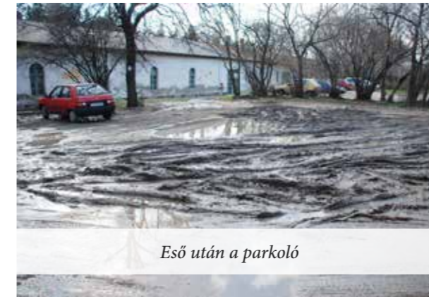
Eső után a parkoló