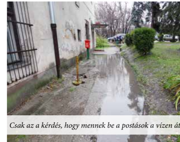
Csak az a kérdés, hogy mennek be a postások a vízen át?