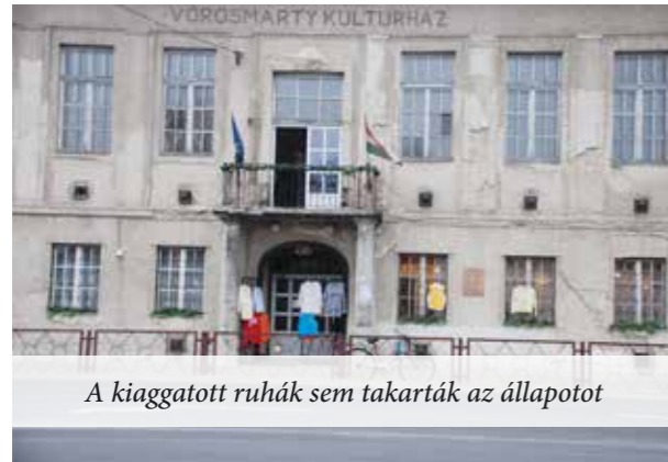
A kiaggatott ruhák sem takarták az állapotot