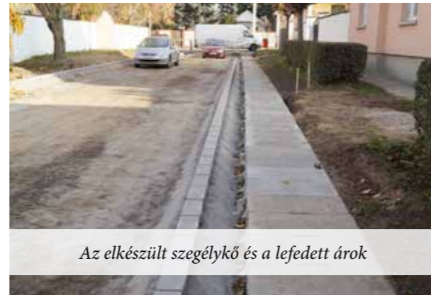
Az elkészült szegélykő és a lefedett árok