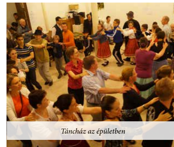
Tánczáz az épületben