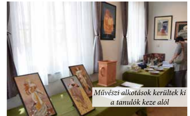
Művészi alkotások kerültek ki a tanulók keze alól