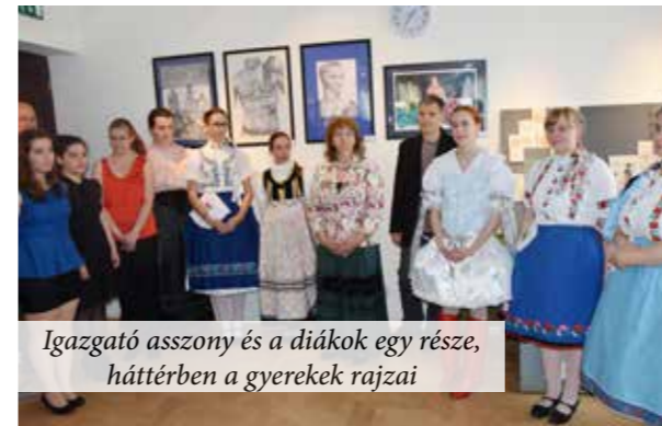
Igazgató asszony és a diákok egy része, háttérben a gyerekek rajzai

A június 2-án zajlott látványos eseményről képeinkkel számolunk be.