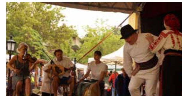
A Regenye zenekar csángó táncosoknak játszik