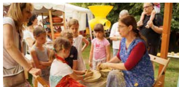
Ebből a lány agyagból bögre készül