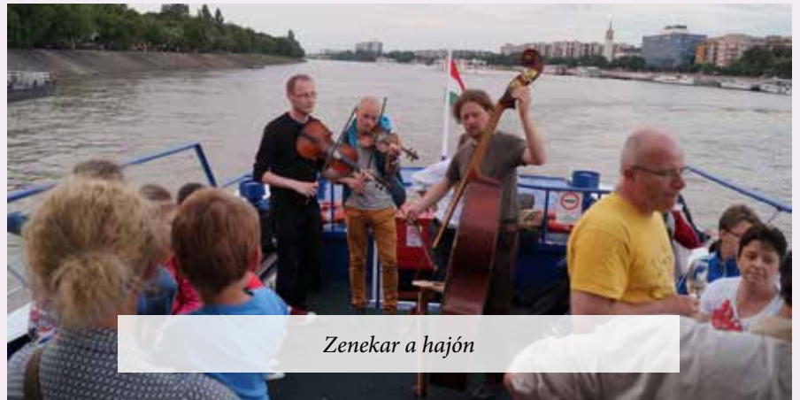
Zenekar a hajón