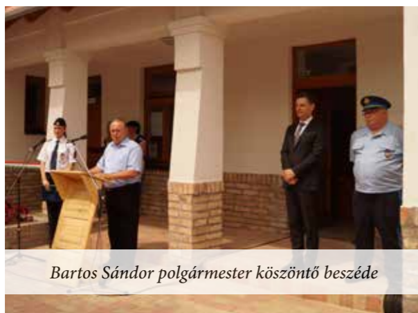
Bartos Sándor polgármester köszöntő beszéde