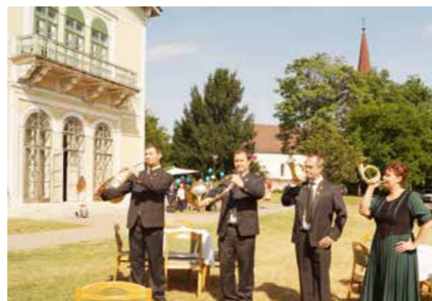
Vadászkürtösök adják hírül...