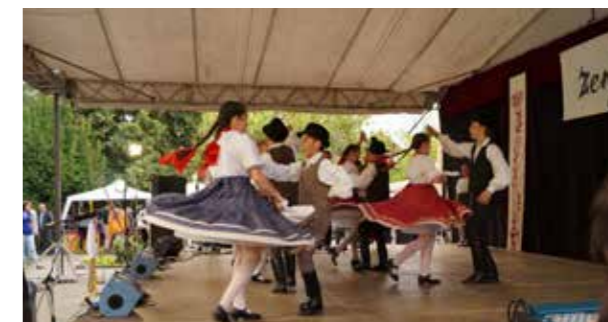
Sepsiszentgyörgyi gyerek táncosok