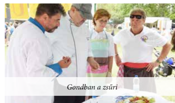
Gondban a zsűri