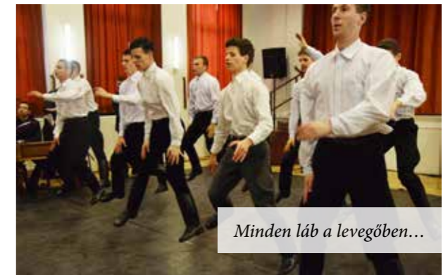
Minden láb a levegőben...