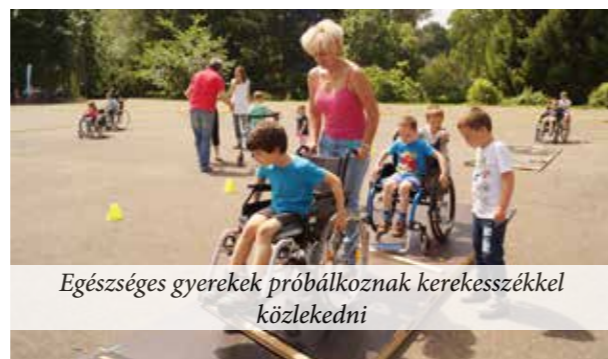
Egészséges gyerekek próbálkoznak kerekesszékekkel közlekedni