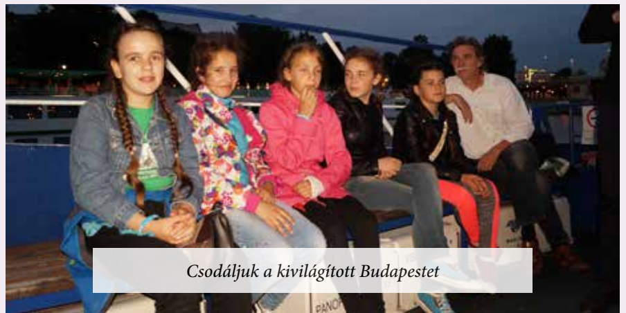
Csodáljuk a kivilágított Budapestet