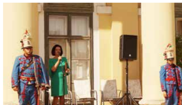
Erzsébet Asszony köszöntője