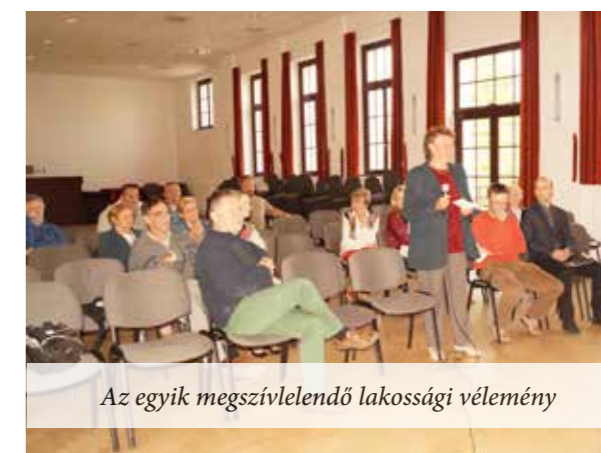
Az egyik megszívlelendő lakossági vélemény