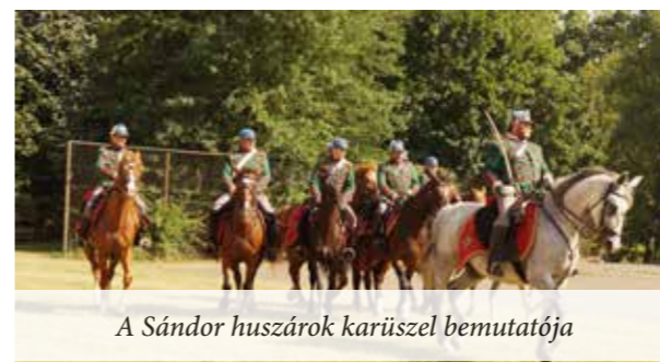
A Sándor huszárok karüszel bemutatója