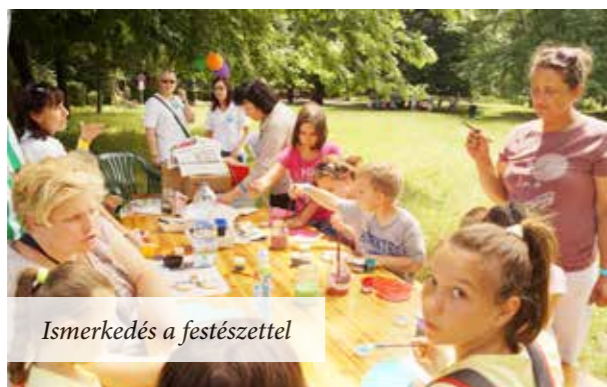
Ismerkedés a festészettel