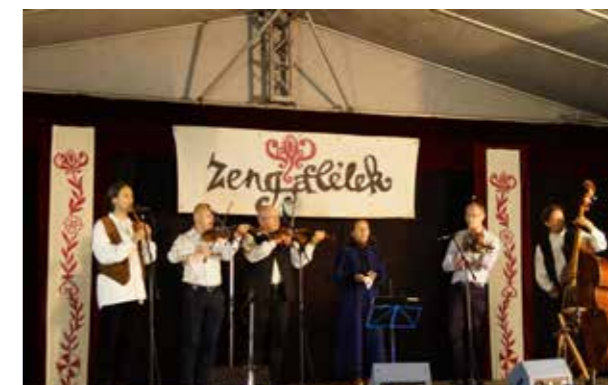
István Ildikó énekes és zenekara