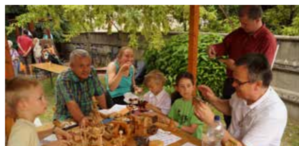
Ismerkedünk az ördöglakotok fortélyjaival

a kezében állt a színpad előtt, figyelve a fellépő csoportokat, szólistákat.