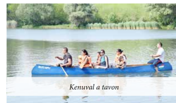
Kenuval a tavon