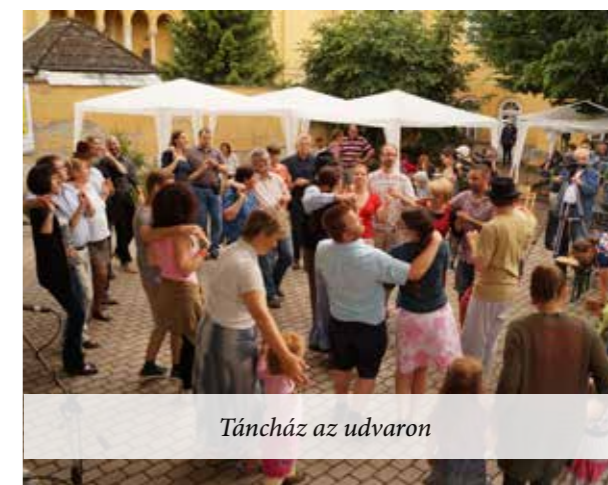
Tánczáz az udvaron