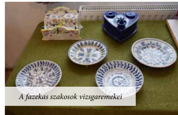
A fazekas szakosok vizsgaremekei