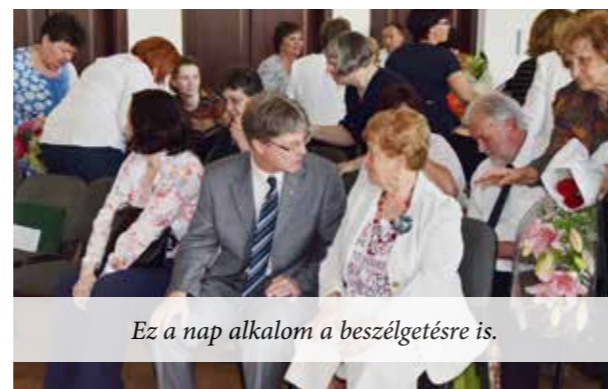
Ez a nap alkalom a beszélgetésre is.

Május 26-án együtt ünnepeltek Fót Város intézményeinek munkatársai. A Közalkalmazottak Napja lehetőséget ad arra, hogy a köznevelési, közművelődési, egészségügyi, szociális és ellátásukért felelős alkalmazottaknak köszönetet mondjunk. A műsort a Fóti Népművészeti Szakközép, - Szakiskola és Gimnázium tanulói adták.