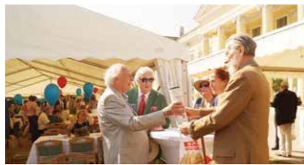
Gróf úr fogadja a vendégeket