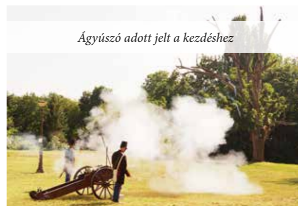
Ágyúzós adott jelt a kezdéshez