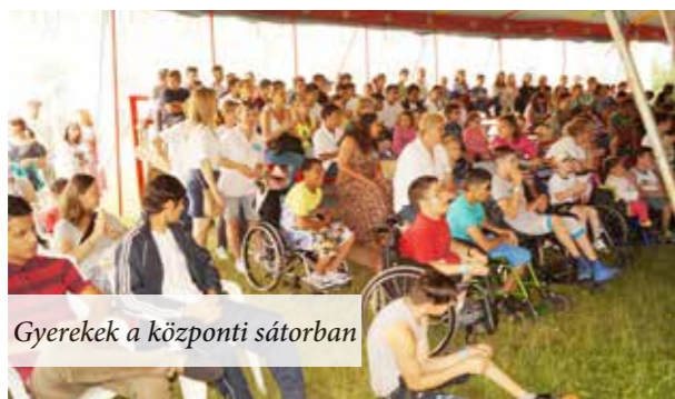
Gyerekek a központi sátorban