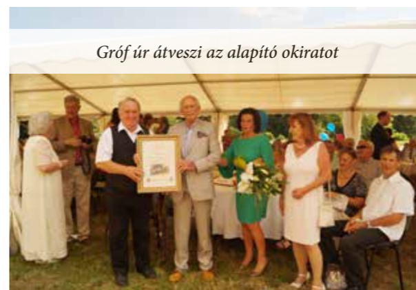
Gróf úr átveszi az alapító okiratot