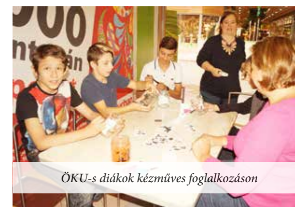
ÖKU-s diákok kézműves foglalkozáson

Az Auchan Szolidaritás Nap rendezvényen a 20. évfordulóját ünneplő Auchan az Ifjúságért Alapítvány ünnepélyes keretek között átadta támogatását a Fóti Ökumenikus Közművelődési Egyesületnek, 2016. október 5-én, a Fóti Auchan áruházban.