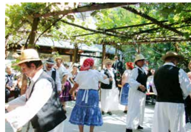
Képeink az Alapítvány egyik korábbi rendezvényén készültek.