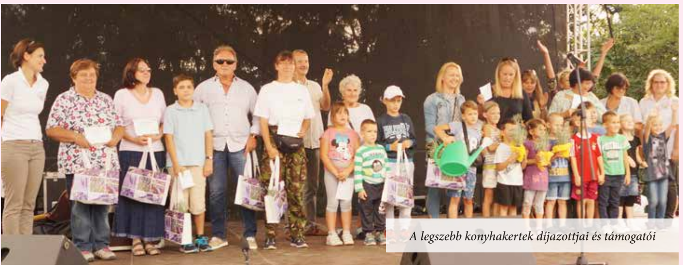
A legszebb konyhakertek díjazottjai és támogatói