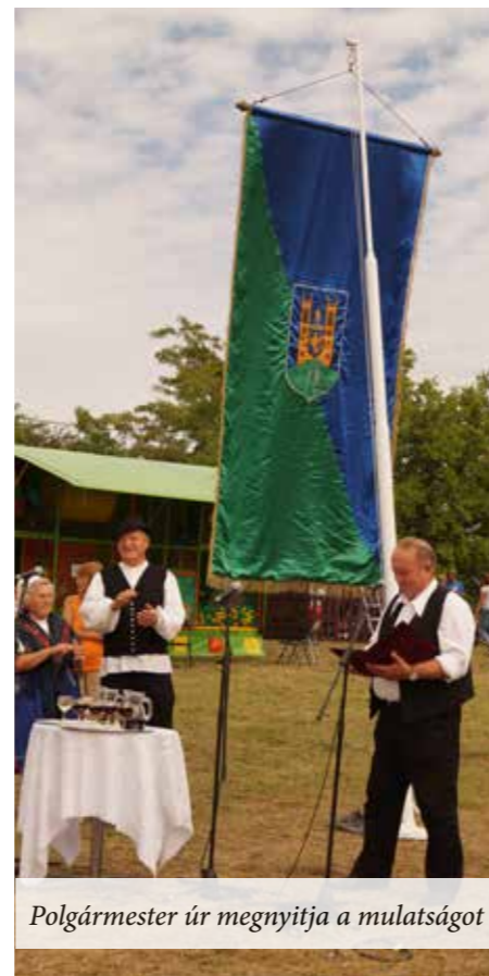
Polgármester úr megnyitja a mulatságot