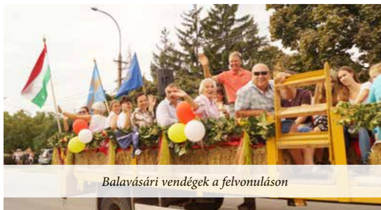
Balavásári vendégek a felvonuláson