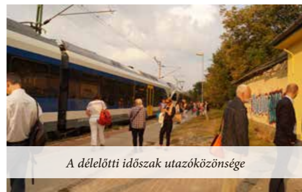
A délelőtti időszak utazóközönsége