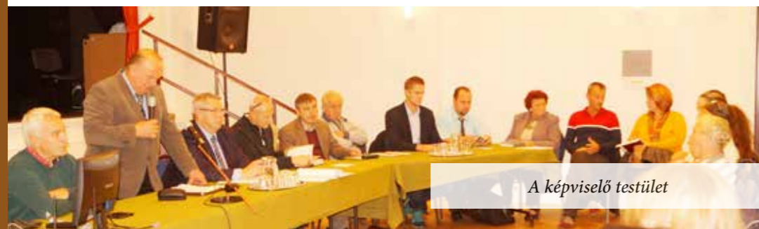
A képviselő testület