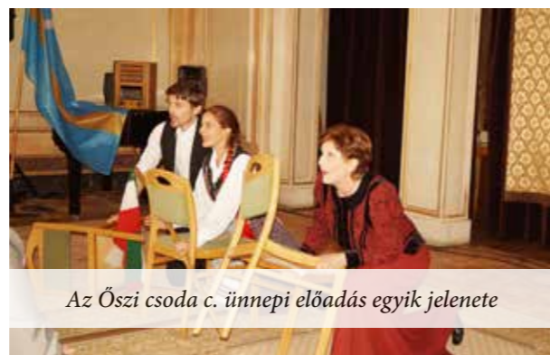
Az Őszi csoda c. ünnepi előadás egyik jelenete