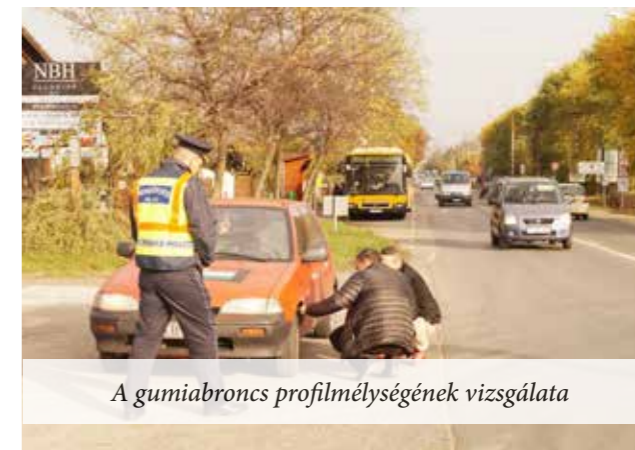
A gumibroncs profilmélységének vizsgálata

A Pest Megyei Rendőr Főkapitányság hívta sajtótájékoztatóra az érdeklődőket egy szokatlan helyszínre, a 2. sz. főút 22-es kilométerszelvényéhez, Göd határában. Itt állomásozott a gépkocsik biztonságos közlekedése érdekében elindított kampány egyik csapata, mely szűrőpróbaszerűen állította meg az arra közlekedő járműveket a szükséges ellenőrzések elvégzése és a figyelem felkeltése érdekében.