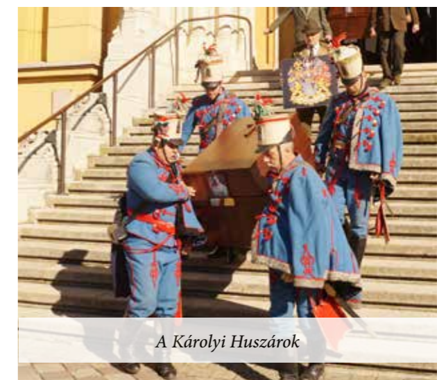
A Károlyi Huszárok