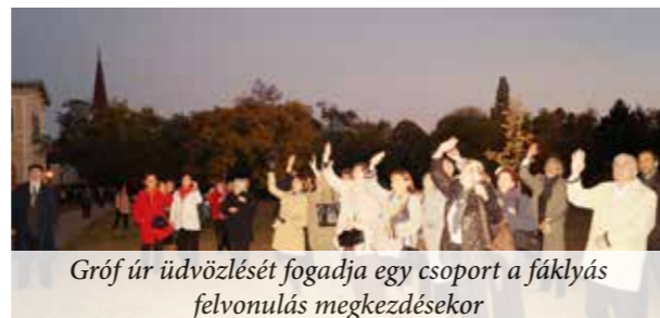
Gróf úr üdvözlését fogadja egy csoport a fáklyás felvonulás megkezdésekor