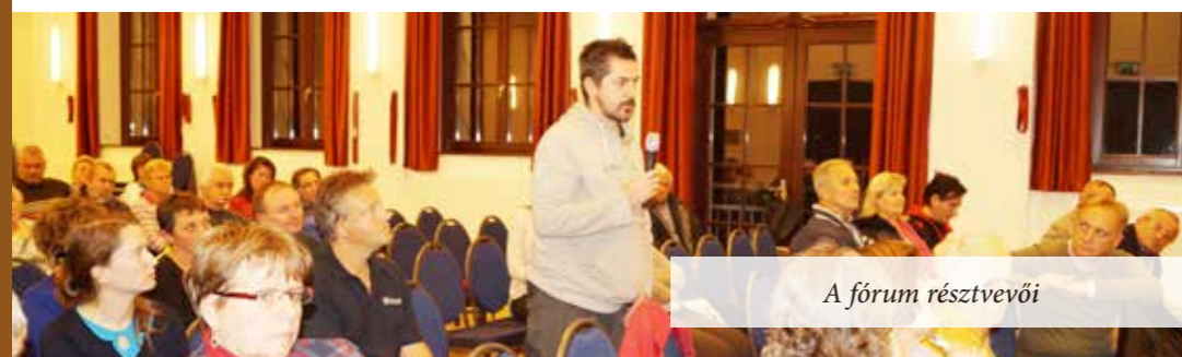
A fórum résztvevői

Fót Város Önkormányzatának Képviselő-testülete éves munkatervének megfelelően Közmeghallgatást tartott 2016. október 20-án 17 órai kezdettel a Vörösmarty Művelődési Házban. Bartos Sándor polgármester az Önkormányzat tevékenységéről és rövidtávú terveiről szóló beszámolója után a megjelentek feltehetők kérdéseiket a jelenlévő képviselőknek.