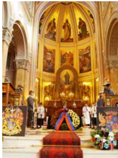
A Fóti Asszonykórus