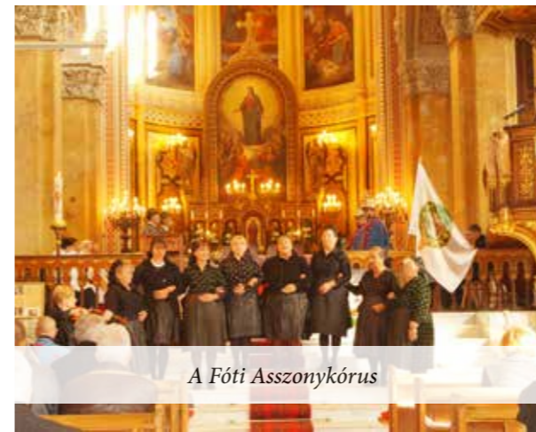
A Fóti Asszonykórus