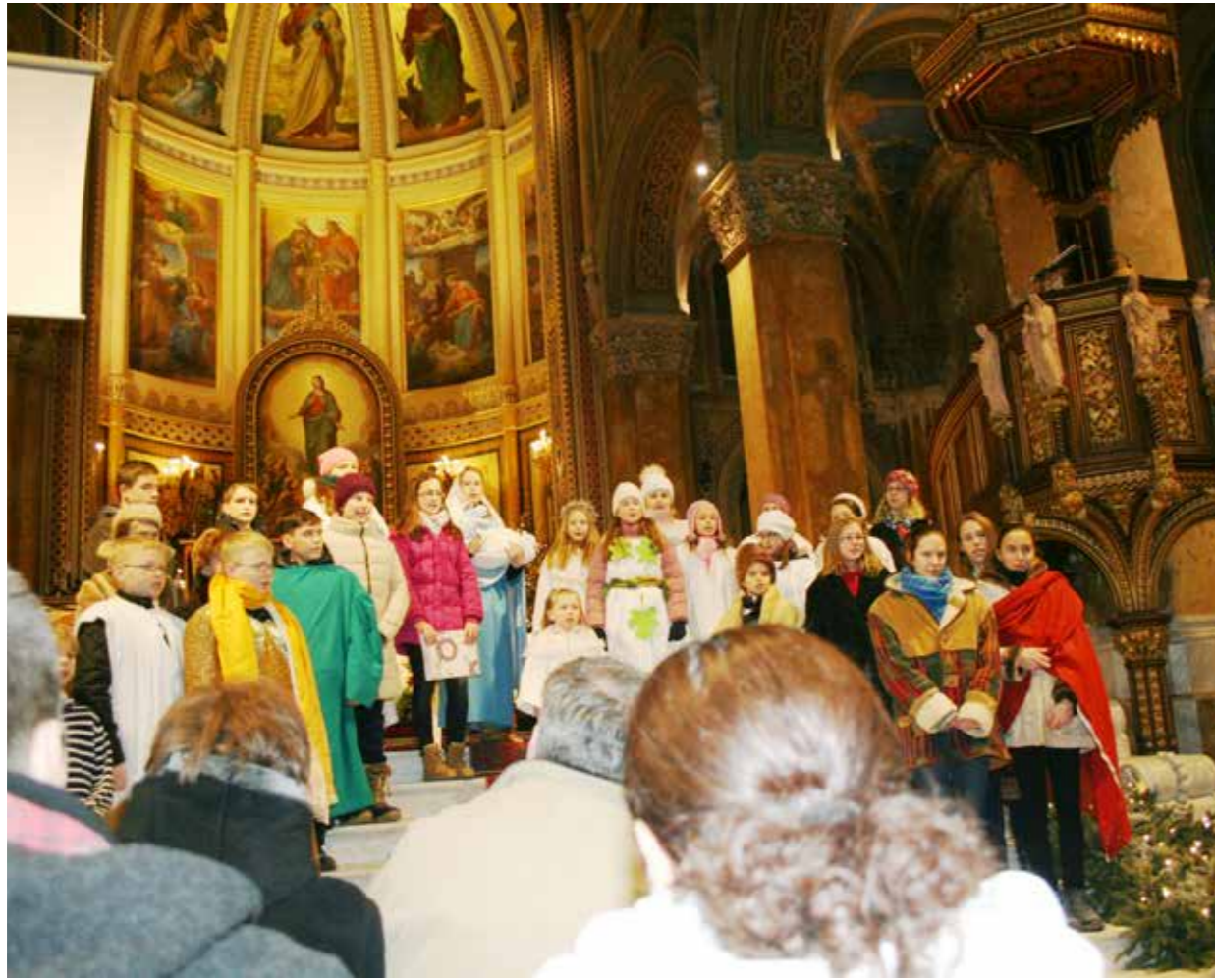
Karácsony szentestéje előtti délutánon pásztorjátékot adtak elő a katolikus templomba járó gyerekek a Szeplőtelen Fogantatás Templomban. Igazi, szép ráhangolódást jelentett a csillogó gyermekszemekben gyönyörködni, a jól ismert történetet ismét átélni. A jól sikerült fényképet egy kedves szülőnek köszönhetjük.