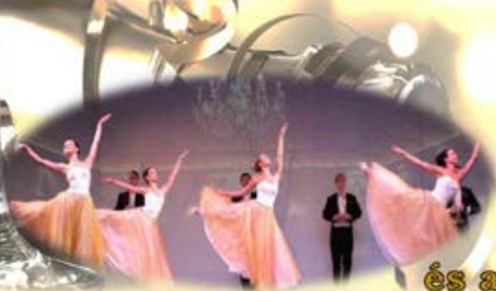
és a Tánckar