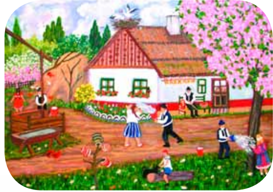
Mándoki Halász Zsóka: Húsvéti locsolkodás