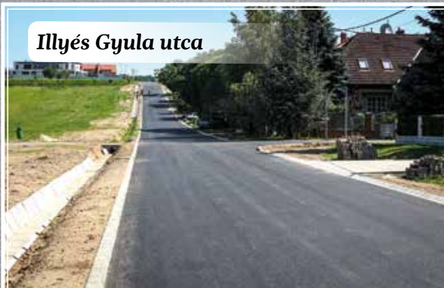
Illyés Gyula utca