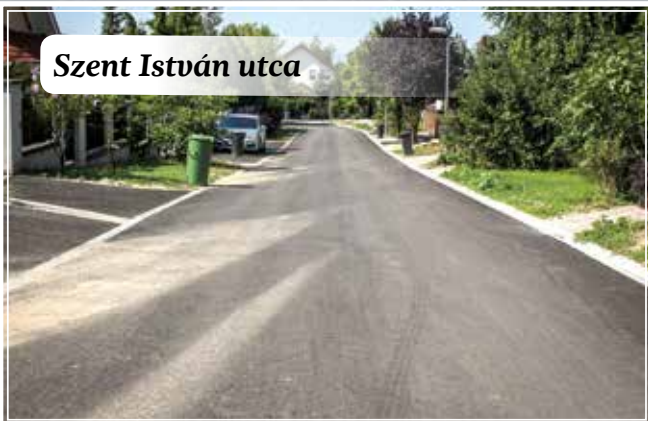
Szent István utca