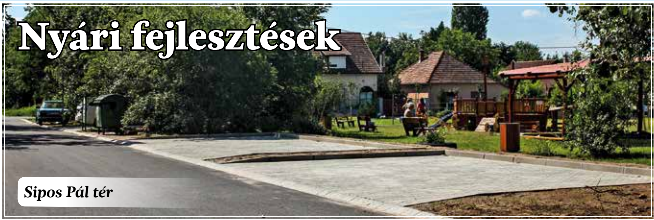
Sipos Pál tér