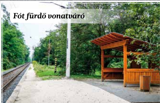
Fót fürdő vonatváró

IMPRESSZUM: Fóti Hírnök Fót Város Önkormányzatának havonta megjelenő, ingyenes lapja Kiadja Fót Város Önkormányzatának megbízásából a Profinyomtatás.hu Kft. Cím: 1119 Budapest, Tétényi út 29. Felelős szerkesztő: Petrók Tamás, Szerkesztő: Kaczúr Gyula, Málnai Lilla, Fotók: Zsoldos Luca, E-mail: info@fotihirnok.eu. Megjelenik havonta 8000 példányban ISSN: 2062-6754 Terjesztés: Magyar Posta Zrt. Az újságban feladott hirdetések tartalmáért és az azokban foglalt szolgáltatások minőségéért felelősséget nem vállalunk. Hirdetésfelvétel: info@fotihirnok.eu +36 30 298 9269 Lapzárta: adott hónap utolsó napja