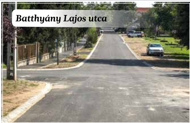
Batthyány Lajos utca