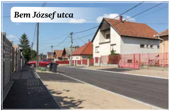
Bem József utca