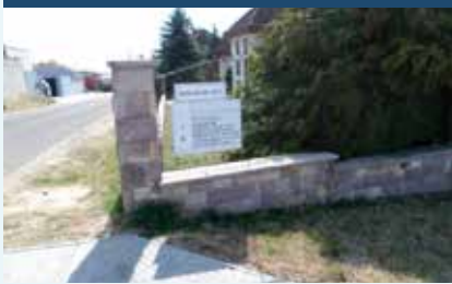
Illyés Gyula utca

A kivitelezési munkákat a 2016. június 2-án indított közbeszerzési eljárás nyertese, a PENTA Kft. végezte el.