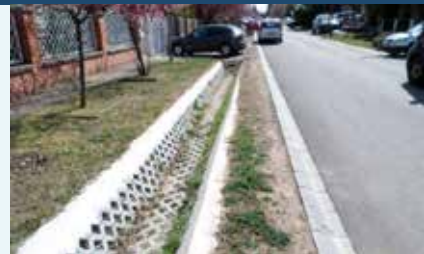
Veress Péter utca