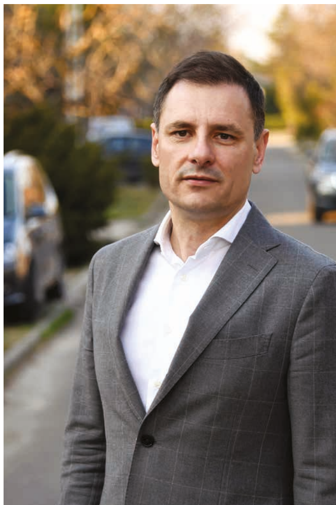
Tuzson Bence, a Pest megyei 5-ös számú választókerület országgyűlési képviselője

– Elindítottam egy saját programot, amelynek célja, hogy az általam képviselt településeken élő emberek tudjanak élni azokkal a lehetőségekkel,