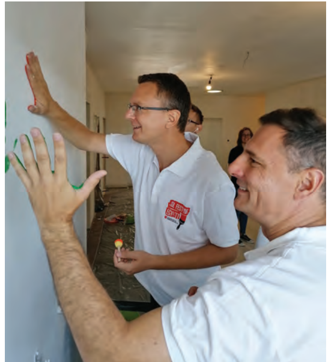
Festés és tenyérlenyomat

Ezek sorába illeszkedik az Szja-visszatérítés is?