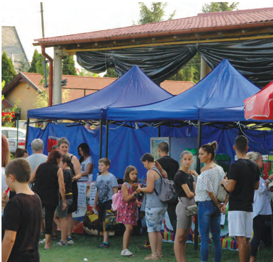
Sorban állás a büfénél

A tó büféjében és a kitelepült szolgáltatóknál is vidám sorok alakultak ki, kinek a lángosért, kinek a hamburgerért, de volt, aki csak egy hideg sört szeretett volna inni. Közben megtelt a kisebb előadótér is, ahol, hogy mindenki megtalálta a számára kedvenc zenét, mert elindult a Kund Grund Kult koncertsorozatának egyházzenei része is, amelyben egyház-