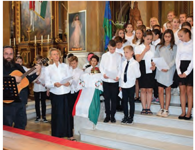
Gyerekek kórusa a szentmisén

A korábbi ökumenikus iskola fenntartója a Fóti Ökumenikus Közművelődési Egyesület 2020-ban ajánlotta fel a Váci Egyházmegye számára az iskola átvételét. Mivel az EKIF saját szabályzata szerint intézményt nem vesz át, csak új alapítására vállalkozik, ezért jött létre az ideai tanévkezdésre a Szent Ágoston Keresztény Általános Iskola és Gimnázium. Az iskola jelmondatát is névadójától vette: „Bened égnie kell annak, amit lángra akarsz lobbantani másokban.”