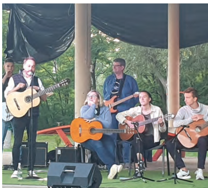
Amatőr és profi zenészek az Első Fóti Flashmobban