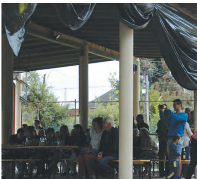
A közönség örömmel fogadta az előadásokat