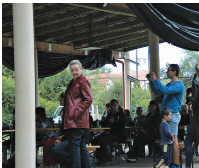
Nagy sikert aratott az olasz est