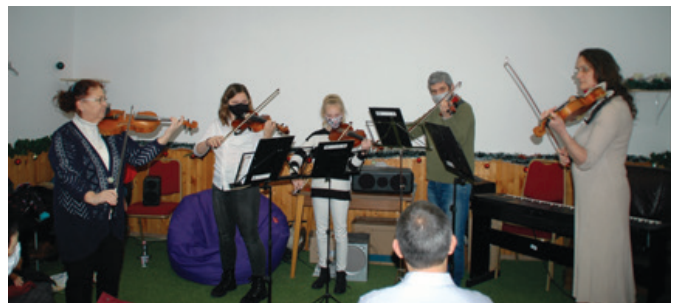
A Fóti Zeneiskola növendékei és tanárai hangulatos karácsonyi zenéssel kedveskedtek a résztvevőknek