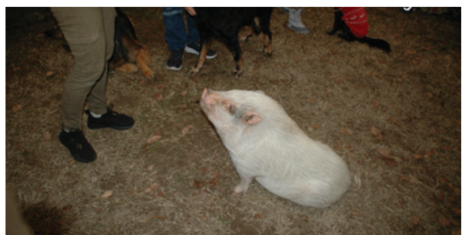
A legnagyobb kedvenc Pepa malac volt