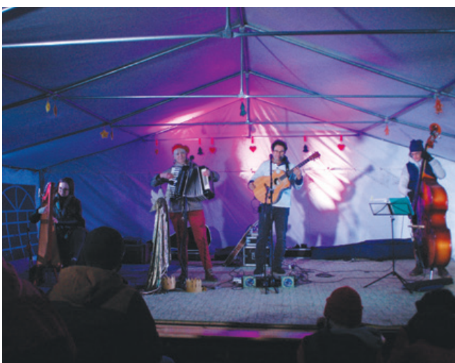
A Katáng együttes koncertje