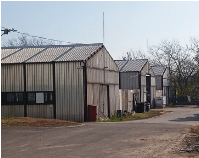
A raktárak helyén épül az egyik új stúdiókomplexum