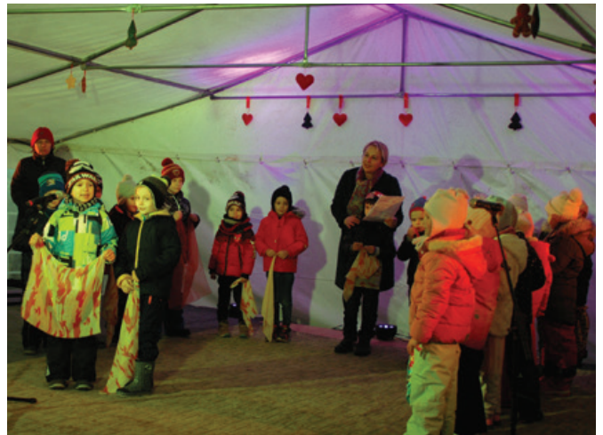
A Fóti Boglárka óvoda és Bölcsőde óvodásai