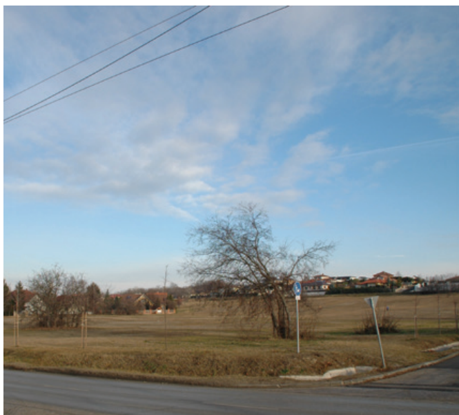
A buszfordulóval szembeni füves területen épül meg a Príma üzletközpontja

ebédlőjének az építése, amely a készülő tervek szerint a főépülettel egybe lesz építve, hogy a gyerekeknek ne kelljen kimenniük az udvarra az ebédlőbe jutáshoz. Folyamatosan keressük a lehetőséget pályázati forrás igénybevételére.