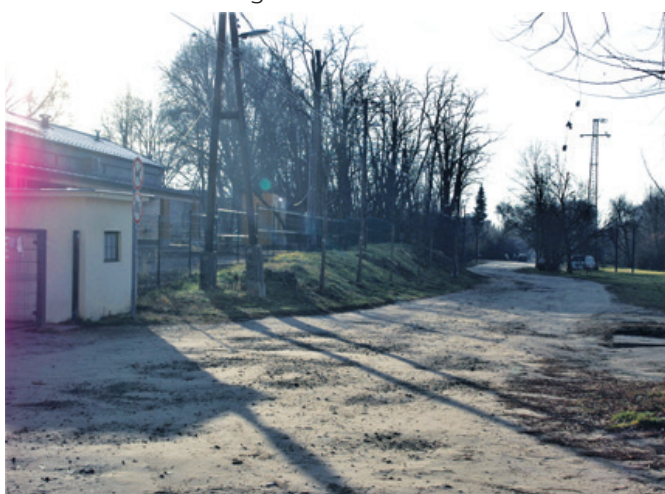
A Hársfa utca szilárd burkolata a Somlyó-tó bejáratáig még az idén elkészül

– Valóban így van. Az első a sorban és a legnagyobb projekt a Városi Sportcsarnok építése. Ez tavasszal elkészül. Sok kritikát kapunk a Sportcsarnok miatt, ami azt mutatja, sokan nem látnak egy fontos dolgot a Sportcsarnokkal kapcsolatban. Kezdjük azzal, hogy egyrészt akkor ennek a megépítésére volt lehetőség. Másrészt, aki csak egy sportcsarnokként tekint rá, az nem látja a lényegét. Bár valóban sportcsarnokként épül, ám a csarnok helyet ad majd kulturális és kö-