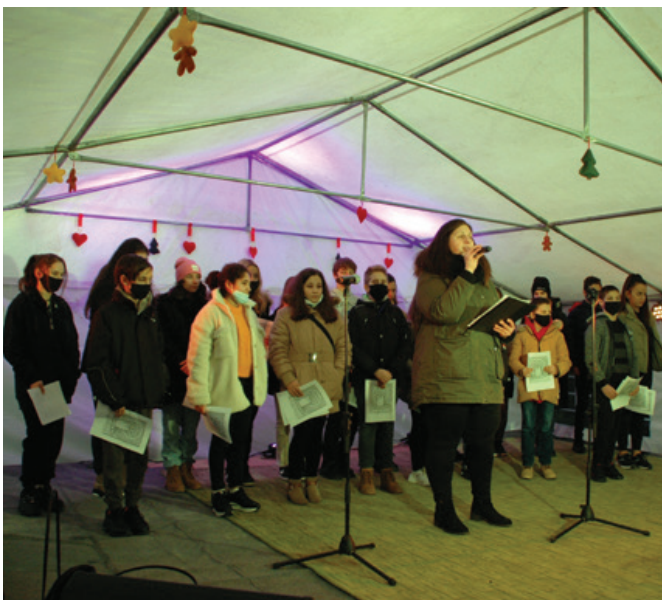
A Németh Kálmán Iskola kórusa