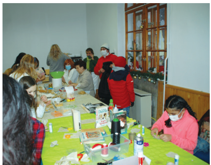
A kézműves foglalkozásokat nem lehetett megunni