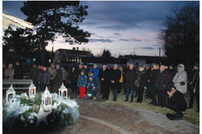
A harmadik gyertya meggyújtása

A nap megkoronázása azonban fél öt után következett, amikor a gyerekek által már nagyon várt Apacuka együttes koncertjét hallgathatták kicsik és nagyok.