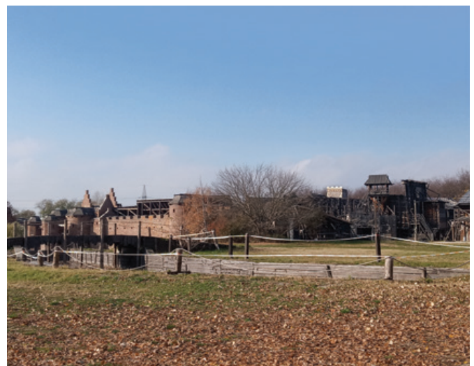
Az egyik jelentős külső díszlet