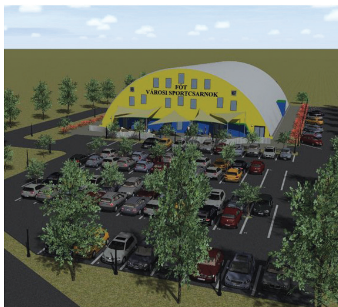
Városi Sportcsarnok látványterve

zösségi rendezvényeknek is. Nem beszélve azokról a sportolási lehetőségekről, amelyet a fóti gyerekeknek és felnőtteknek kínál majd. A sorban a második a műfüves sportpálya, amely már elkészült, és a környező terület rendezését követően tavasszal szintén átadásra kerül. Bár nem ide tartozik, mert még nem kezdtünk bele, de van még egy újdonság, amiről kevesen hallottak. Azt ma már mindenki tudja, hogy a rendszeres mozgás az egészségünk alapját adja. A harmadik átadásra kerülő létesítmény pedig a Somlyó – tónál épült ABC-büfé épülete lesz. Ezt 2022 elején adjuk át, és egyben egy pályázatot is kiírtunk az üzemeltetésére. Az a célunk, hogy nyár elejére már egy működő ABC-büfé várja a tóhoz érkezőket és szolgálja ki a környéken élők igényeit.