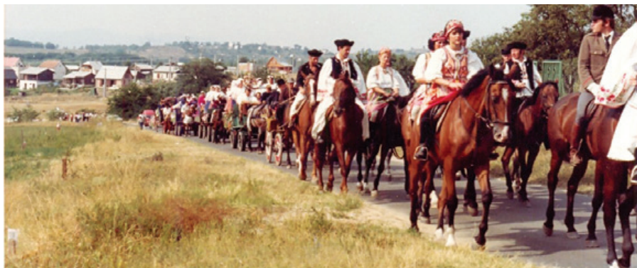
Szüreti felvonulás, 1990-es évek

| „Az új kezdet” – egy nagy múltú hagyomány újratereemtése: