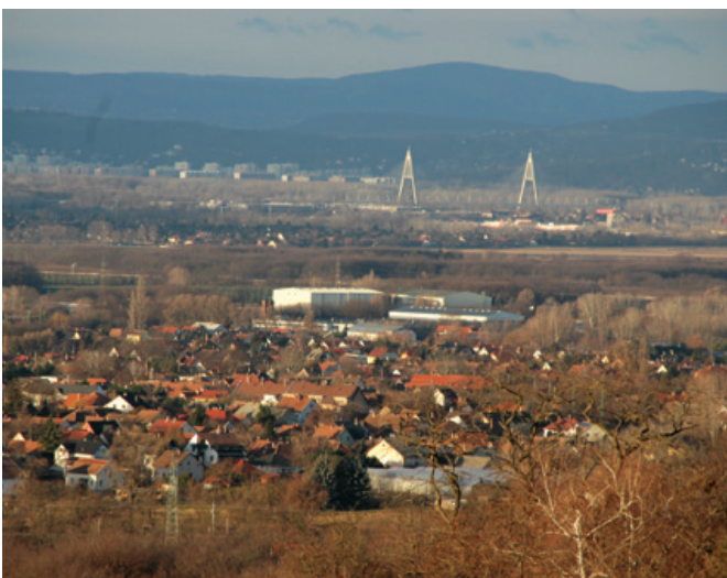
Fót az Öreghegyről fotózva, a háttérben a MAFILM és a Megyeri híd

tótermes reprezentatív fogadóépület. Hiába, ma már nem elég csak a technika, a sztárokat bizony minden szempontból ki kell szolgálni. Ez is a szolgáltatás része.