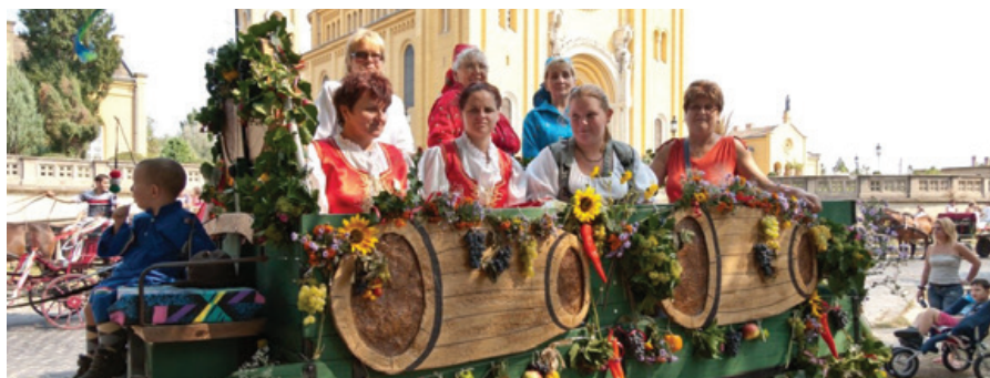
A szüreti felvonulás 2011-ben

2018-ban a Fóti Települési Értéktár Bizottság rendezte meg az 50 éves a Fóti Ősz – jubileumi kiállítást (1968–2018) a Vörösmarty Művelődési Házban, melyet nagy érdeklődés kísért. Reméljük a jövőben sikerül feleleveníteni a régi Fóti Őszök világát és újra két hónapos eseménysorozat formájában ünnepelhetjük Fót városának egyik meghatározó rendezvényét.