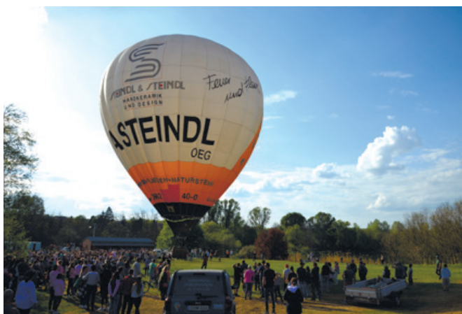
A hőlégballon sokaknak felkeltette a figyelmét

Az FKN Kft. által szervezett Retró Majálisát támogatta: