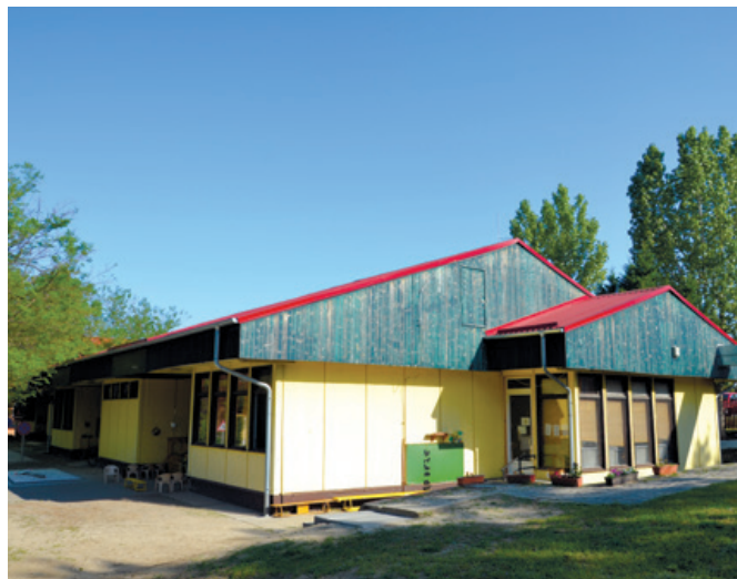
A fóti Boglárka Óvoda és Bölcsőde épülete

– A Királydomb előtti üres telekrész bal oldalán, egy 1,2 hektáros park épül. A parkot szegélyezi egy sé-