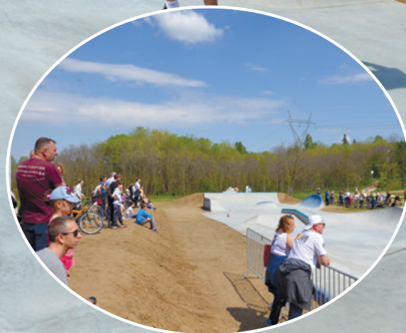
A fiatalok birtokba vették a görpályát