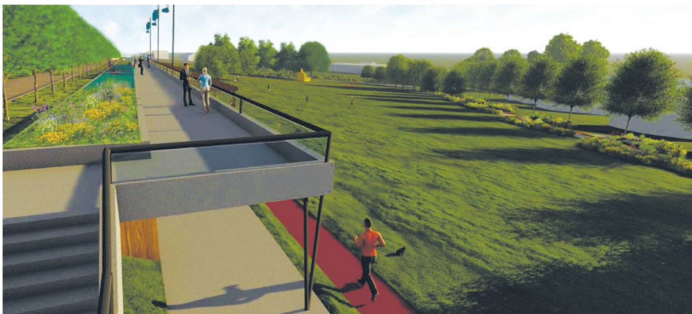
Az új közpark látványterve

– A pályázaton az intézményeink energetikai korszerűsítésére kaptunk támogatást, mintegy bruttó 128,2