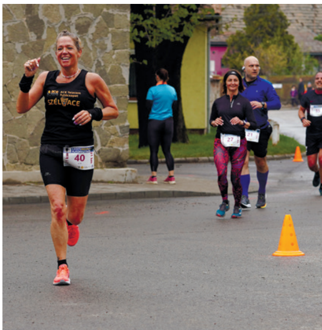
Van aki szélvészként érkezett

„...nem az eredmény (...) határoz meg minket. Hanem az, ahogyan elértük.” (Scott Jurek)