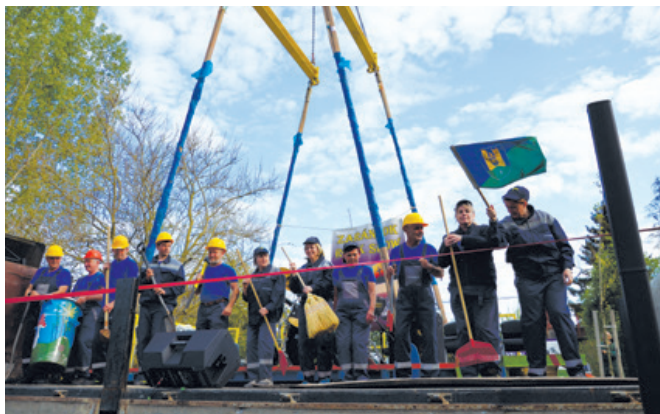
A Fóti Közszolgáltató Kft. csapata