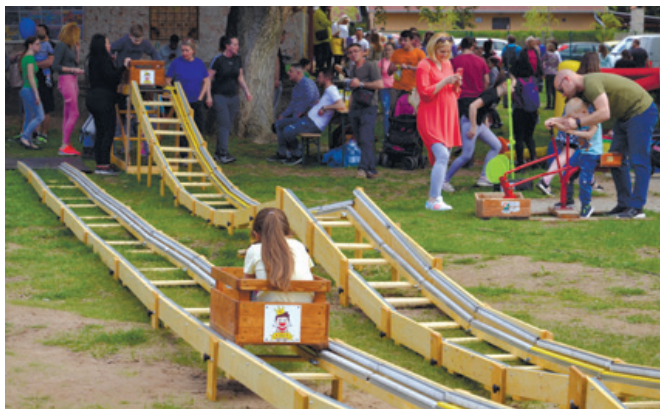
A gyerekek élvezték a játékokat