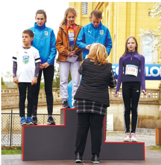
Az egyik eredményhirdetés a dobogósokkal

A verseny támogatói: Fóti Város, Impulzus Sportegyesület, Fóti kézműves sörfőzde, Tímár vaskereskedelmi kft., Spuri futóbolt, Dechatlon.