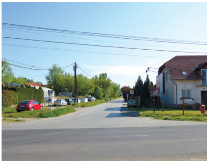
A József Attila utca és a Keleti Márton utca kereszteződése

millió Ft összegben. Ebből az összegből valósul meg a Fóti Boglárka Óvoda és Bölcsőde Bölcsőde utcai, illetve a Boglárka Óvoda tagintézményének az Eőri Barna utcai óvodának az energetikai korszerűsítése. Emellett napelemek elhelyezésére kerül sor az ESZEI Hargita utcai épületén, illetve megtörténik a Fóti Közszolgáltató Nonprofit Kft. Malom utcai irodájának homlokzati hőszigetelése, és napelemek elhelyezése az épület tetőszerkezetén.