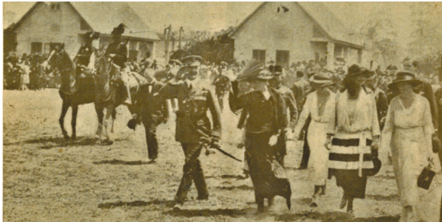
A kormányzó a sátrak megtekintésére indul, 1922.05.25.

Ezt követően a vidámságé és a jókedvé volt a főszerep, melyről egy katona- és két cigányzenekar gondoskodott, akik már az étkezések alatt rázendítettek. A cigányzené-