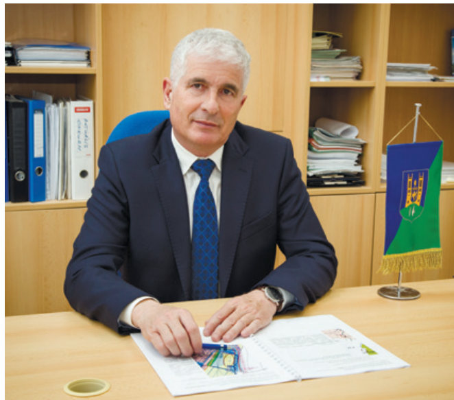
Bíró Zoltán beruházásokért felelős alpolgármester