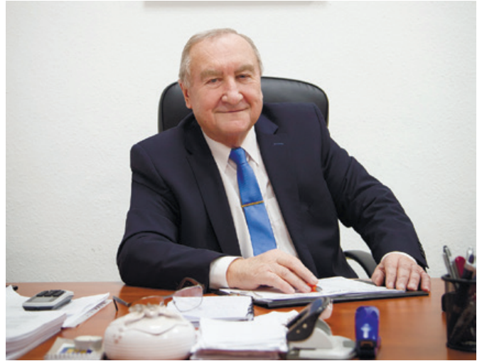
Dr. Vass György polgármester

– Például a konkrét, tárgyévvel kapcsolatos számok tükrében is sok minden megmutatkozik. Nézzük a tavalyi évet a városnak. A beruházások összege elérte az 1,1 milliárd forintot. A város bevételei rekordot döntöttek, ahogy a tervezés és a valós tények közötti megvalósulás is. A város bevételi főösszege, ha hajszállal is, de 9 milliárd forint fölé került. Ebből a pénzmaradványunk valamivel több, mint 3 milliárd forint. A város vagyongyarapodása pedig 2021-ben 700 millió forint volt. Vagyis bátran mondhatom,