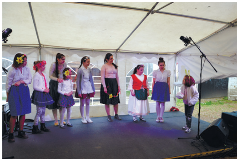
A Muharay Színpad gyerektársulata

– Önkéntes koordinátor vagyok, ami azt jelenti, hogy szervezem a helyben jelentkező családokhoz az önkéntesek odajuttatását. Valamint azokat az önkénteseket, akik szeretnének segíteni, egy 50 órás képzés keretében felkészítem a családokkal való