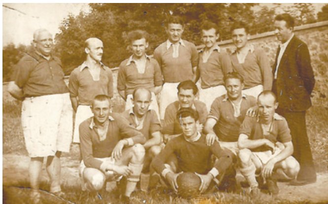
A Fóti SE csapata