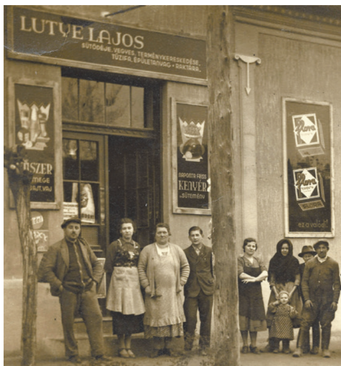
Luttve Lajos péksége és szatócsboltja, 1930-as évek