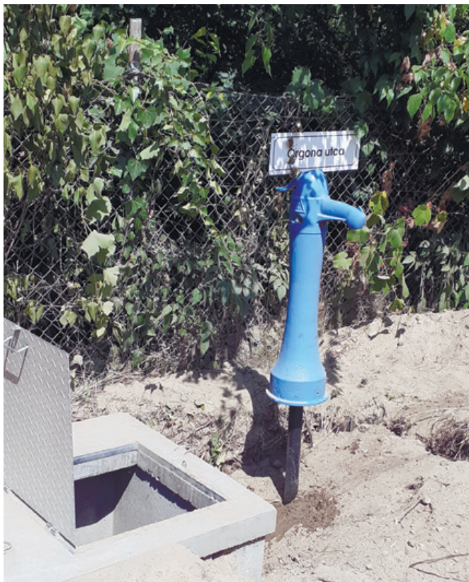
Az új közkút a Sátorfáknál

pig az FKN Kft. tölt fel folyamatosan vízzel. Erre azért volt szükség, mert az ottlakók jelezték, hogy