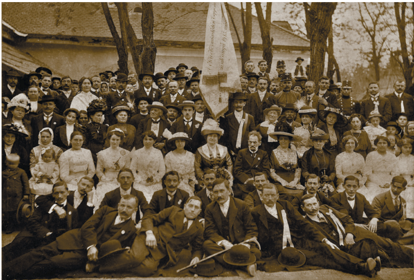
Fóti Iparosok Közművelődési Egyesületének (F.I.K.E.) csoportképe, 1913