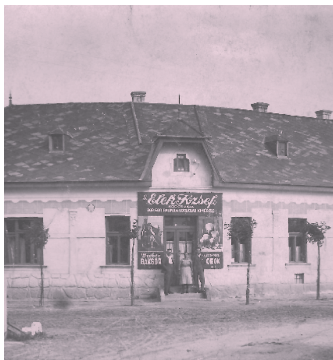
G. Elek József korcsmája, 1930-as évek közepe

bá hangjegyzetek, népszínművek). Talán egyedül a labdarúgás nem szerepel a célok megjelölésénél, eszerint és 1926-os újságok bejegyzéseit figyelembe véve az egyesületnek egy rövid ideig önálló focicsapata is lehetett. A jegyzőkönyvet, amely 1917.12.31-én kelt Fóton, az egyesület új elnöke, Cselényi Zsigmond katolikus kántor szignálta.