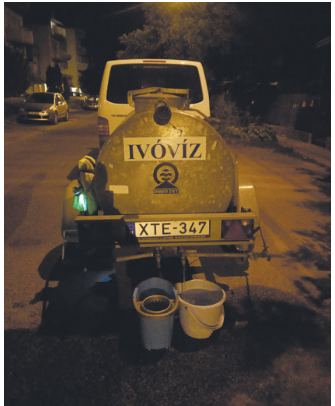
Lajtos kocsi a Szent Benedek utcában

– A Sátorfáknál már az előző vörösköd idején kiktuk az ezer literes víztartályt, amelyet a mai na-