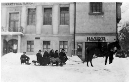
Szánkózás Fóton, 1940-es évek

Télen jobban ráérték a fóti földművesek, így például a reformátusok többet jártak templomba és több idő jutott a családtagoknak is egymásra. A téli időszakban mivel nagy havazások voltak az emberek gyakran szánokon közlekedtek. Minden nagyobb családnak volt ekkoriban szánja, melyeket asztalos készített, általában nem festették őket és a fészerben tárolták, ahol a lovas kocsikat is. A gyerekek nagyon élvezték a téli időszakot és mindenféle játékos elfoglaltságot találtak ki maguknak.