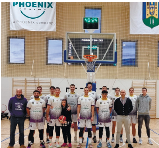
Viri és a csapat

Meséltél egy Toldi versenyről is. Az hogyan jött egy lánynak?