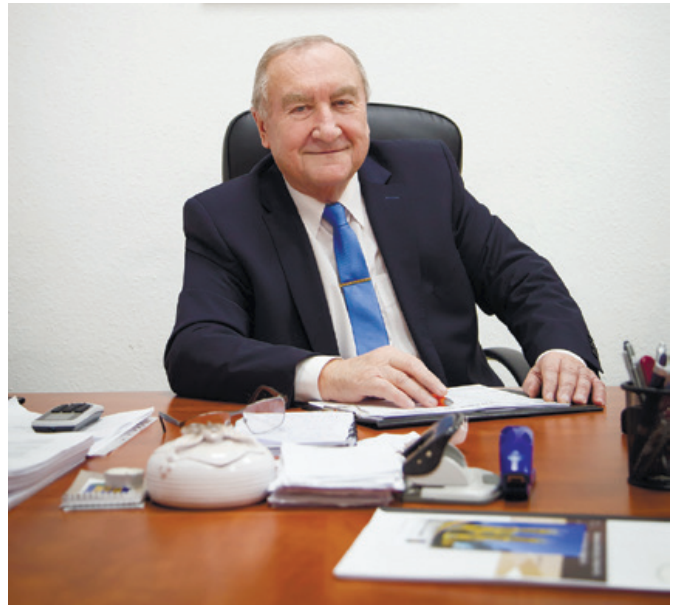
Dr. Vass György polgármester

– Számunkra nagyon fontos, hogy se a gyerekeink, se az időseink ne fázzanak! Tehát a bölcsődében, az óvodákban és az idősek napköziotthonában 23 fokos hőmérsékletet biztosítunk és külön odafigyelünk arra, hogy a gyermekek által használt csoportszobákban a hőmérsékletet a talajhoz közel, 40 cm-es magasságban mérjük.