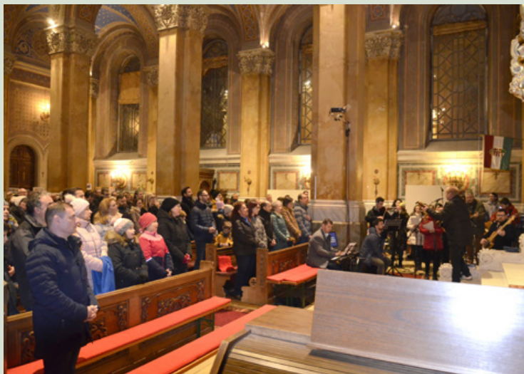
A Házasság Hete egy gitár zenével kísért szentmisével kezdődött a Szeplőtelen Fogantatás Templomban