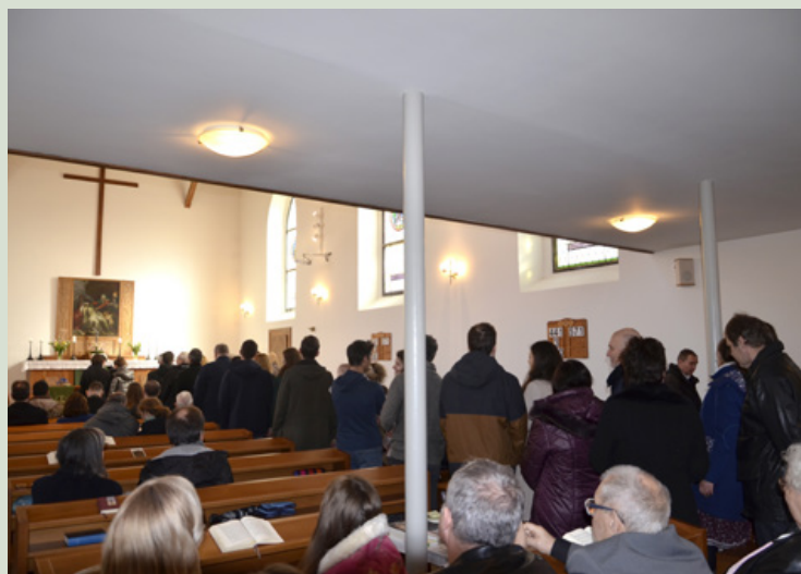
A Házasság Hete záróalkalmán sorban álltak a házaspárok az áldásra várva