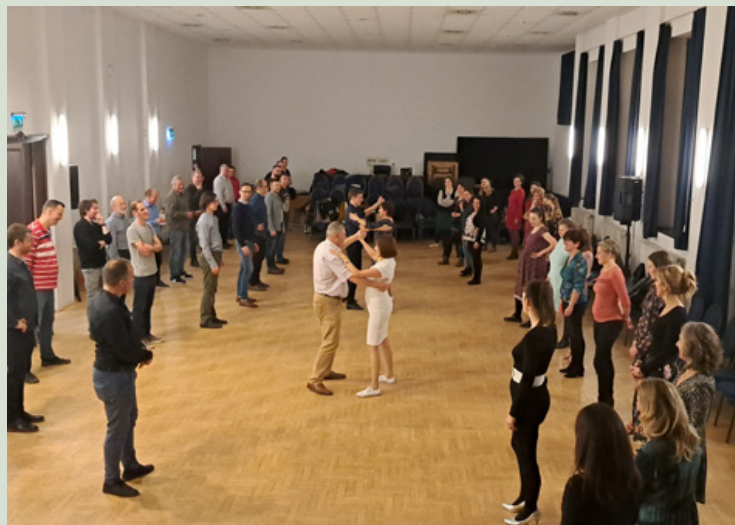
Az eseménysorozatban házaspároknak Cha-Cha-Cha és modern tánc oktatás is volt